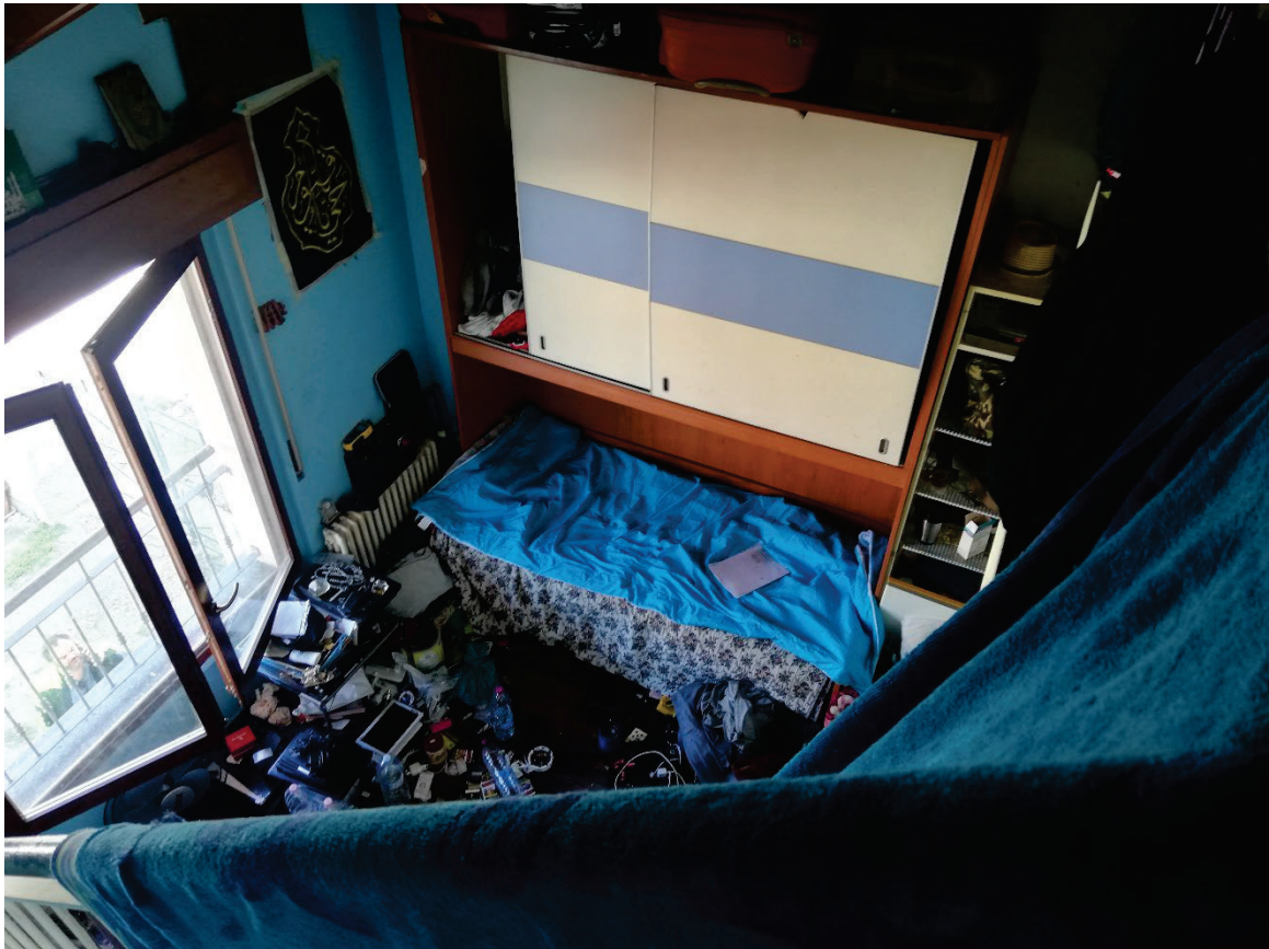
Fg.43 Part.4 Sub.811. Camera