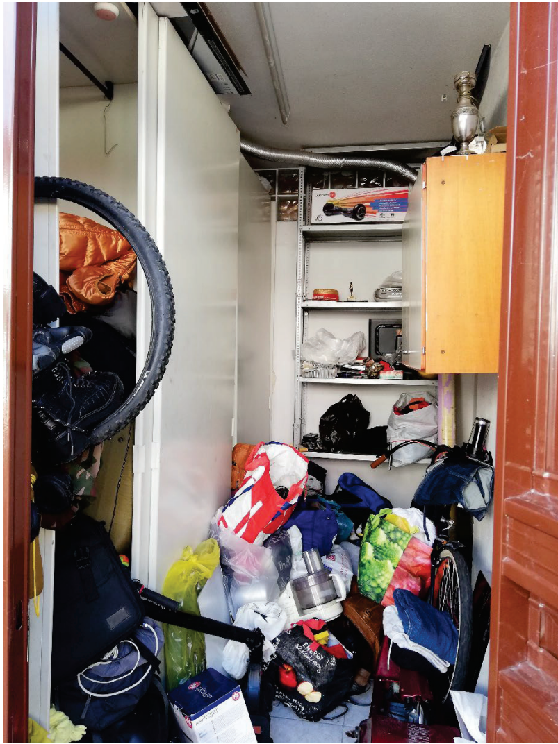
Fig.43 Part.4 Sub.812. Box