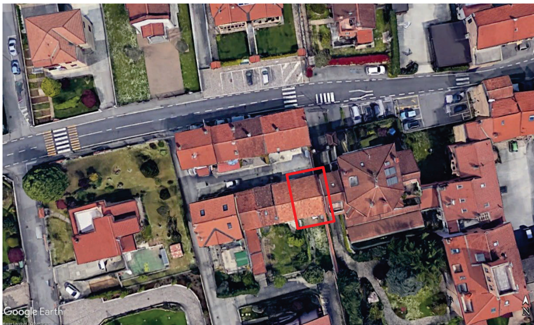
Fg.43 Part.4 Sub.811/812. Inquadramento