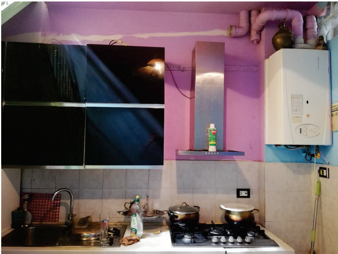
Fg.43 Part.4 Sub.811. Cucina