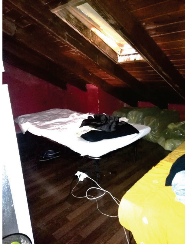
Fg.43 Part.4 Sub.811. Soppalco (non autorizzato)