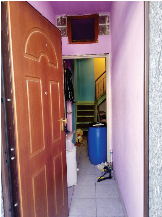
Fg.43 Part.4 Sub.811. Ingresso