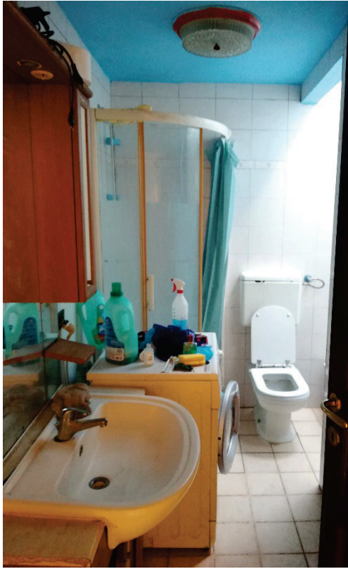
Fg.43 Part.4 Sub.811. Bagno