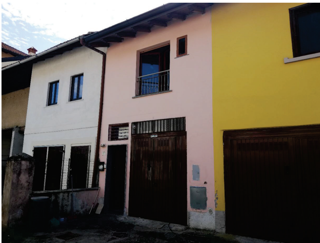
Fg.43 Part.4 Sub.811/812. Vista da corte interna