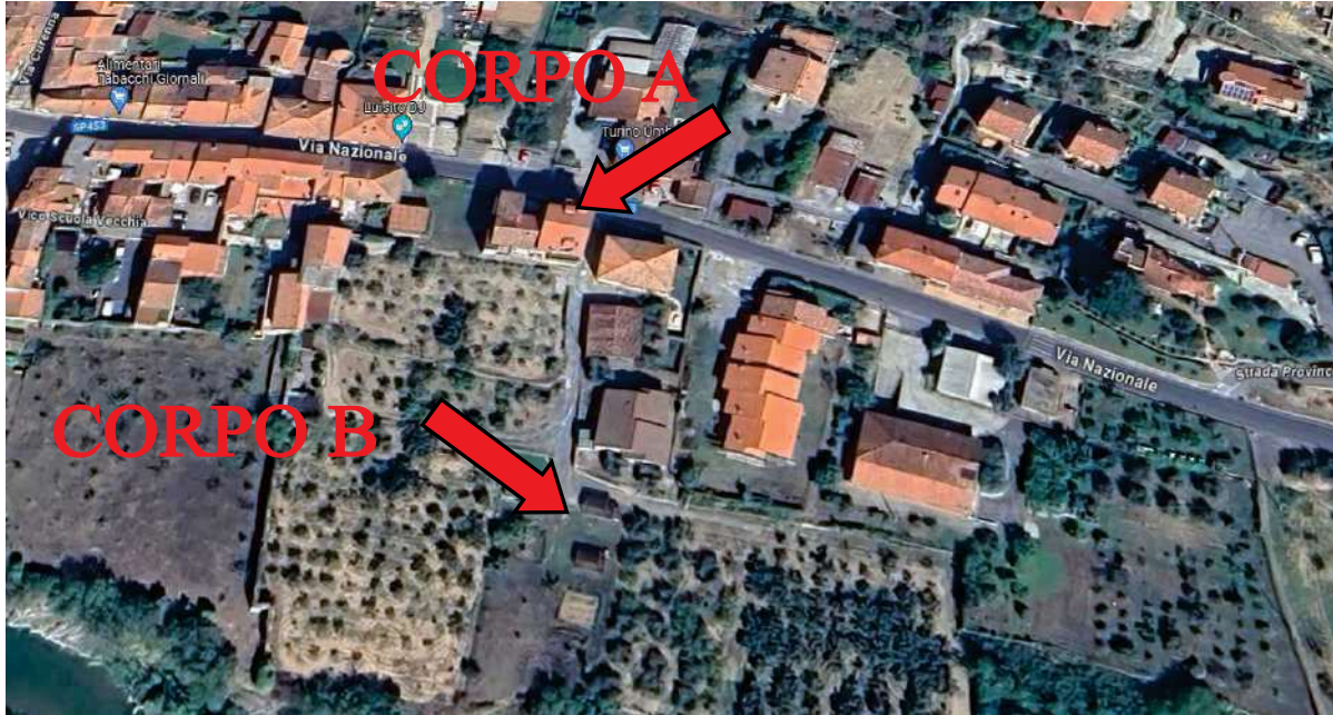
Foto 1 – Vista satellitare di Ortovero, Fraz. Pogli, Via Pogli – Via Nazionale civ. 21 con ubicazione dell'immobile

Comune di Ortovero, Fraz. Pogli, Via Pogli – Via Nazionale civ. 21, int. s.n