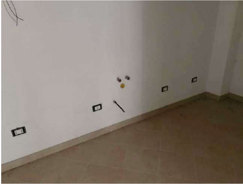
Foto 11 – Vista predisposizione allacci idraulici e prese elettriche angolo cottura