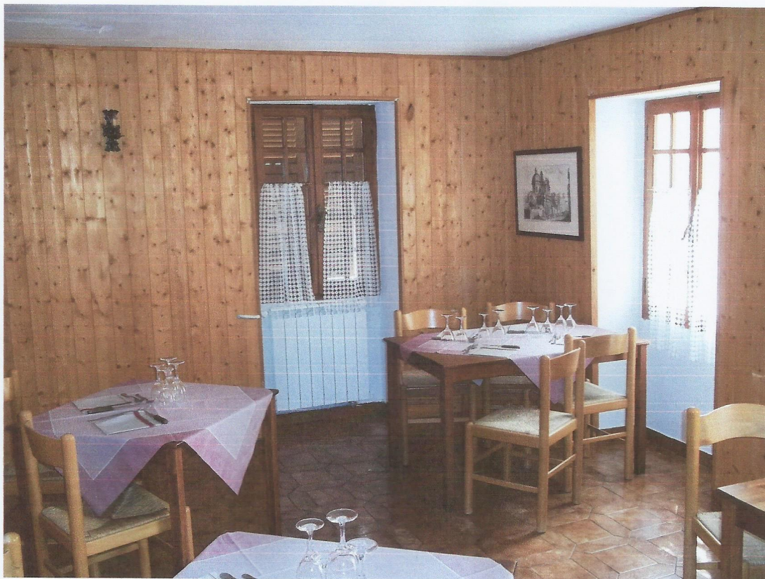
VISTA SALA RISTORANTE 2 PRIMO PIANO