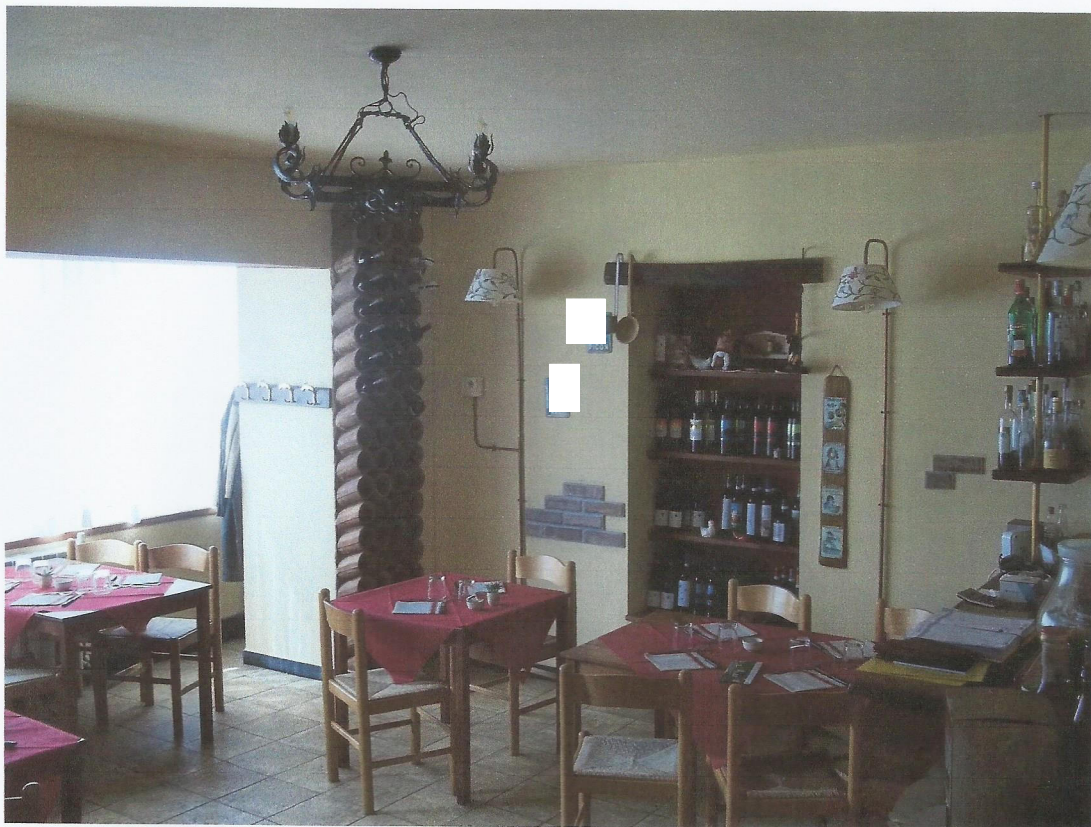
VISTA CUCINA RISTORANTE PIANO TERRENO