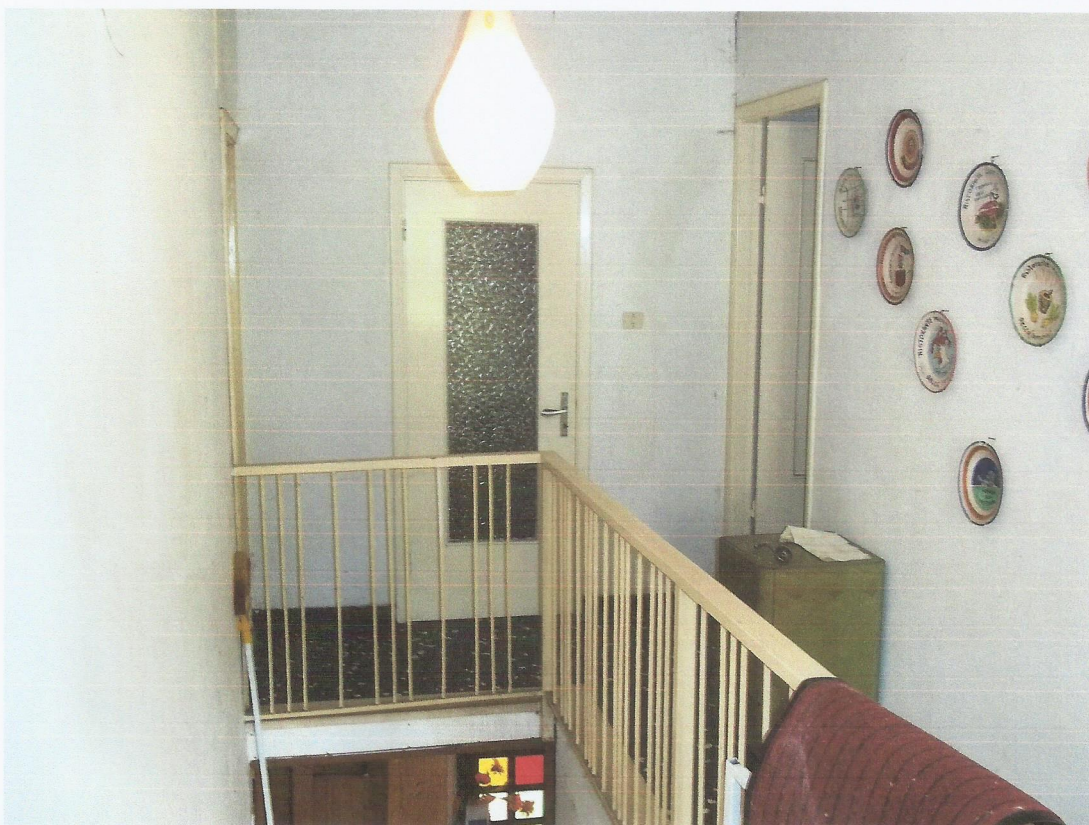
VISTA PARTICOLARE SCALA