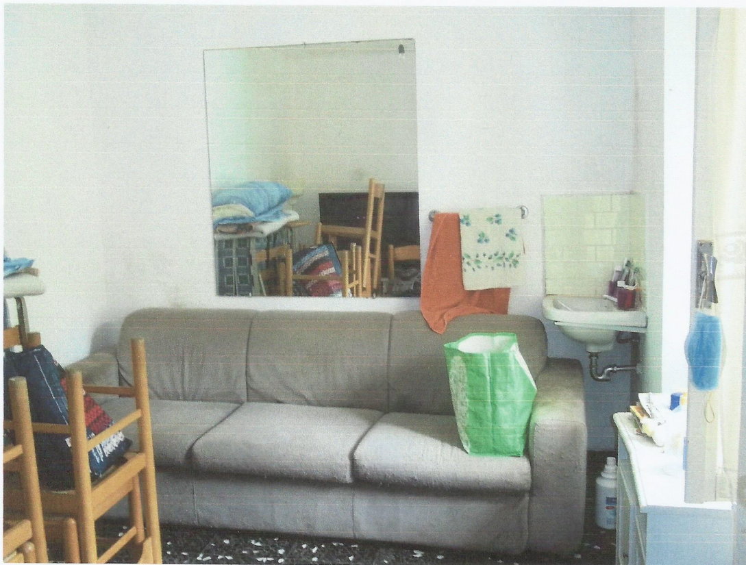
VISTA DEPOSITO SECONDO PIANO