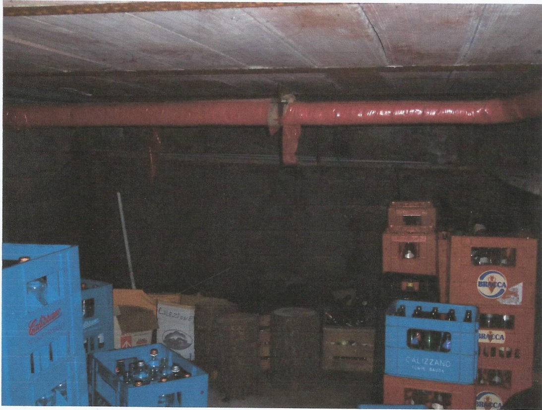
VISTA LOCALE CALDAIA PIANO SEMINTERRATO