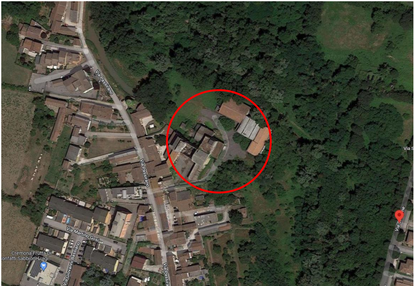
Immagine satellitare Google maps