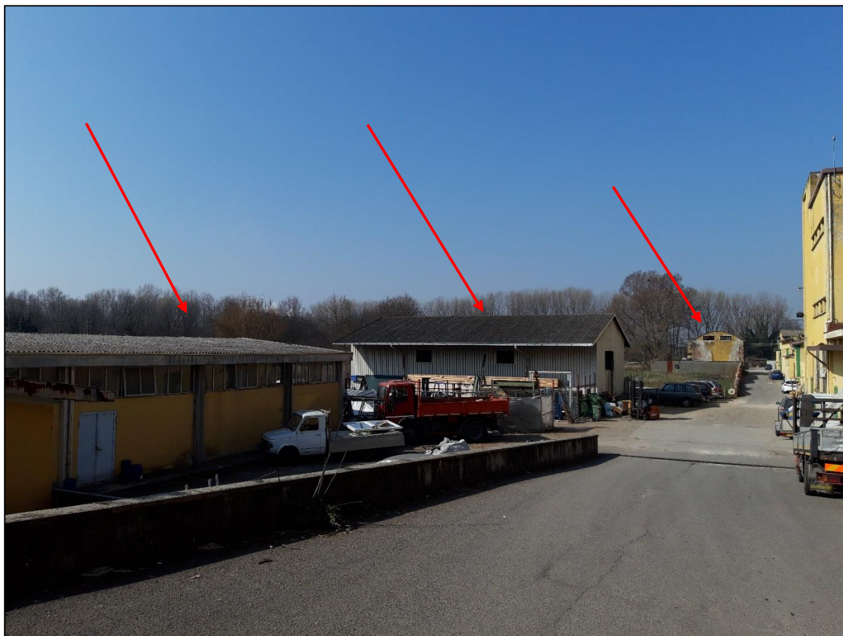
Foto n. 3 e 4 – Vista dei capannoni da strada interna al complesso di propr. di terzi