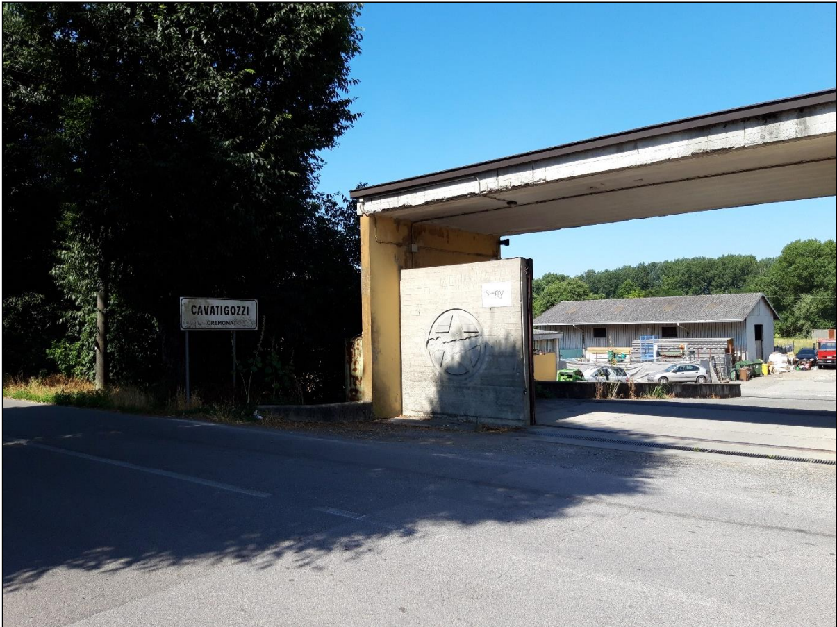
Foto n. 1 e 2 - Vista ingresso al complesso da Via Stazione