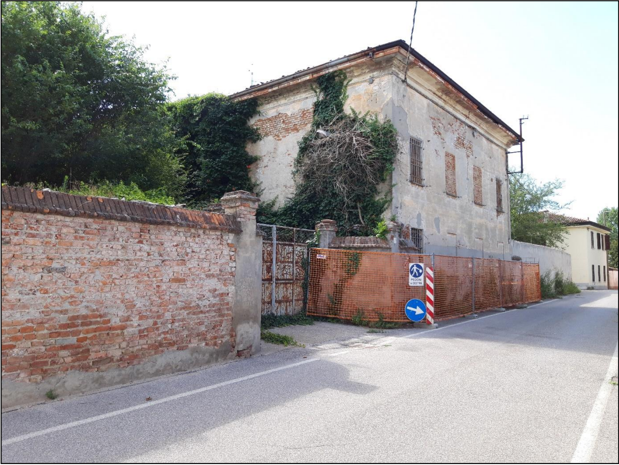
Foto n. 17 e 18 - altra Vista da Via Casanova