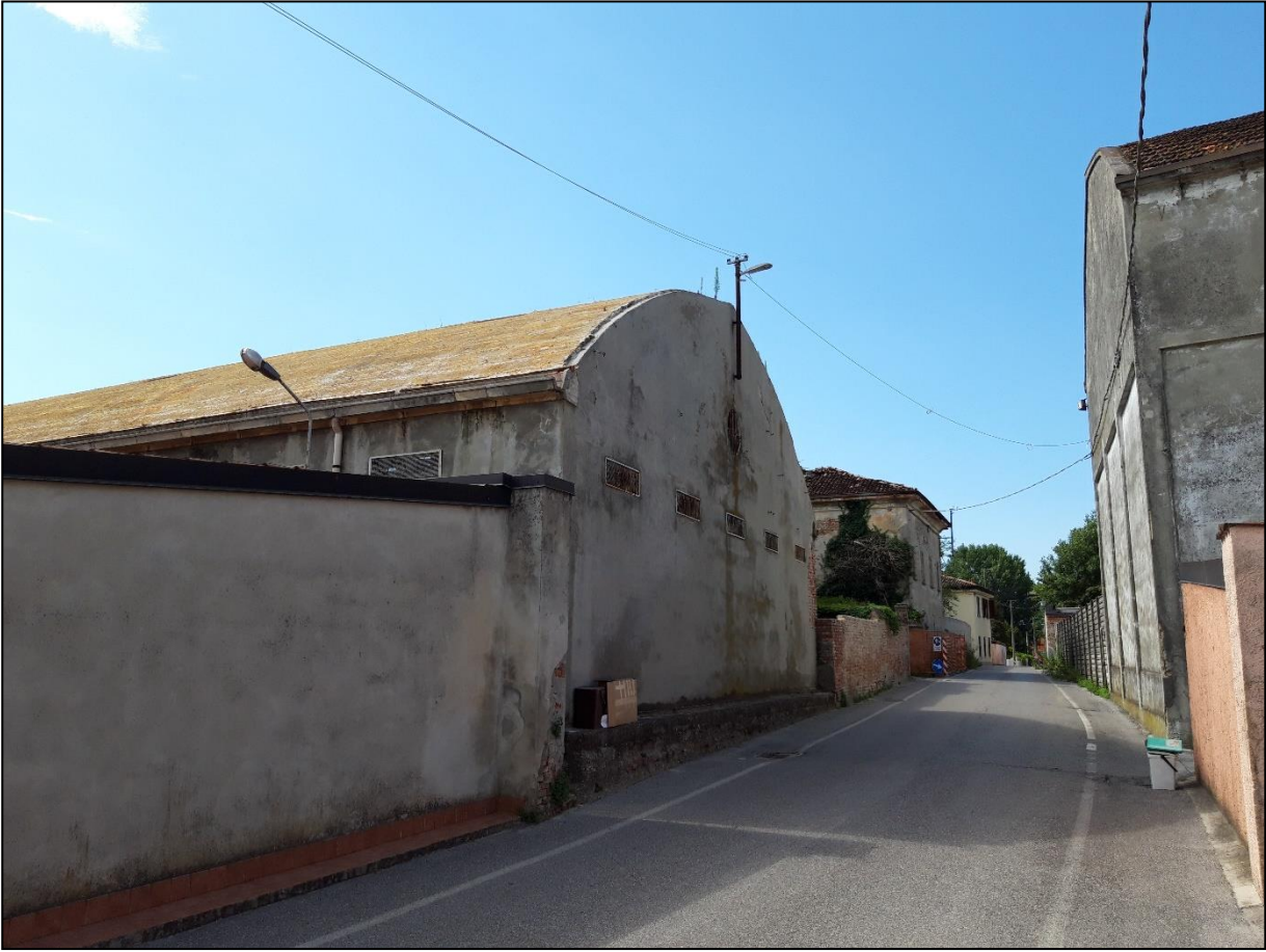
Foto n. 15 e 16 - Vista da Via Casanova