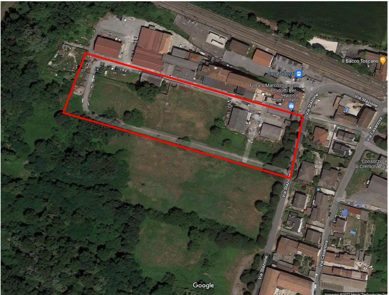
Immagine satellitare Google maps