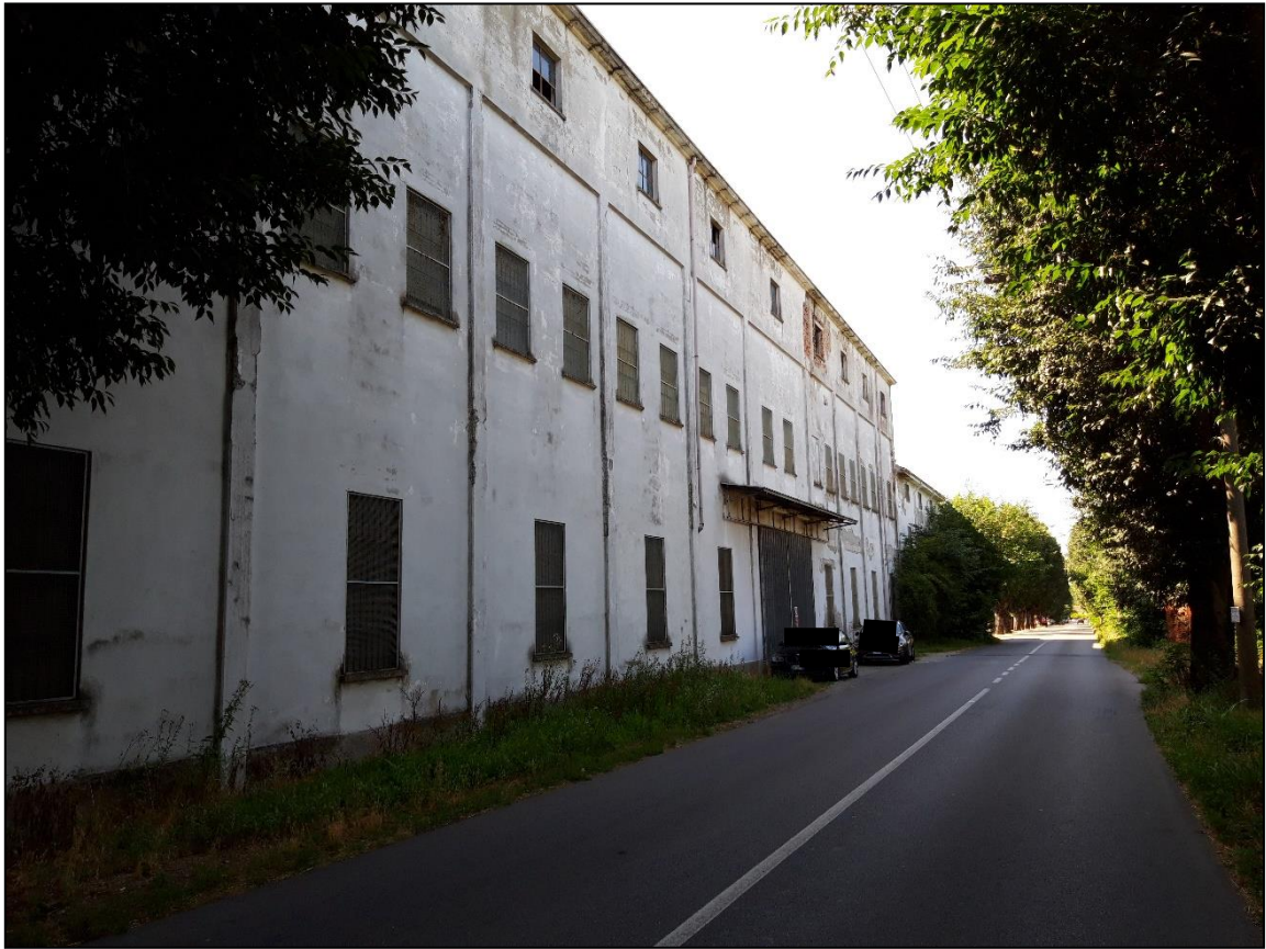
Foto n. 1 e 2 - Vista da Via Stazione