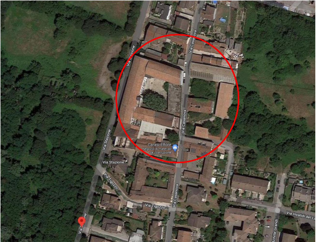
Immagine satellitare Google maps