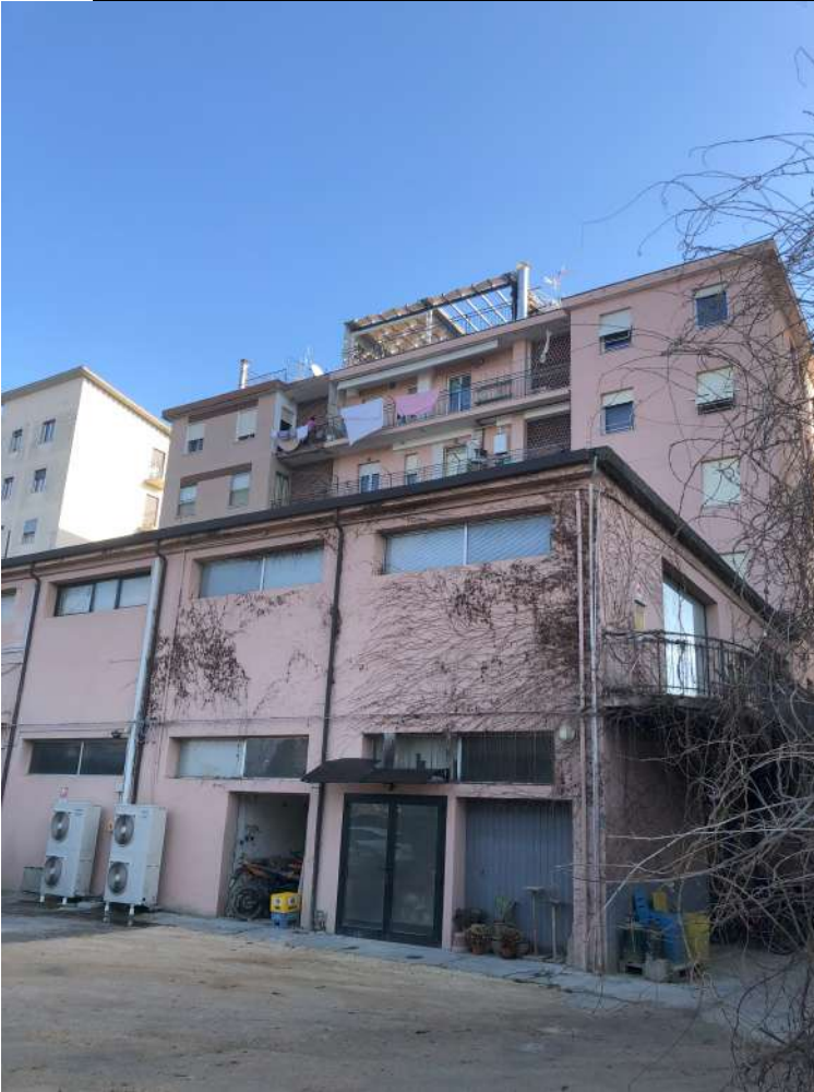
Foto 3- retro prospetto