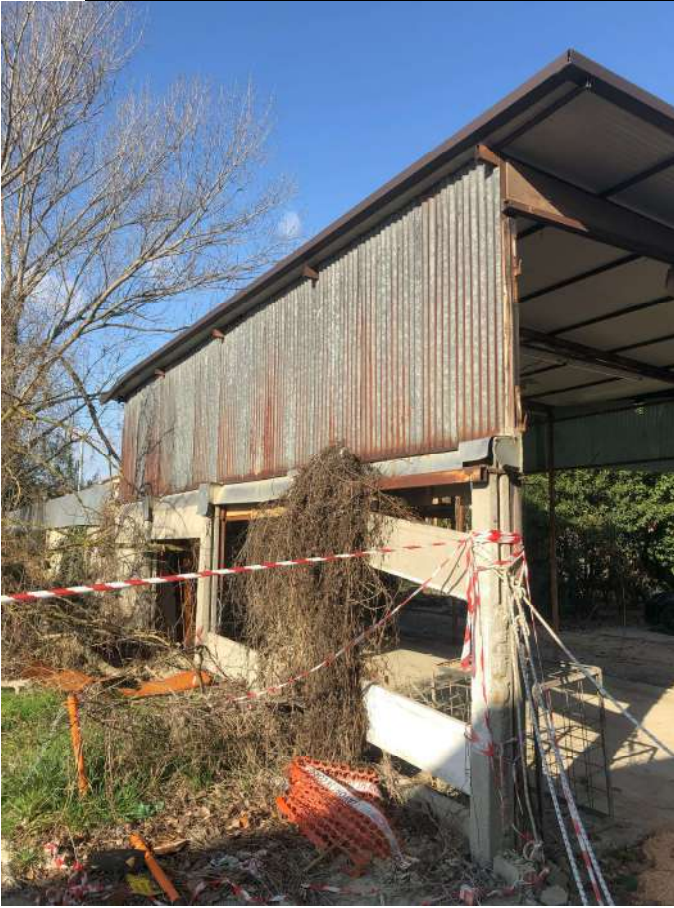
Foto 27- Piano S1/ TERRA -Sub.17 Deposito