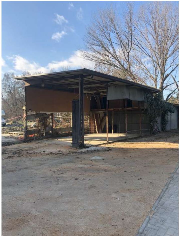
Foto 26- Piano S1/ TERRA -Sub.17 Deposito