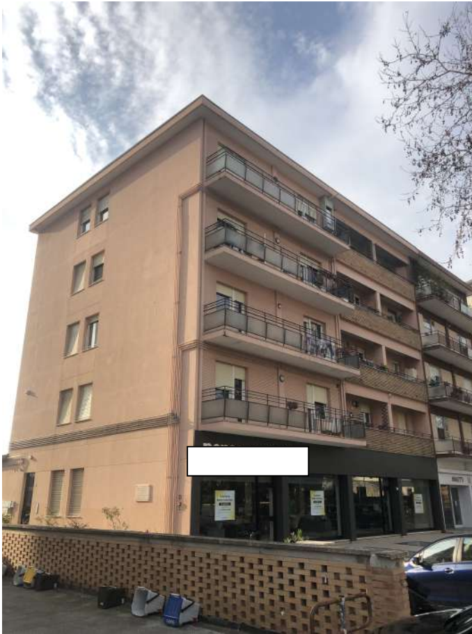
Foto 1- Prospetto frontale e laterale da viale Salinatore