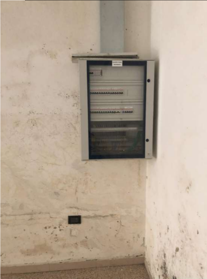
Foto 15- Piano 1° seminterrato – mostra (DETTAGLIO QUADRO ELETTRICO)