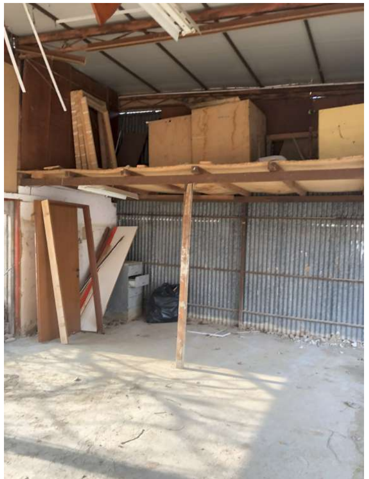
Foto 28- Piano S1/ TERRA -Sub.17 Deposito