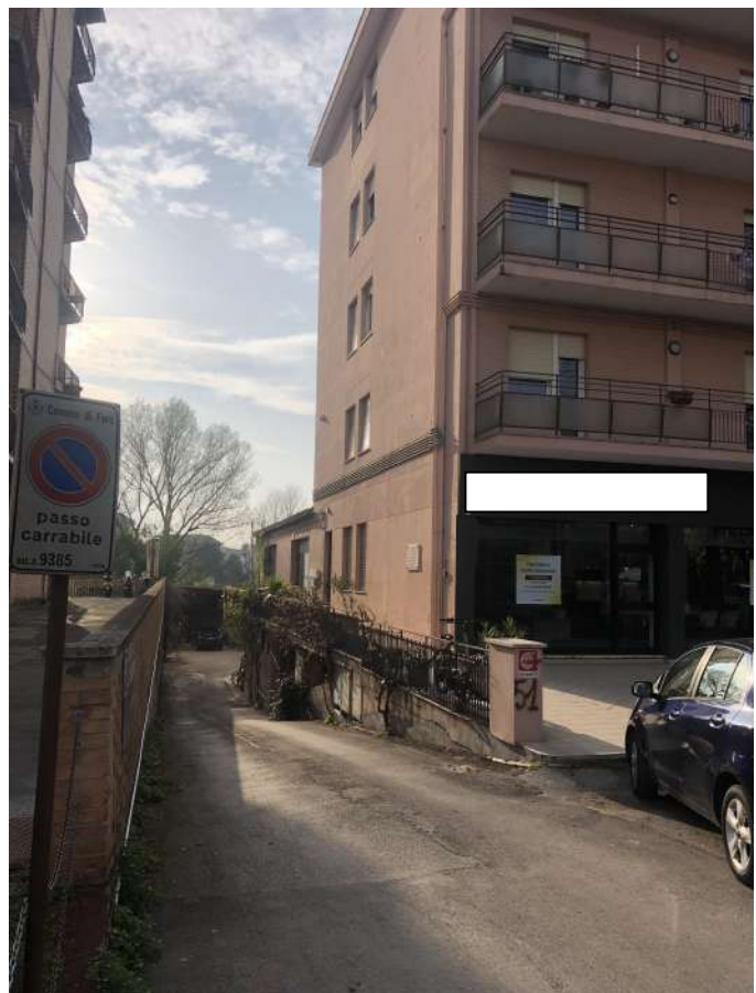
Foto 2- Prospetto laterale e rampa da viale Salinatore