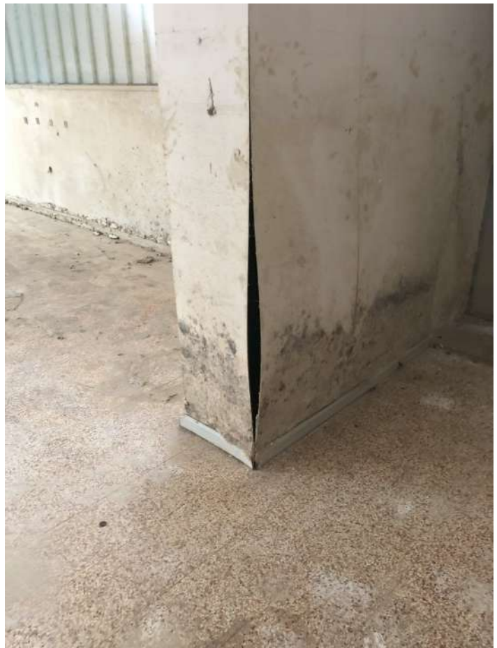
Foto 16- Piano 1° seminterrato – mostra (dettaglio danno da alluvione)