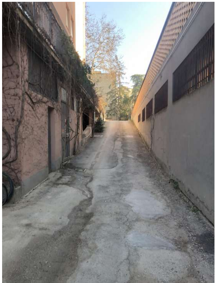
Foto 4- rampa laterale d'accesso alla corte