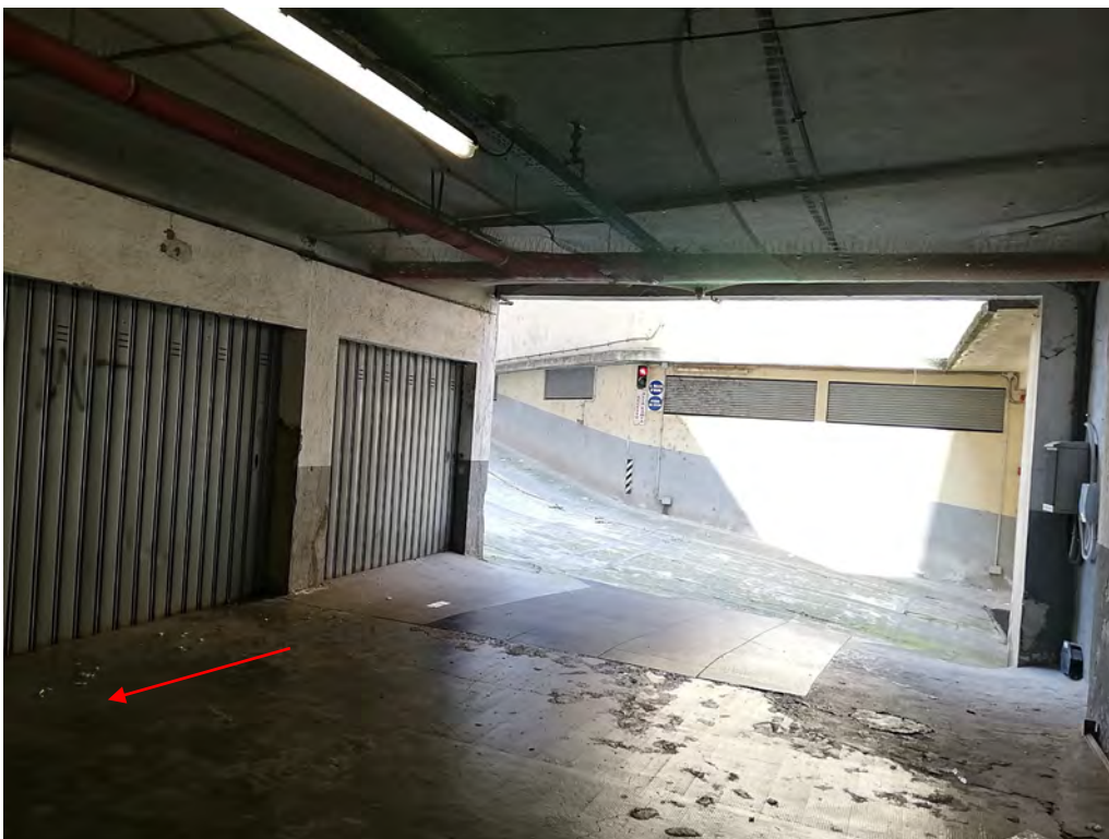
Inquadramento territoriale - vista del fabbricato e individuazione zona accesso sub. 6