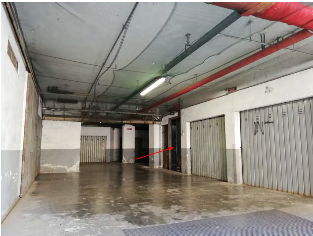
Vista zona accesso e individuazione sub. 6

Nota: con riguardo allo stato di conservazione, il fabbricato nel suo complesso, può trovarsi in condizioni: ottime, buone, normali, scadenti e degradate.