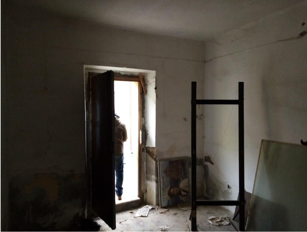
foto 7 - vano al piano terreno - accesso dalla strada