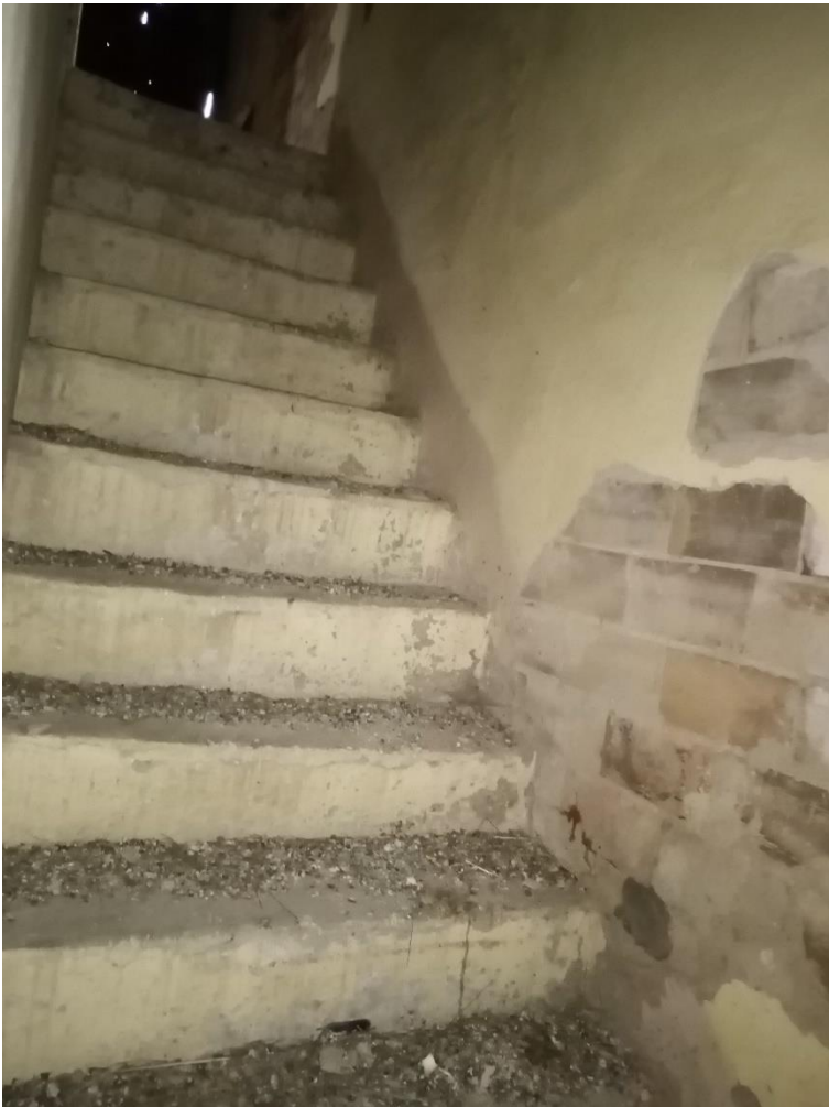
foto 8 - scala