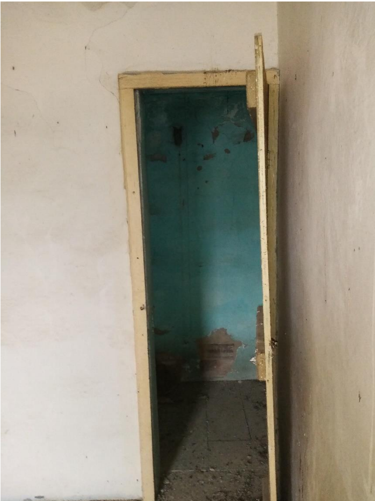
foto 12 - ripostiglio al piano primo