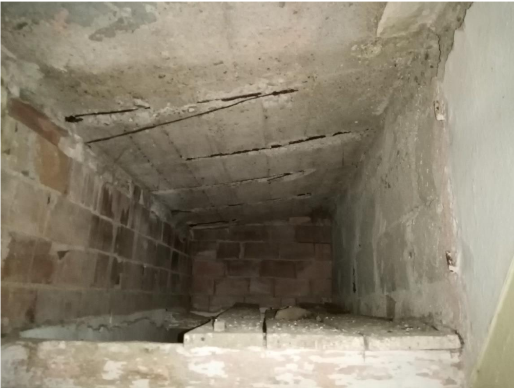
foto 14 - soffitto vano scala