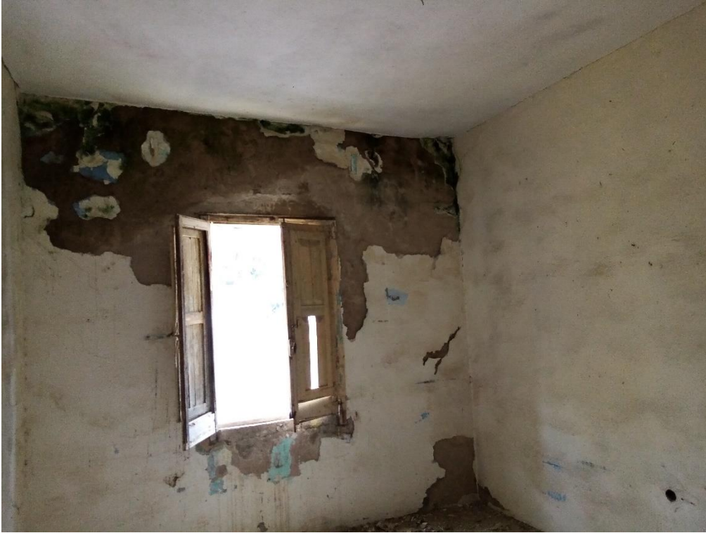
foto 9 - vano al piano primo