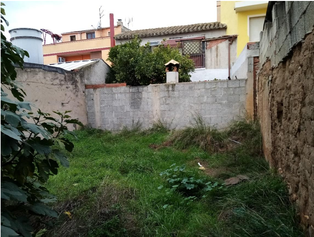
foto 18 - cortile