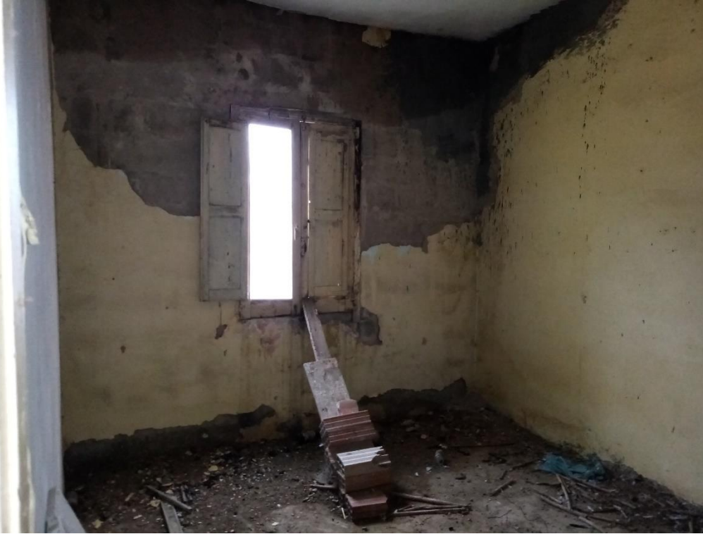
foto 13 - vano al piano primo