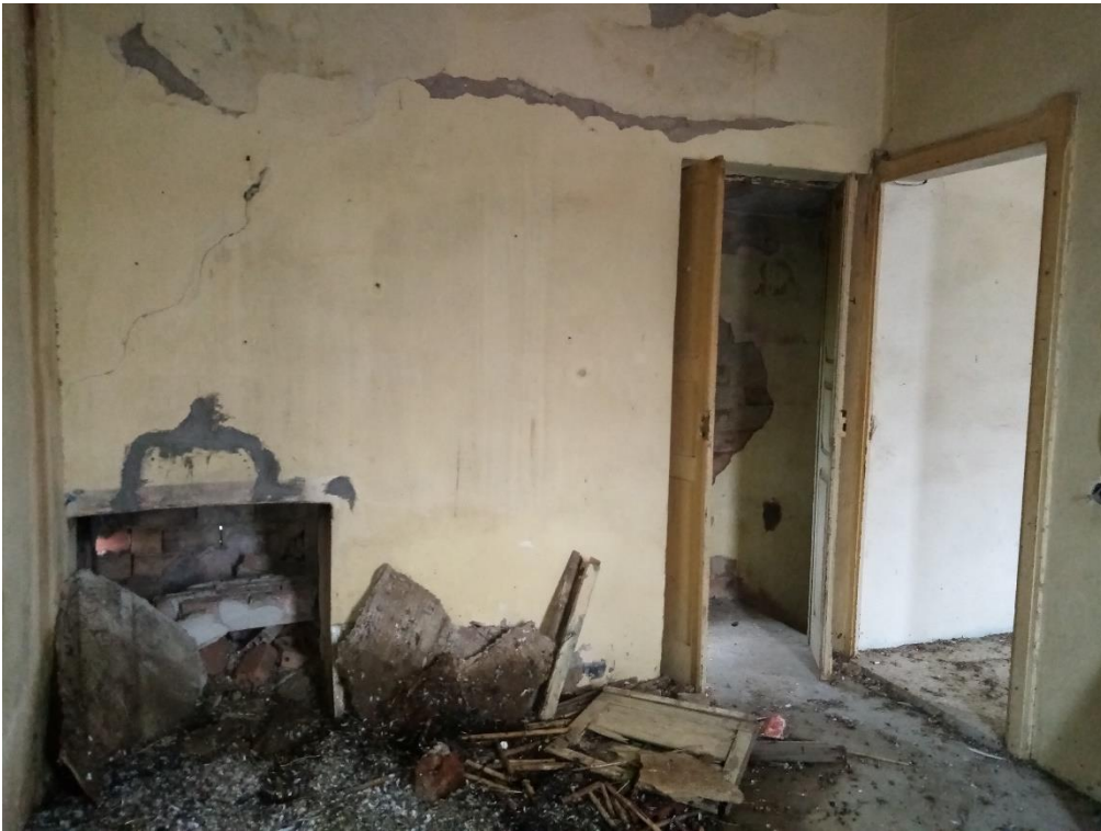
foto 10 - vano al piano primo