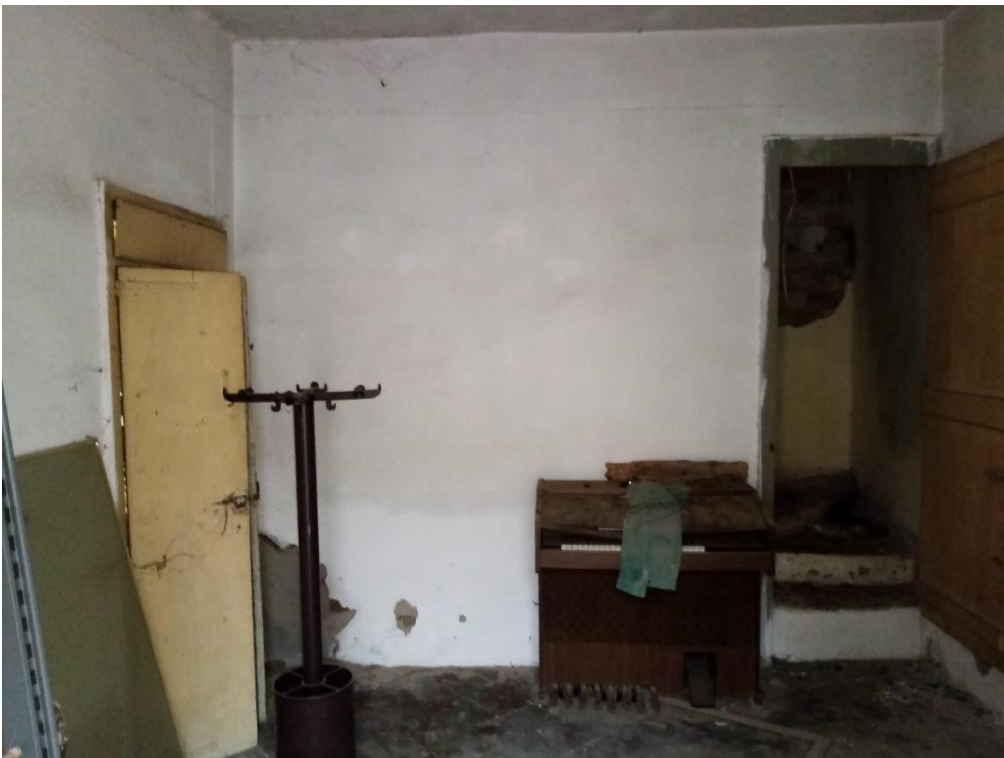
foto 6 - vano al piano terreno verso accesso alla scala