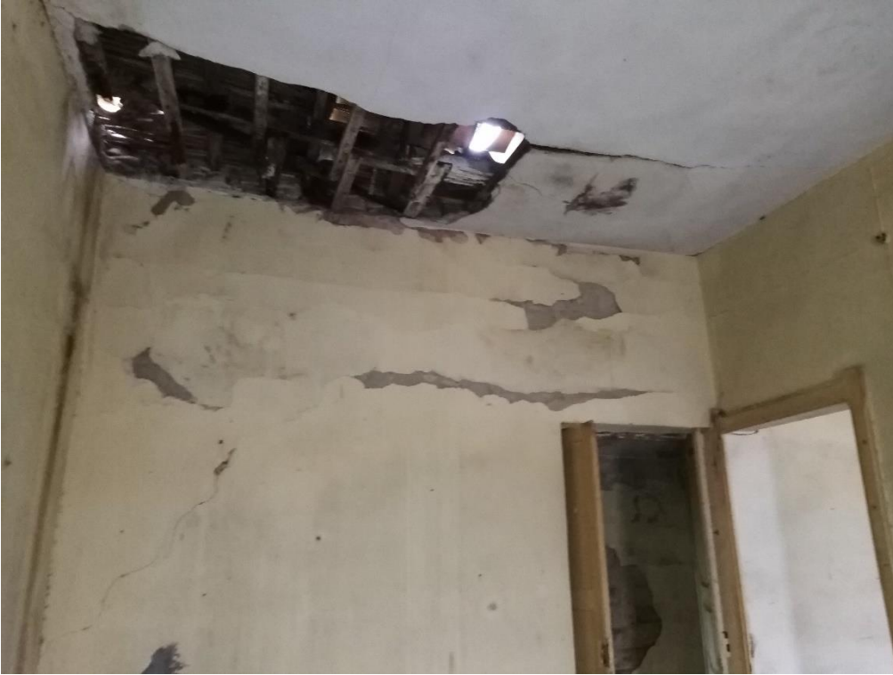
foto 11 - soffitto piano primo