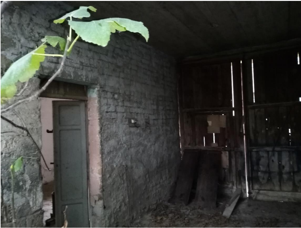
foto 5 - portone in legno e ingresso all'abitazione