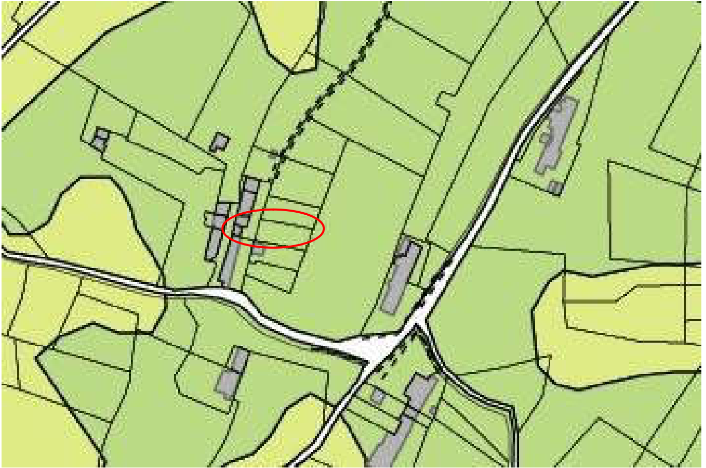
Estratto Cartografia strumento urbanistico vigente ZTO E3