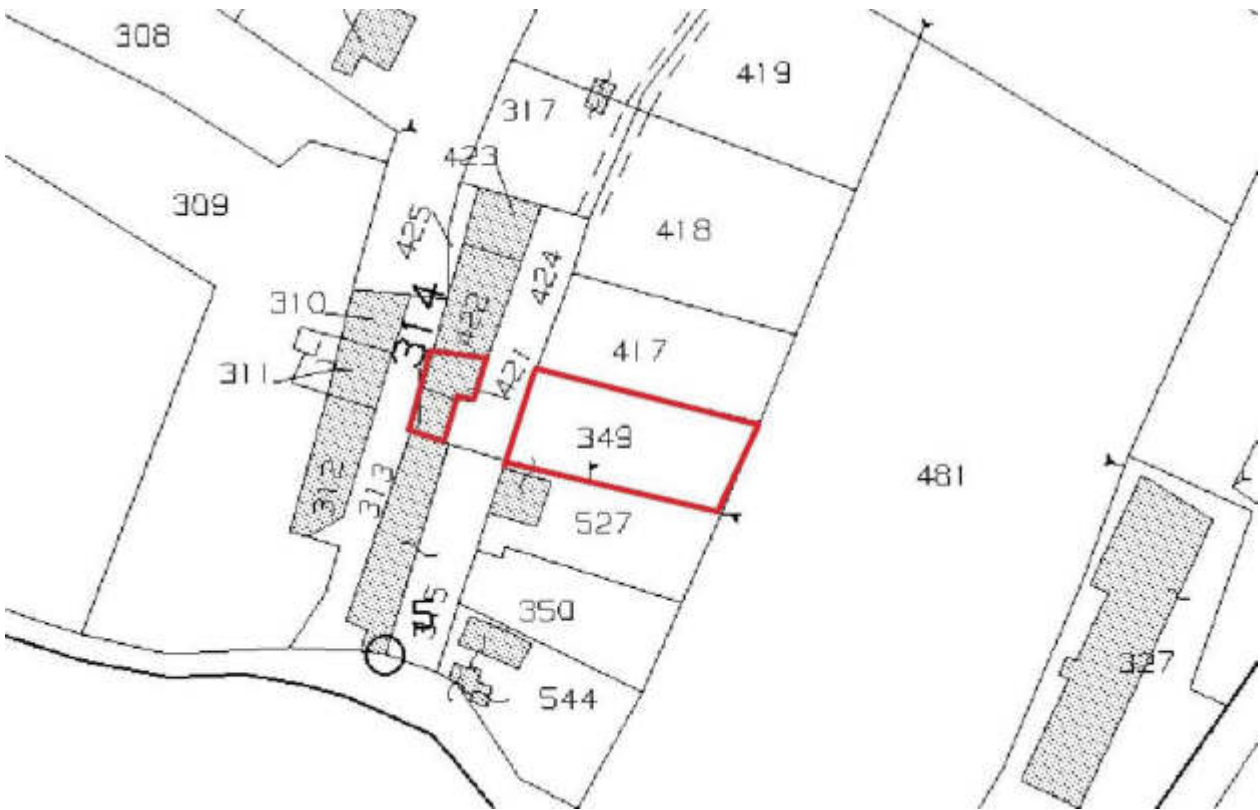
Estratto catastale attuale foglio 22 particelle 314-421-349