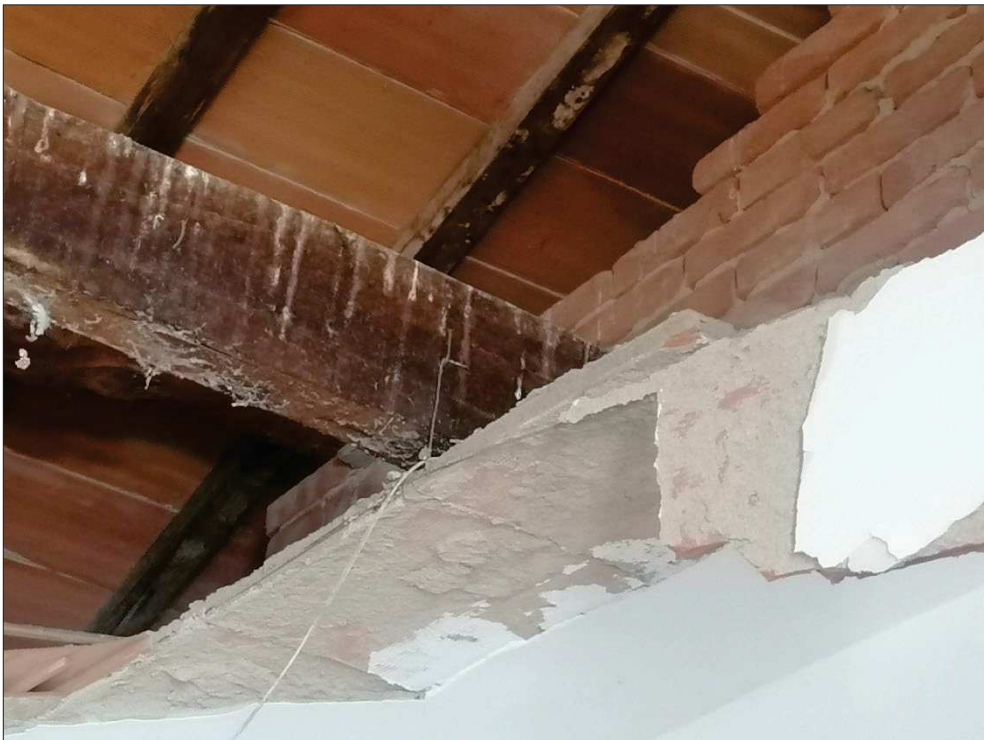
Particolare aggancio controsoffitto