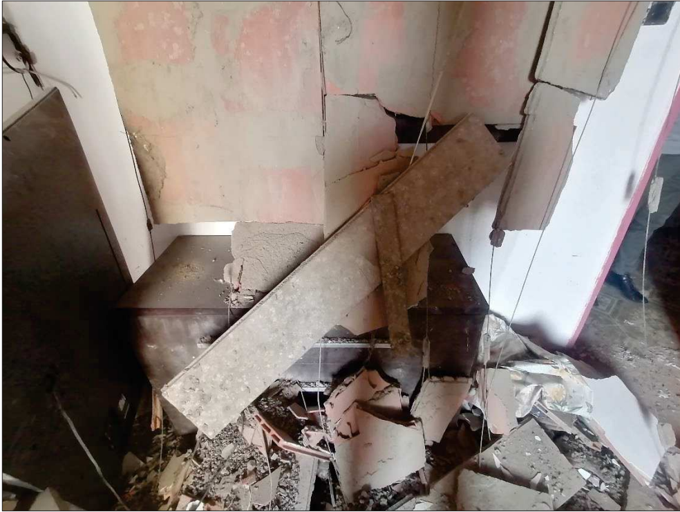
Particolare sistema controsoffitto in laterizio