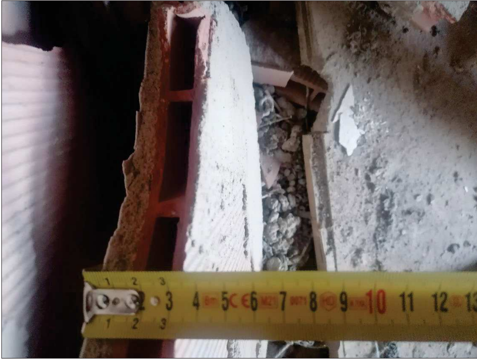
Particolare spessore tavola