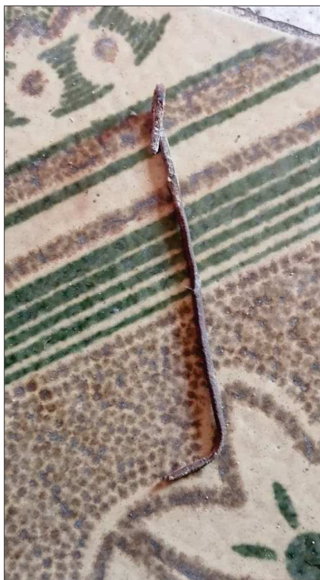
Particolare fissaggio controsoffitto