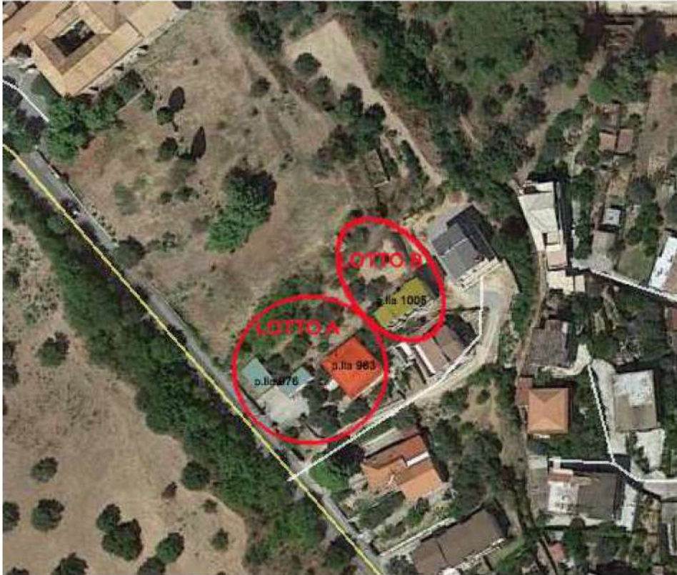
Fig.2_ Particolare fotografico relativo ai fabbricati oggetto di pignoramento.