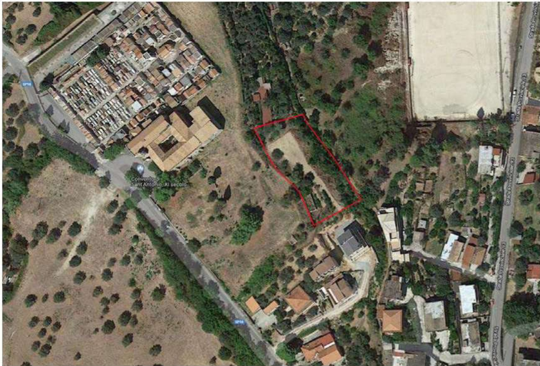
Fig.3_ Particolare fotografico relativo al contesto urbanistico del Lotto C con individuazione in rosso della particella 1003.

Il terreno oggetto della sopradetta particella, viene indicato nel prosieguo della presente relazione e negli allegati con il nome di LOTTO C , e consiste in un terreno con conformazione geometrica pressochè rettangolare, ubicato nella zona a nord del territorio stignanese, oltre il centro storico, e precisamente nella località Convento, a poca distanza dalla strada provinciale 98 e dal Convento di Sant'Antonio da Padova (fig.3).