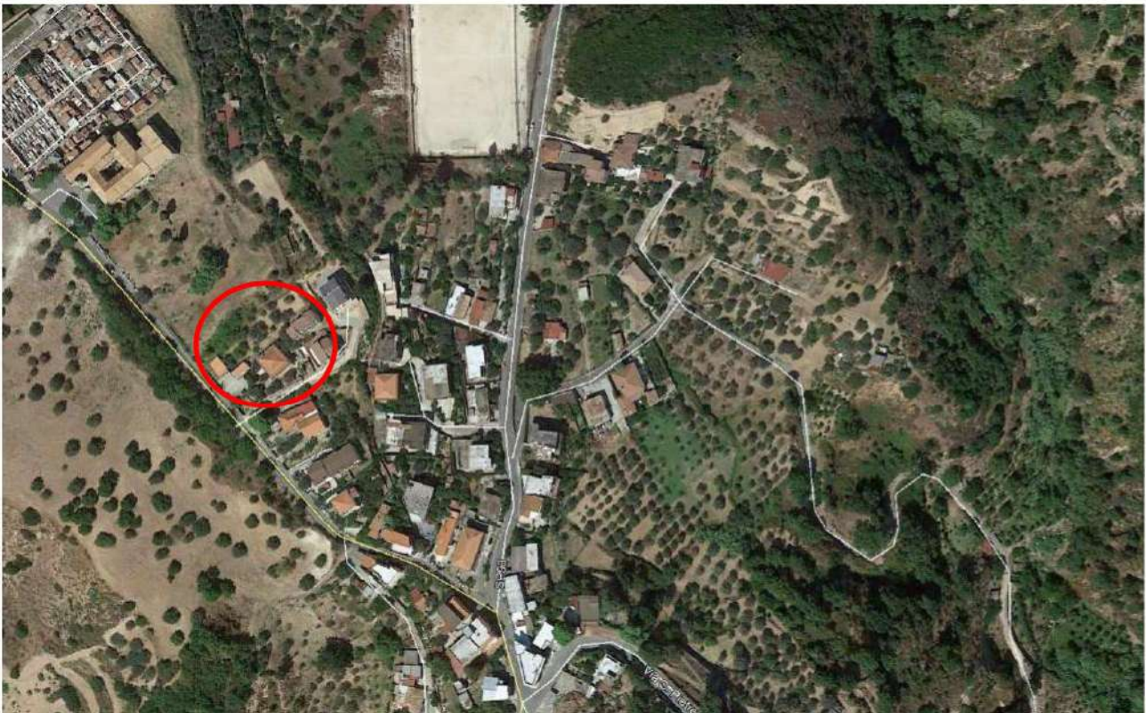
Fig.1_ Particolare fotografico relativo al contesto urbanistico costituito in prevalenza da edifici a destinazione residenziale.

Trattasi di immobili posti al di fuori del centro storico del comune di Stignano, in prossimità del Convento di Sant'Antonio da Padova (fig.1). Il contesto urbano in cui si collocano è pressoché residenziale, dista circa 500 metri dal centro abitato. In esso sono presenti i servizi di una cittadina di circa 1.363 abitanti (fig.2).