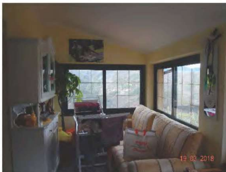
FOTOGRAFIA N. 14

Da qui si accede alla cucina - soggiorno (vedasi fotografia sottostante )