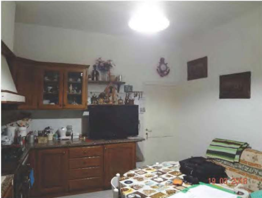
FOTOGRAFIA N. 8

dal quale , a sua volta, si accede agli altri vani quali la cucina (vedasi fotografia sottostante )