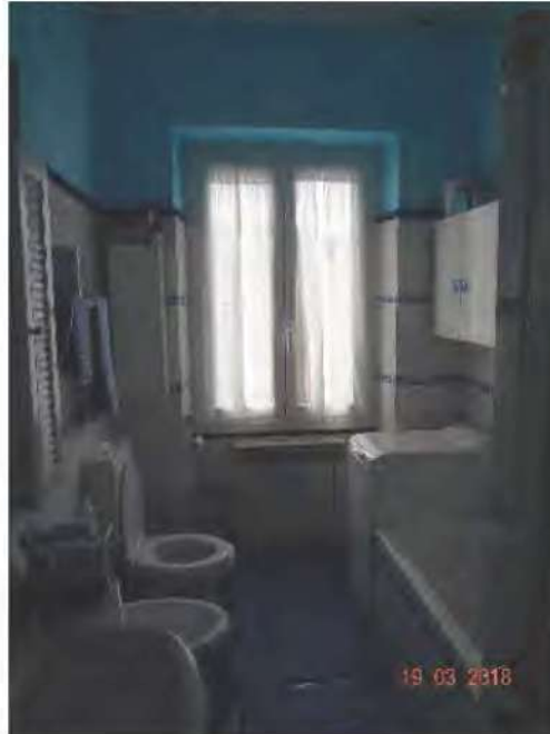
FOTOGRAFIA N. 19

- un bagno dotato di lavabo, mezza vasca e doccia, tazza w.c. e bidet, finestra prospiciente il lato nord ovest del fabbricato (vedasi fotografia sottostante )