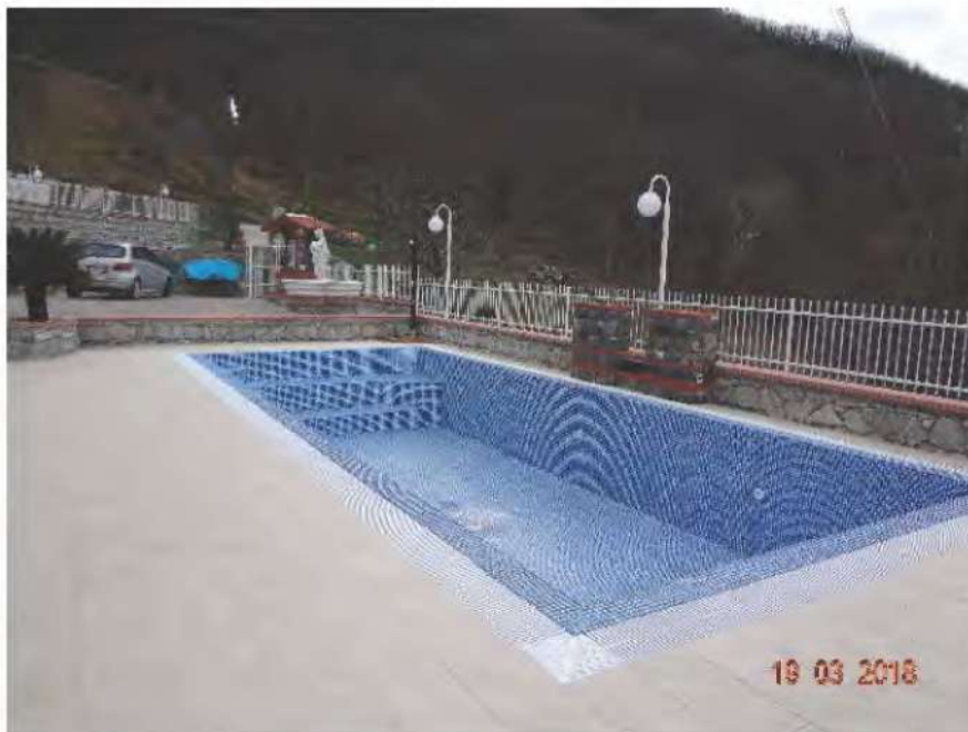
FOTOGRAFIA N. 3

c) una area urbana censita al N.C.E.U. del Comune di San Colombo Certenoli al foglio 23, particella 410, subalterno 9, sulla quale insiste una piscina (vedasi fotografia sottostante)