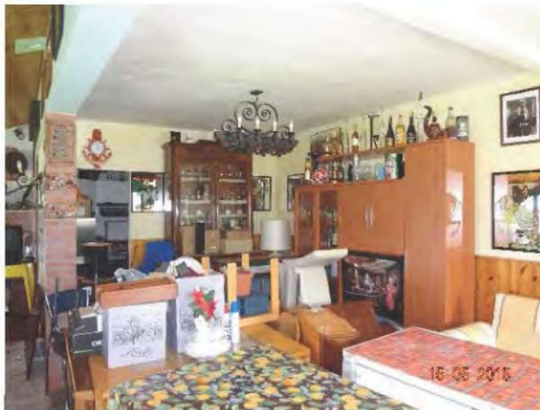
FOTOGRAFIA N. 23

All'interno si trova collocato un forno a legna ed una zona adibita a cucina (vedasi fotografia sottostante)