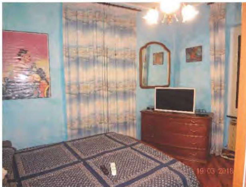
FOTOGRAFIA N. 20

- una terza camera da letto dotata di doppia finestra prospicienti il lato nord ovest e sud ovest del fabbricato (vedasi fotografia sottostante )