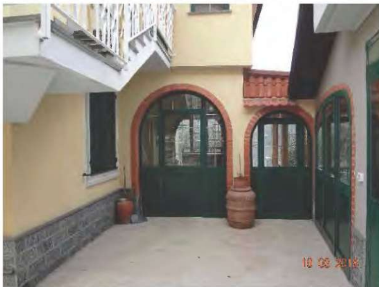
FOTOGRAFIA N. 5

L'accesso avviene da sud - ovest (vedasi fotografia sottostante)