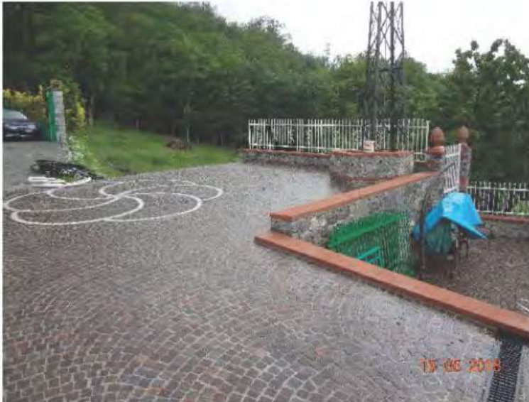
FOTOGRAFIA N. 27

La rimanente parte dell'area è pavimentata e ciò anche nelle immediate vicinanze del fabbricato (vedasi fotografia sottostante)