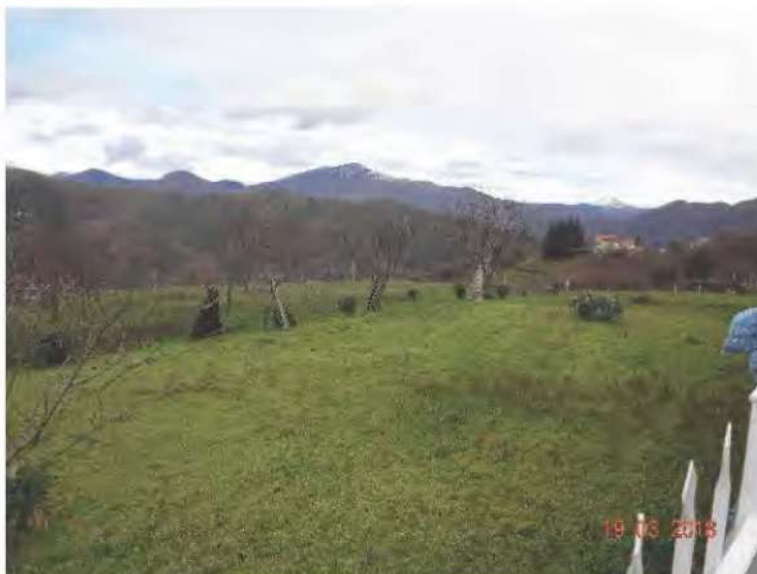
FOTOGRAFIA N. 28

mentre la parte posta a nord dei fabbricati è sistemata a prato (vedasi fotografia sottostante)