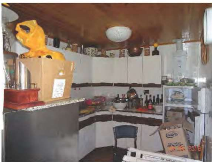
FOTOGRAFIA N. 24

All'interno si trova collocato un forno a legna ed una zona adibita a cucina (vedasi fotografia sottostante)