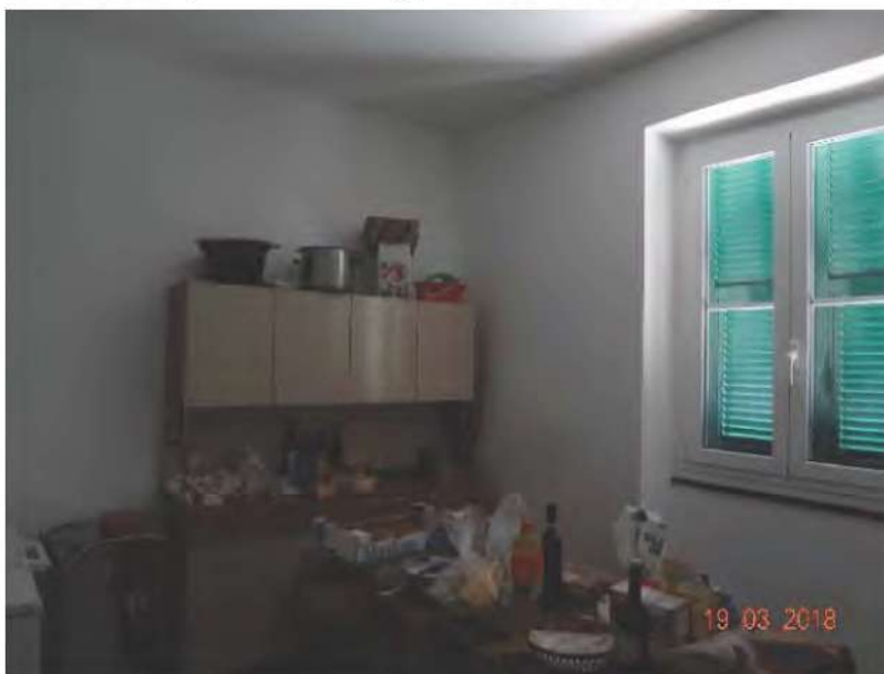
FOTOGRAFIA N. 9

un ampio locale utilizzato come ripostiglio, dotato di doppia finestra (vedasi fotografia sottostante )