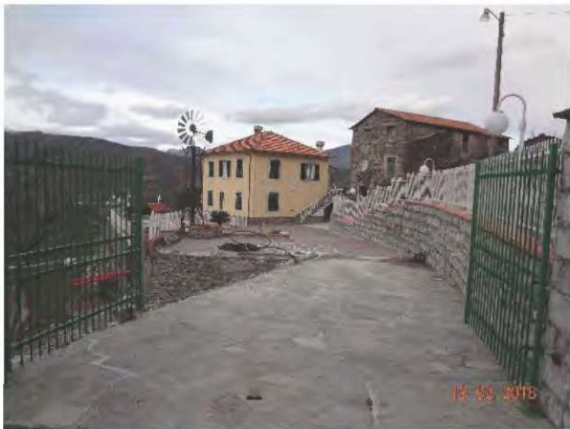
FOTOGRAFIA N. 25

L'area confina ad ovest con la strada comunale e qui si trova l'accesso al comparto (vedasi fotografia sottostante)