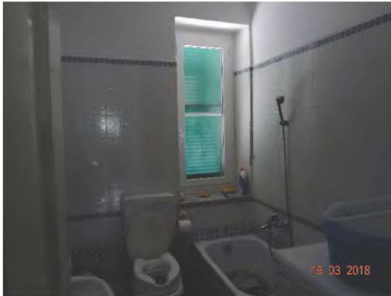
FOTOGRAFIA N. 10

un bagno dotato di lavabo, mezza vasca e doccia, tazza w.c. e bidet, finestra prospiciente il lato nord ovest del fabbricato (vedasi fotografia sottostante )