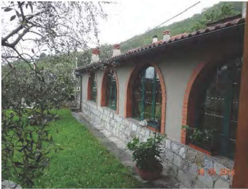
FOTOGRAFIA N. 2

c) una area urbana censita al N.C.E.U. del Comune di San Colombo Certenoli al foglio 23, particella 410, subalterno 9, sulla quale insiste una piscina (vedasi fotografia sottostante)