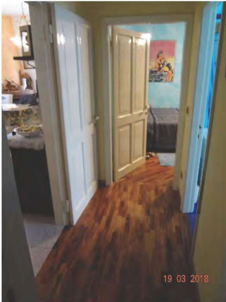
FOTOGRAFIA N. 16

dalla quale si accede ad un disimpegno (vedasi fotografia sottostante )