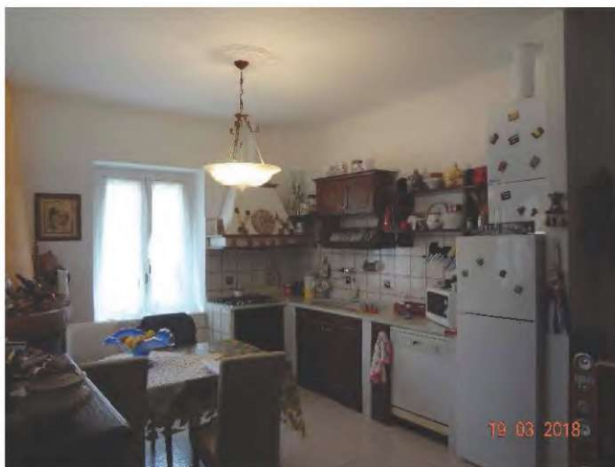
FOTOGRAFIA N. 15

Da qui si accede alla cucina - soggiorno (vedasi fotografia sottostante )