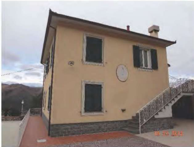
FOTOGRAFIA N. 4

Si tratta di un appartamento di civile abitazione posto al piano terreno del fabbricato in cui ricade anche il civ. 31 (vedasi fotografia sottostante)