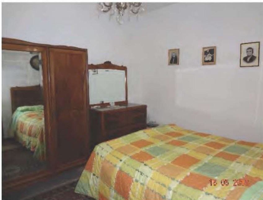
FOTOGRAFIA N. 11

una prima camera da letto dotata di finestra prospiciente il lato sud est (vedasi fotografia sottostante )