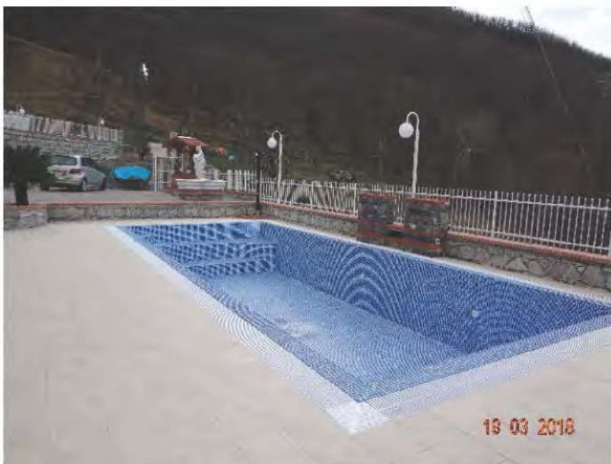
FOTOGRAFIA N. 26

Sull'area insiste una piscina (vedasi fotografia sottostante)