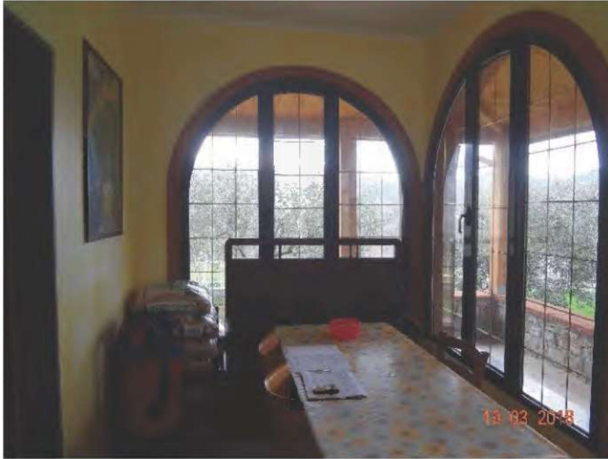
FOTOGRAFIA N. 6

che risulta essere un sottoterrazza verandato (vedasi fotografia sottostante )