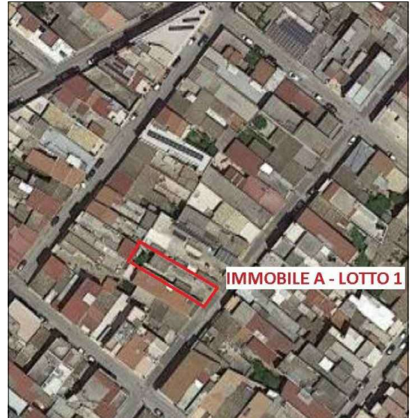
2. Particolare scala 1.100 - individuazione del lotto 1 - immobile A