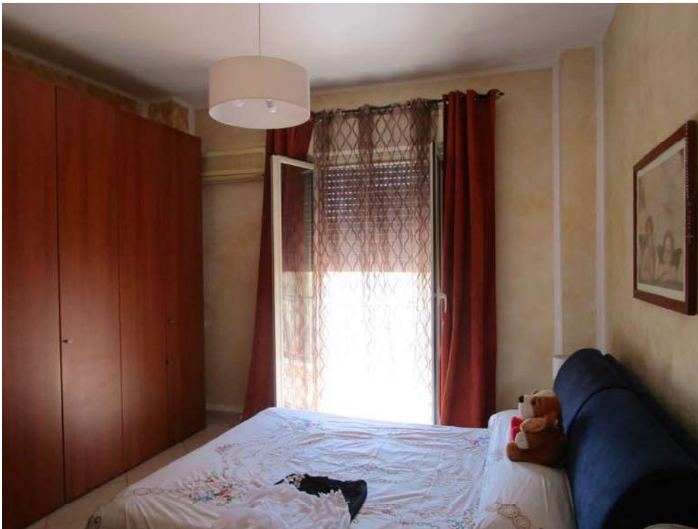
12.CAMERA DA LETTO 1