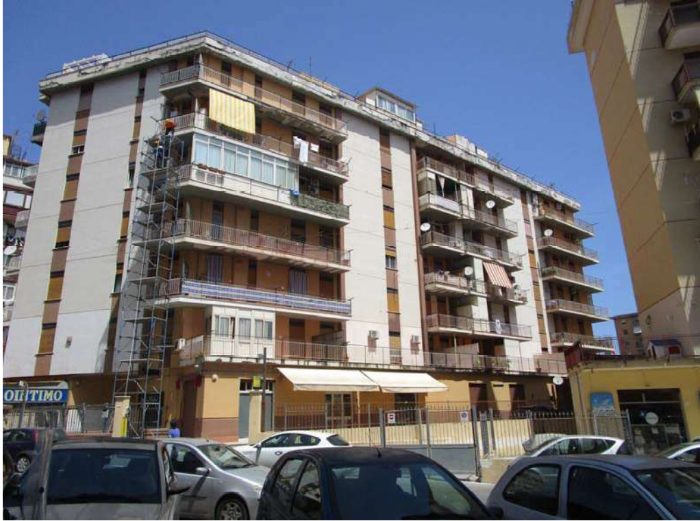
1. PROSPETTO SU VIA SPERONE