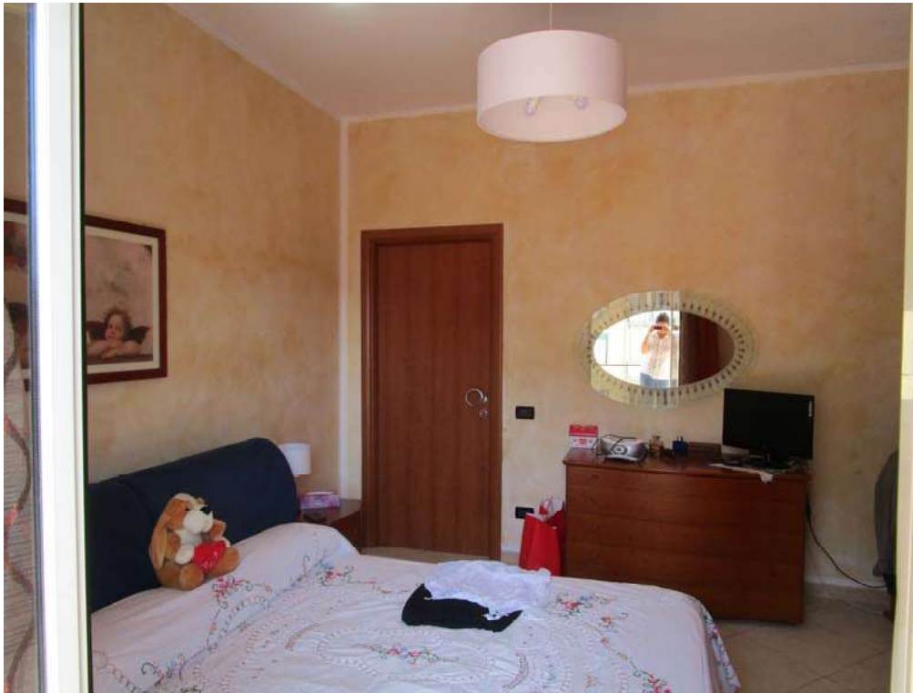
11.CAMERA DA LETTO 1