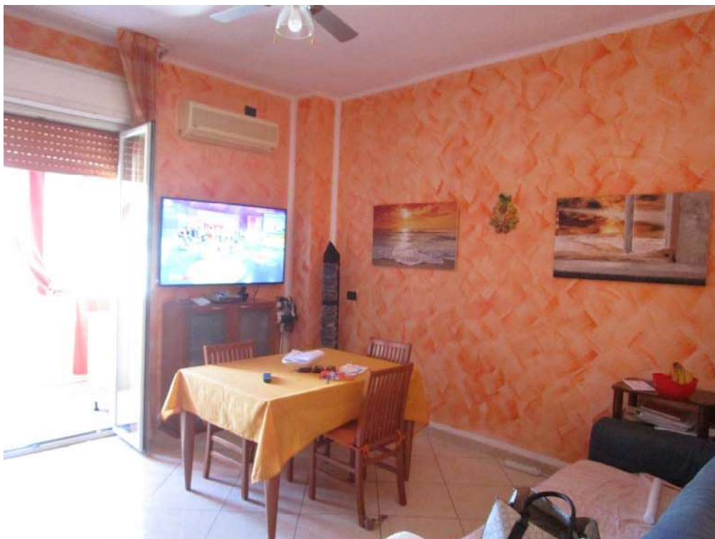
10.SALA DA PRANZO-SOGGIORNO