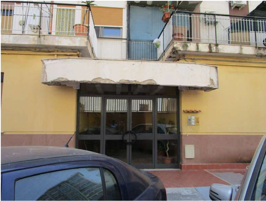
3.INGRESSO SCALA B