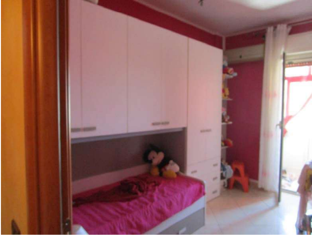
13.CAMERA DA LETTO 2