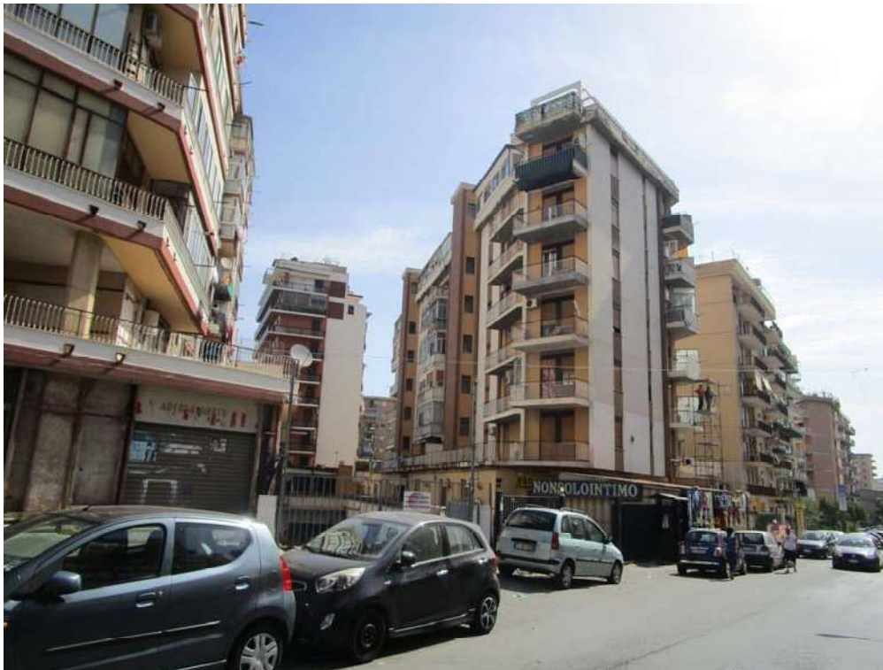
2. PROSPETTO RETRO