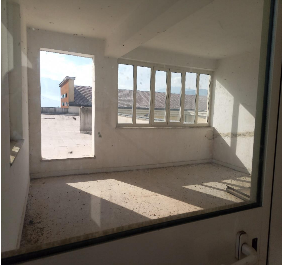
Locale chiuso per accesso terrazzo visibile in fondo