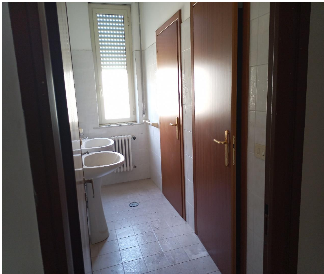
Locali igienici con antibagno