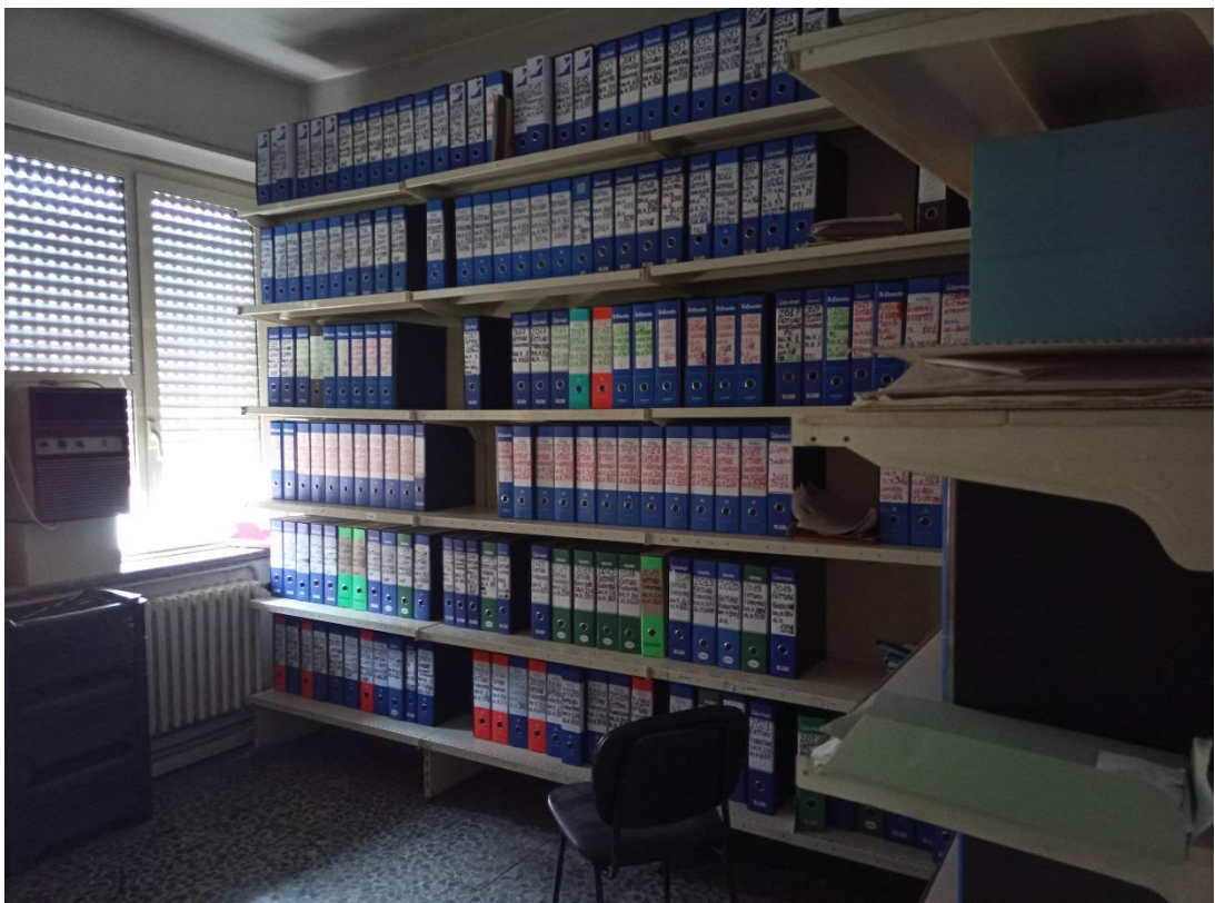
Locale ex ufficio