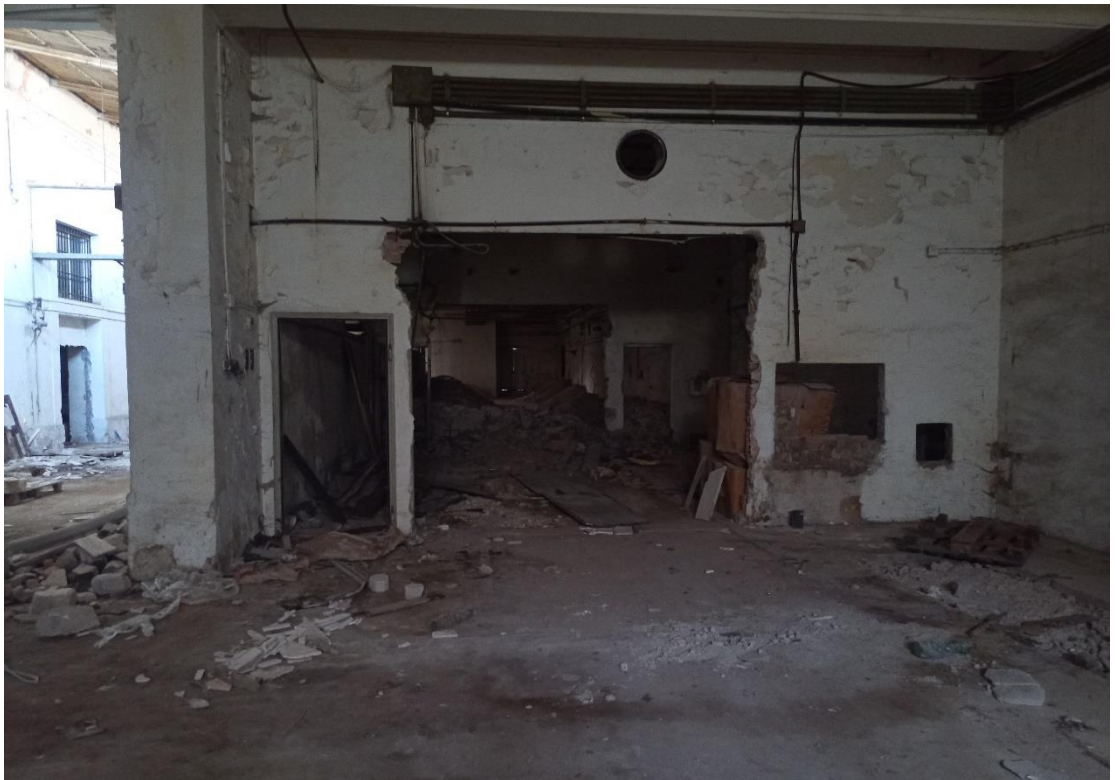
Locale zona lavoro