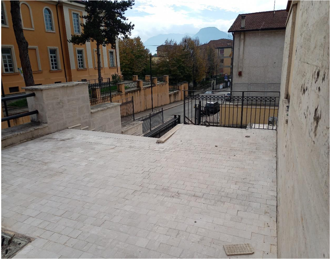
Terrazzino esterno lato sud (La rampa di scala che si intravede a sx, conduce verso altri subalterni che NON interessano la presente Perizia)