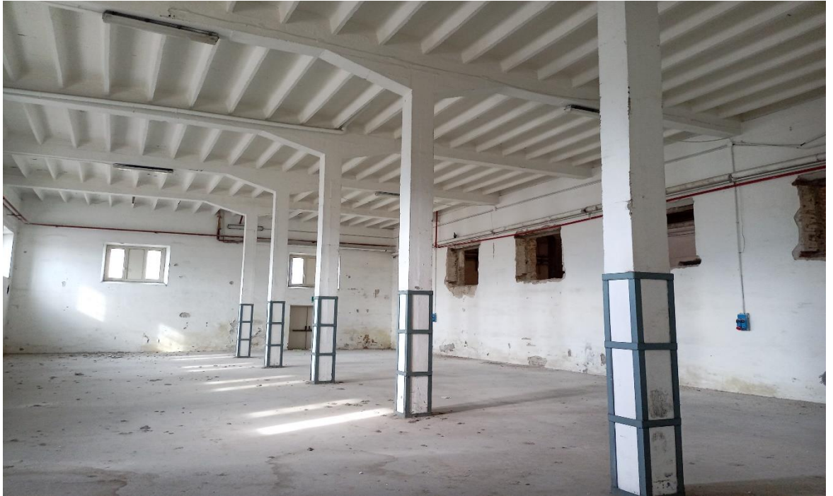
Locale zona lavoro