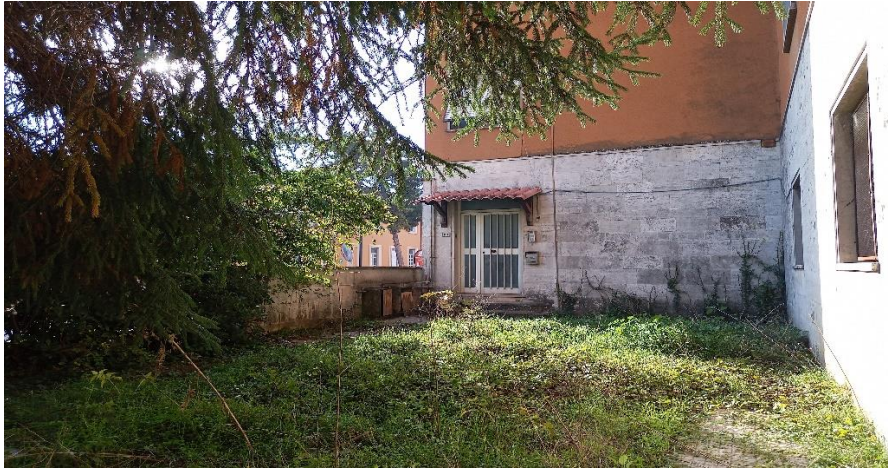
Ingresso esterno civico n. 101