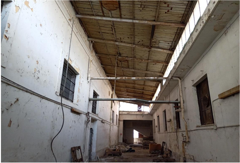
Locale zona lavoro