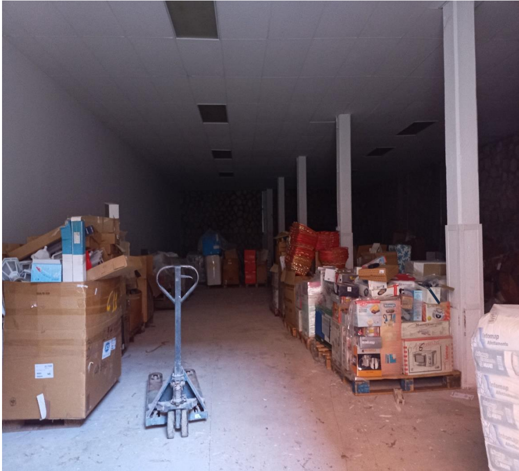
Locale in corso di costruzione