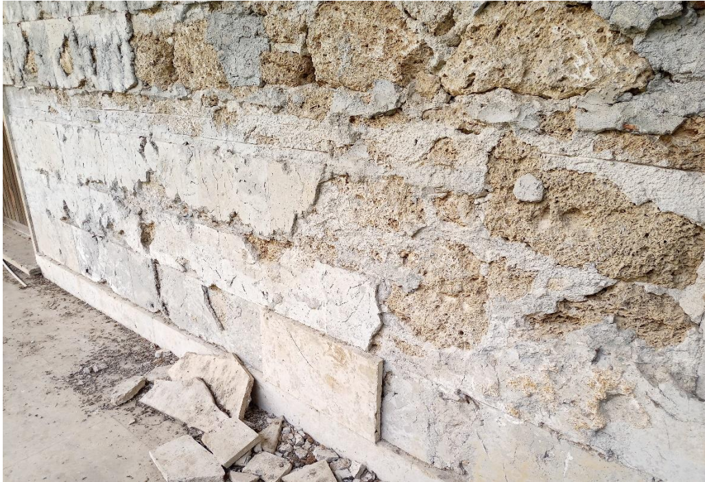
Particolare condizioni muro perimetrale portante