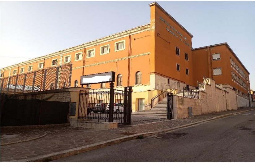
Lati sud ed est su via XIVV Maggio