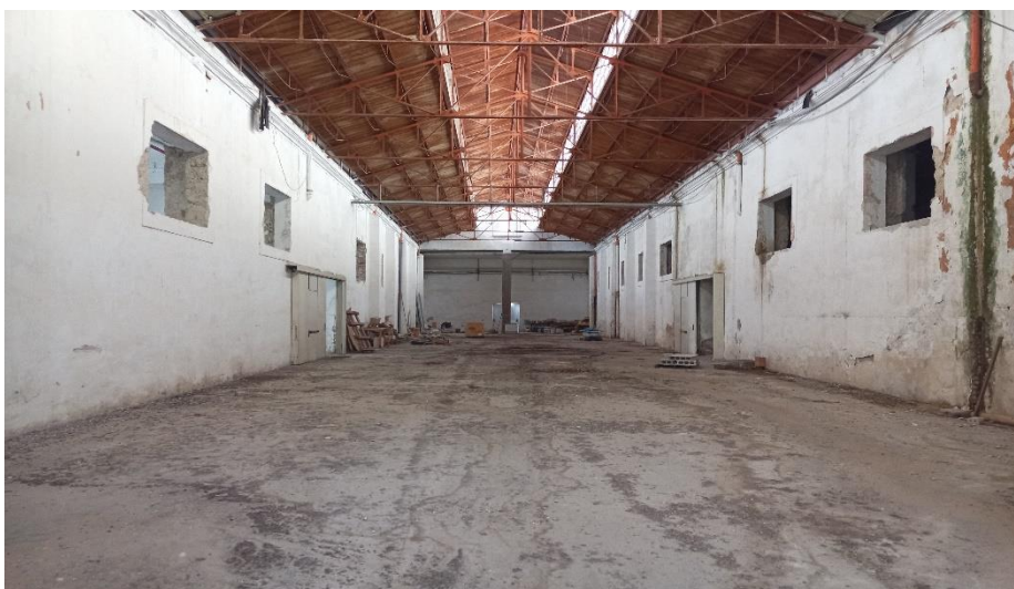
Locale zona lavoro