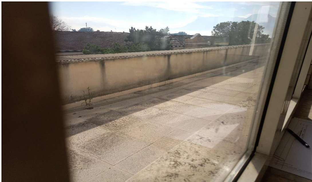
Zona terrazzo che affaccia su via XXIV Maggio