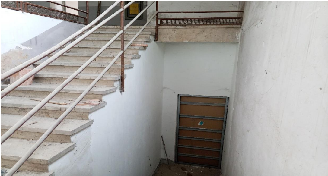
Porta sbarrata tra il sub 6 e i sub 8-9-10 NON interessanti la presente Perizia