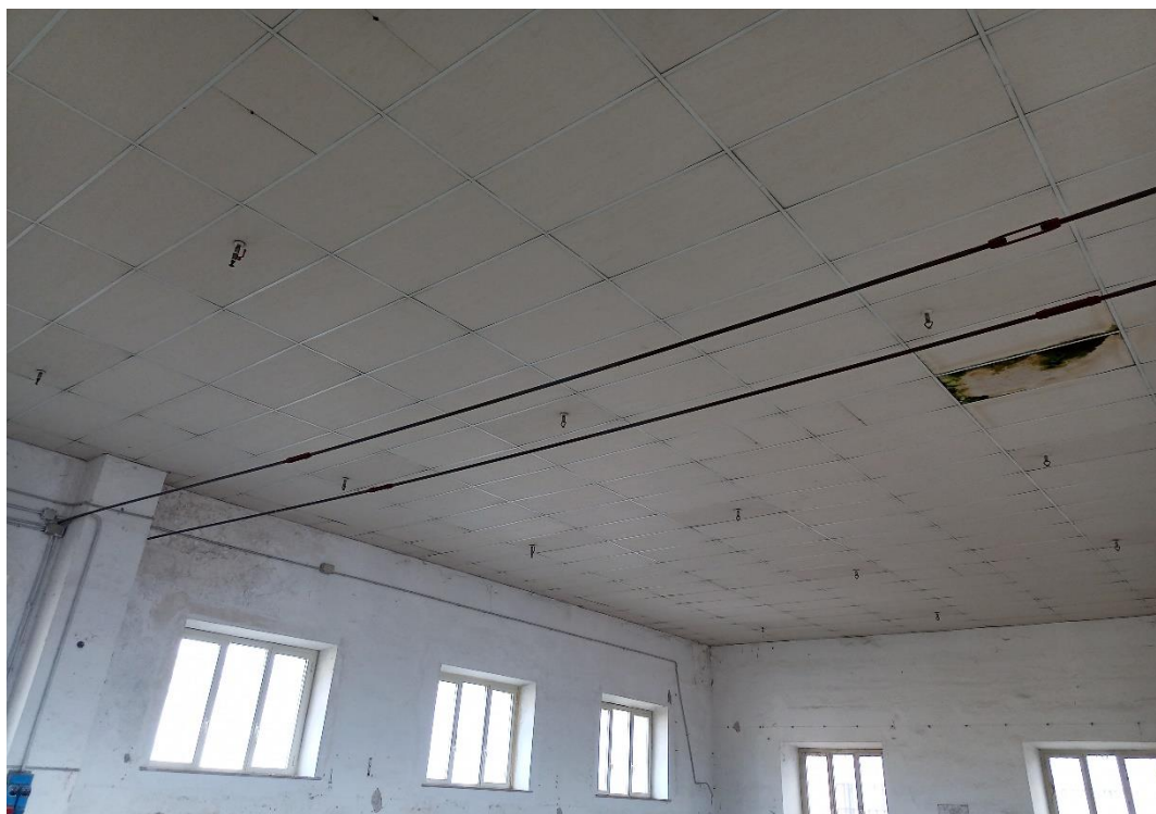
Particolare condizioni d'uso catene tensionali per irrigidimento murature verticali portanti