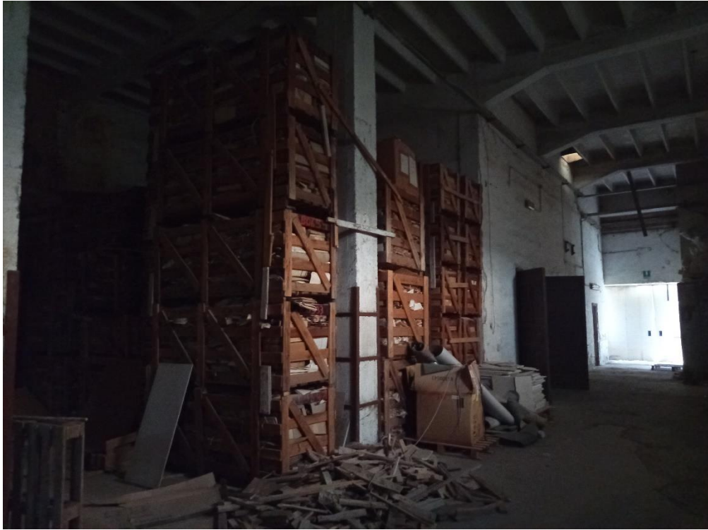
Locale parzialmente occupato da scaffalature porta raccoglitori