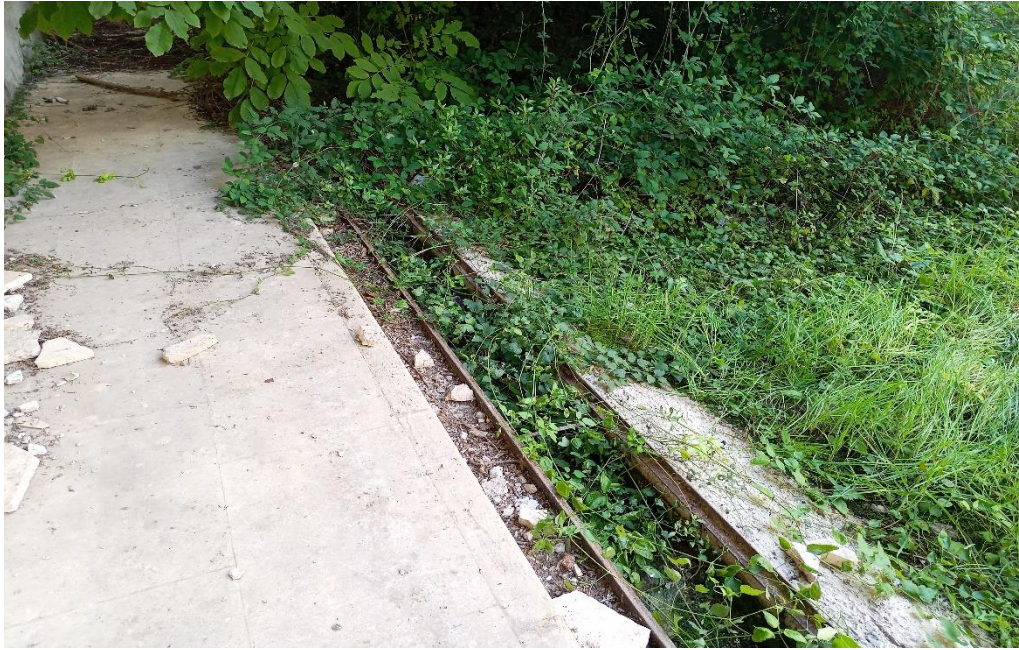
Particolare opera smaltimento acque piovane