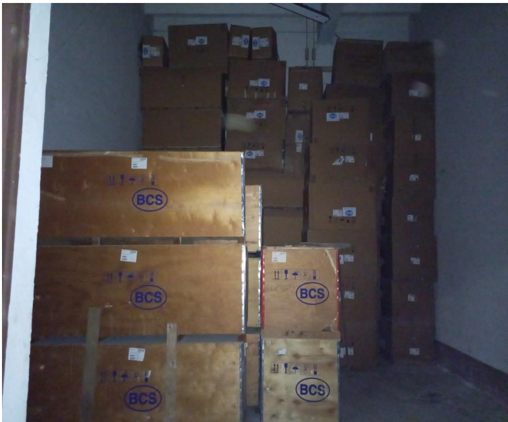
Locale occupato da colli