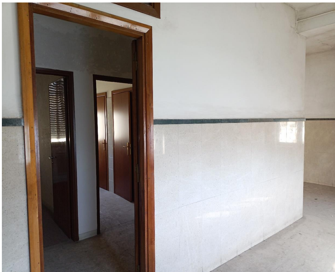
Ingresso locali alloggi (Da notare che l'ingresso al piano è lo stesso che conduce al Subalterno 3 )