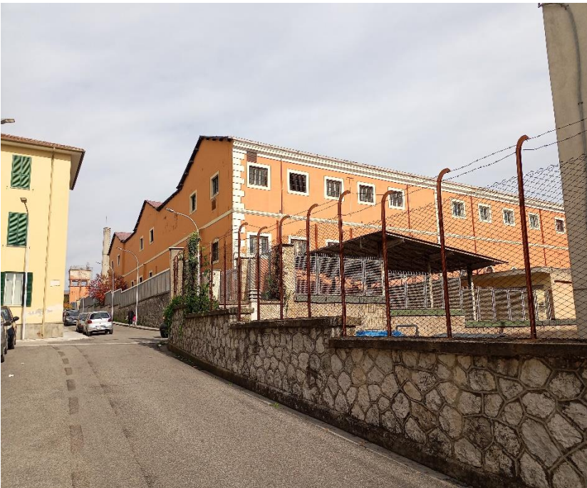
Lato ovest su via Guglielmo Oberdan