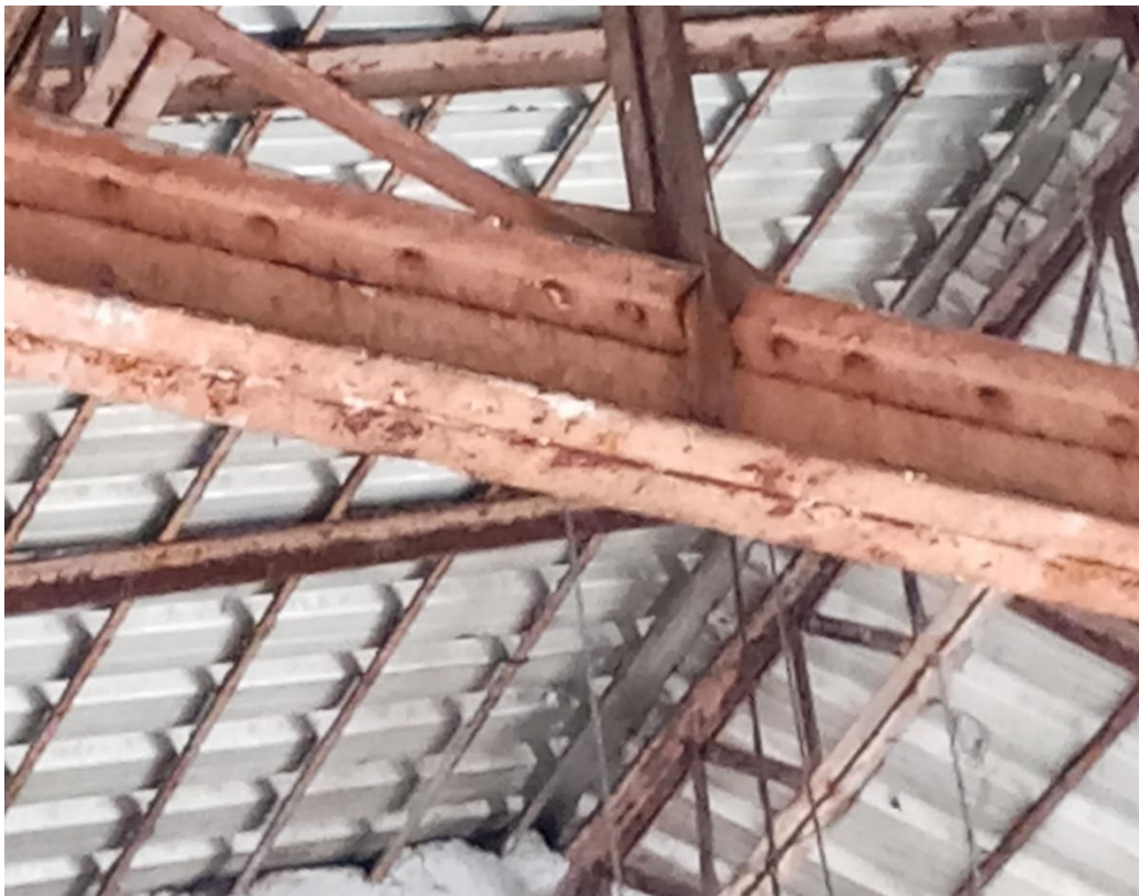
Particolare condizioni d'uso capriata tetto in acciaio