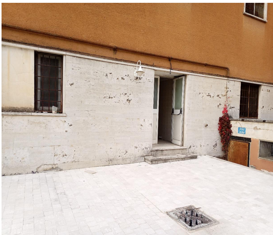
Terrazzino esterno che conduce all'ingresso settore mensa e locali ristorazione (Notare a dx la scalinata che conduce alla centrale termica)