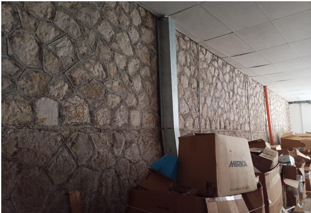
Locale in Corso di costruzione