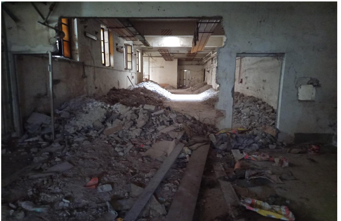
Locale zona lavoro