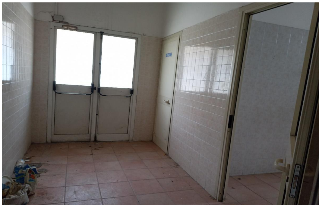
Porta d'accesso da terrazzino esterno lato sud