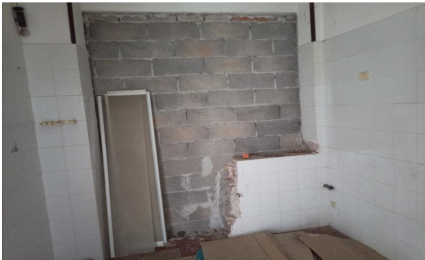
Cucina con finestra murata