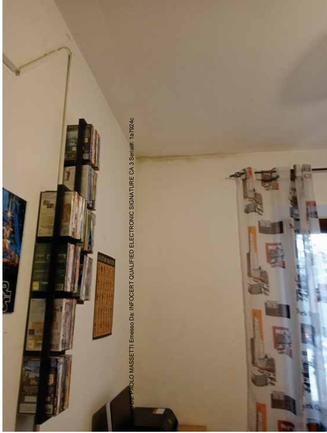
Immagine: Dat: PAOLO MASSETTI Emesso Da: INFOCERT QUALIFIED ELECTRONIC SIGNATURE CA 3 Serial#: 1a7924c