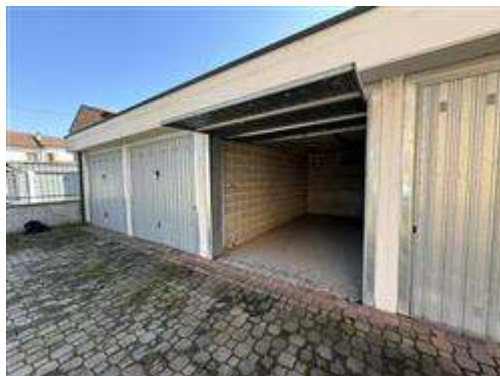
Box singolo (sub. 30)