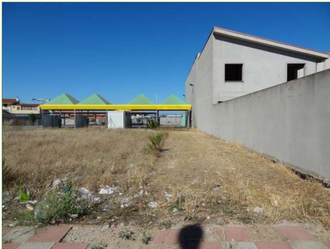
Foto n° 4: Confini dei terreni con altrui proprietà (particella 3244)