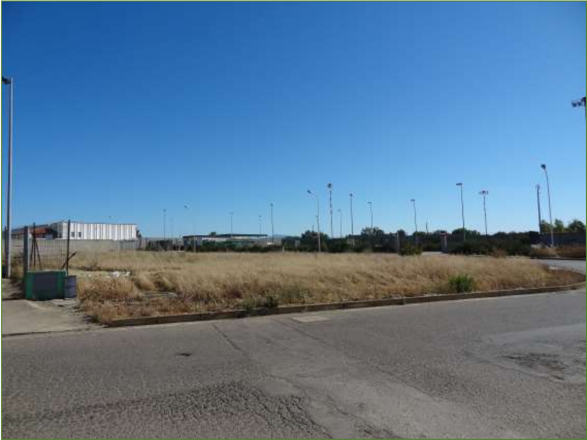
Foto n° 2: Vista dei terreni dalla via Muristeni (particella 3242)