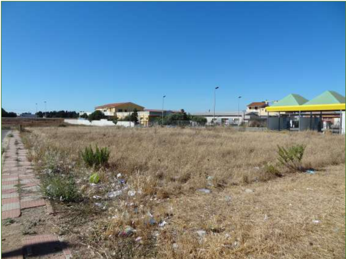
Foto n° 3: Vista dei terreni dalla via Tevere (particelle 3242-3243-3244)