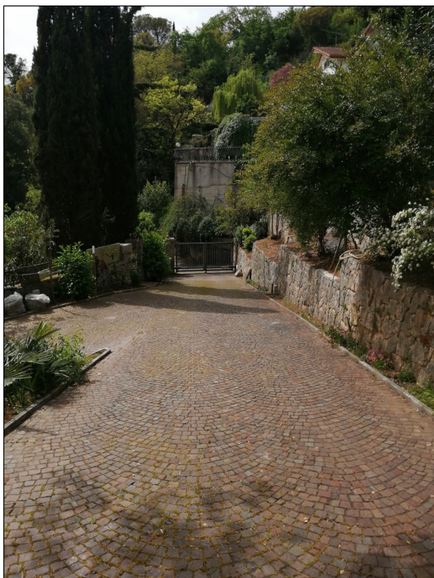
Foto 5: Vista di parte della corte comune con sullo sfondo il cancello d'accesso da via San Mauro.