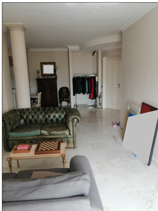
Foto 8: Soggiorno con sullo sfondo la porta d'ingresso all'appartamento