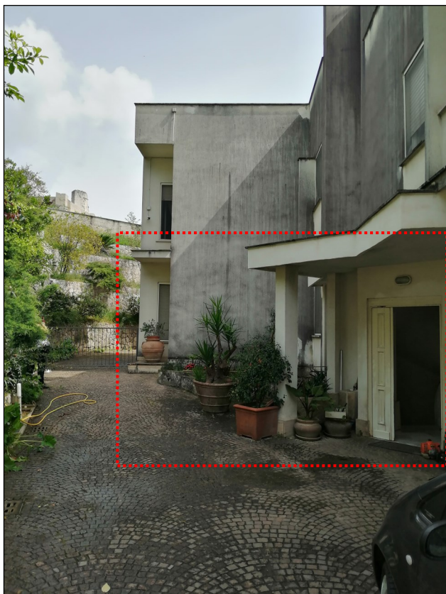
Foto 3: Lato Ovest (sulla destra è visibile il portoncino di Ingresso all'immobile)