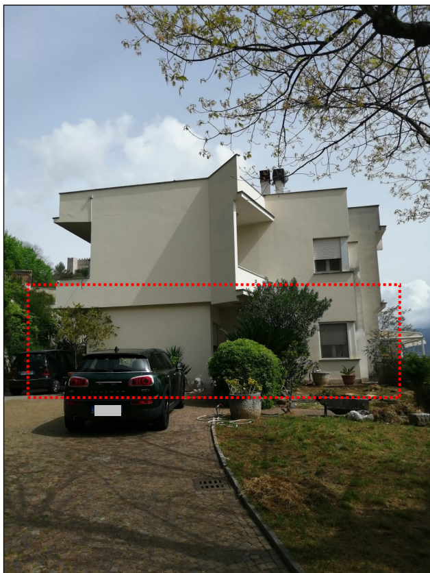
Foto 1: Lato Sud (l'appartamento oggetto della procedura è perimetrato in rosso)