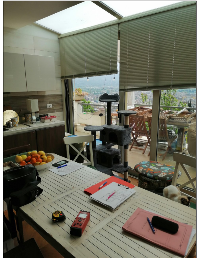
Foto 10: Vista della cucina con la vetrata con affaccio panoramico su Cassino.