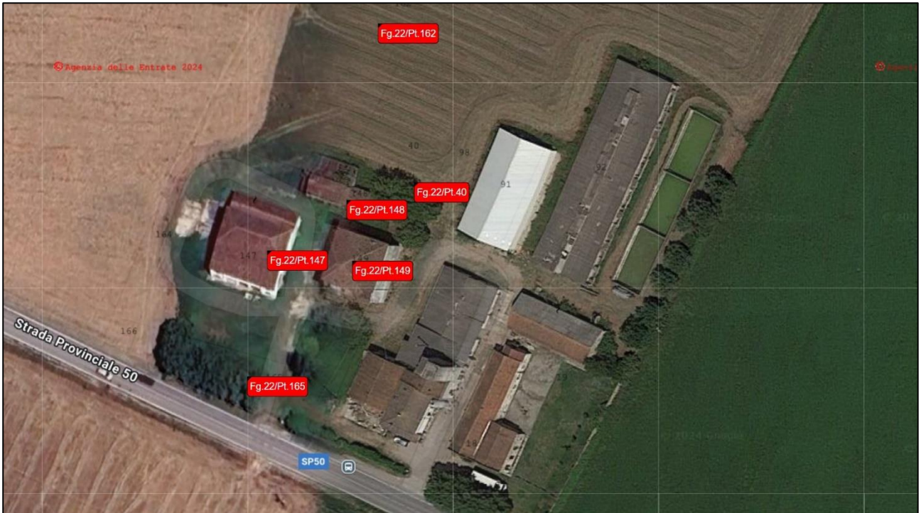
Estratto 1; Immagine satellitare lotto 1;