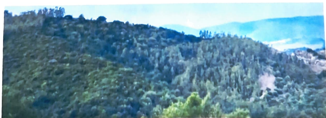
Foto 29 e 30 – Terreno a pascolo arborato, coperto prevalentemente da macchia mediterranea.