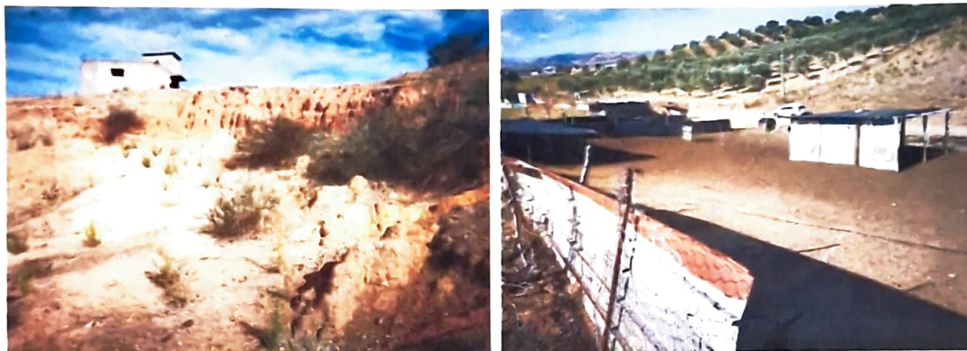
Foto 7 e 8 – Terreno fg. 7 p.lle 335-336-337-338-339-340, prelievo di terra e ricoveri precari per ovini.

Il terreno di forma irregolare, parzialmente declive è attualmente incolto, ed è recintato con paletti di legno e sovrapposta rete metallica e filo spinato. Su di esso sono presenti 15 vecchi ulivi, un fabbricato di mq 53,50 in blocchetti di cemento grezzo in pessime condizioni per il ricovero di ovini ( all. 23b ), numerose arnie per l'apicoltura itinerante, inoltre è attraversato dalla condotta irrigua. Il terreno costituito prevalentemente da arenaria incoerente, in passato è stato oggetto di prelievo ed utilizzato come sottofondo stradale. La striscia di terreno costituita dalle p.lle 336 e 339 poste a ridosso della stradina sterrata denominata Via dei Gigli, è occupata abusivamente da alcuni ricoveri precari per ovini, da terzi sconosciuti a detta dell'esecutato ( foto 1-2-7-8 ).