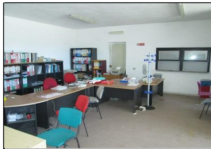
Foto n°40 -