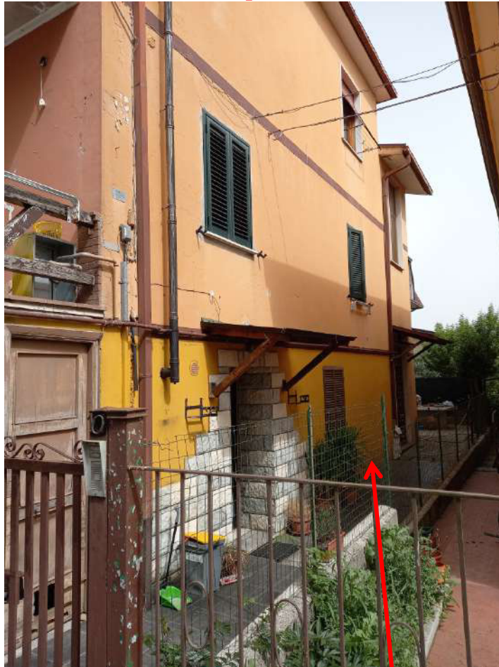
Posizione appartamento Lotto n. 1