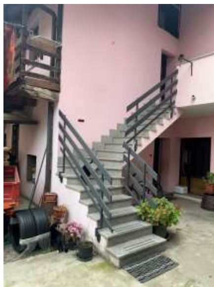
Vista scala esterna