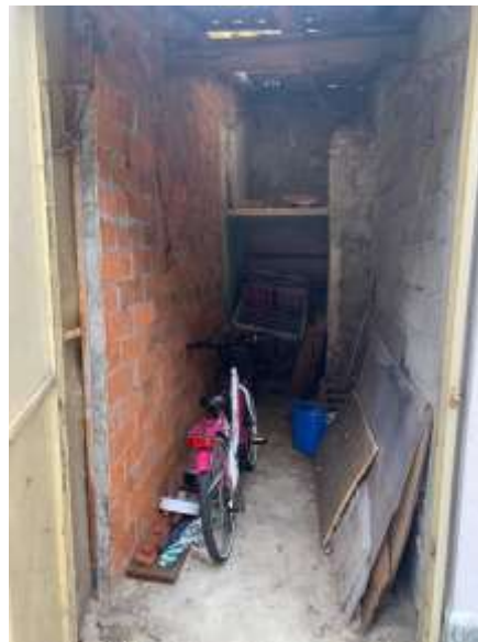
Vista locale deposito