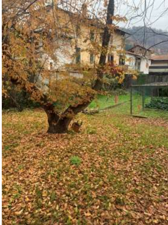
Vista generale terreno