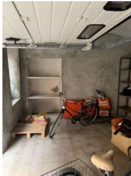
Vista interna garage