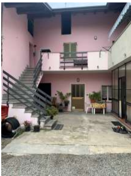
Vista corte pertinenziale