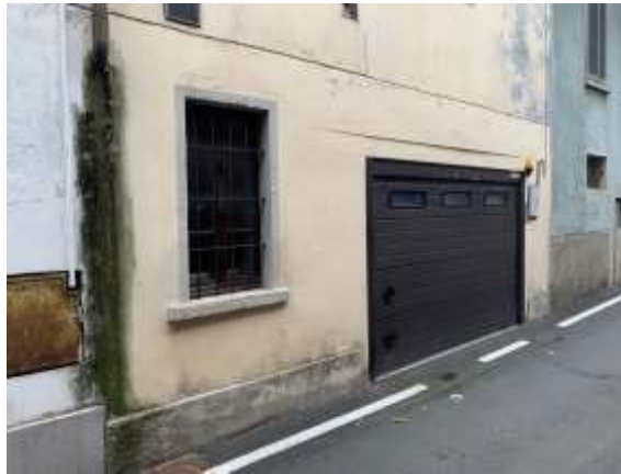
Vista generale garage