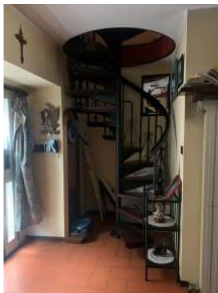
Vista scala interna