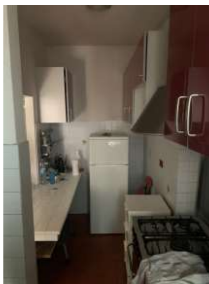
Vista angolo cottura