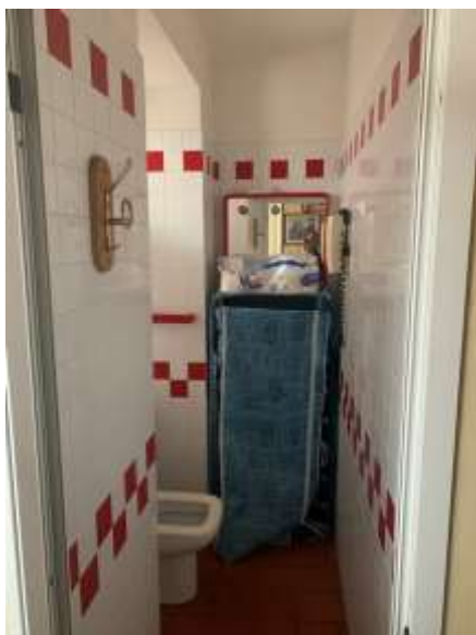
Vista servizio pt