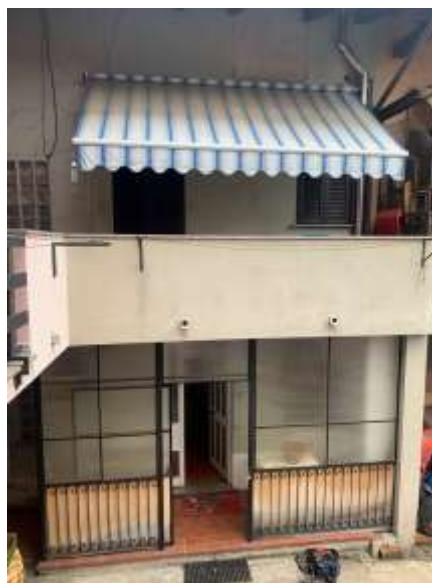
Vista generale immobile