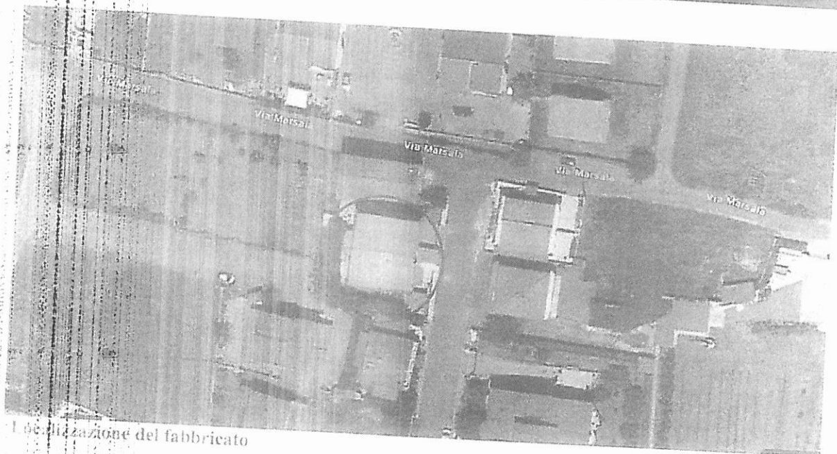
Localizzazione del fabbricato