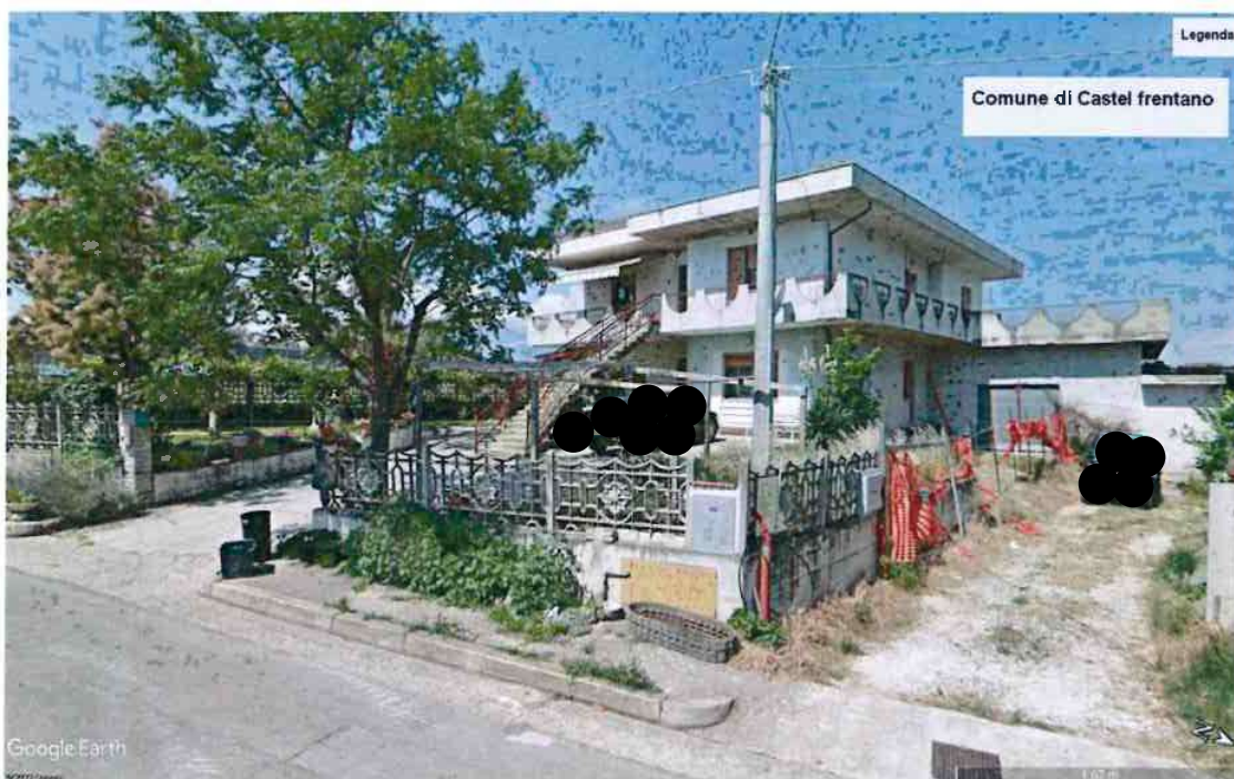
Foto n. 1 = Esterno fabbricato (la uiu in oggetto è quella sita al piano primo e sottotetto)