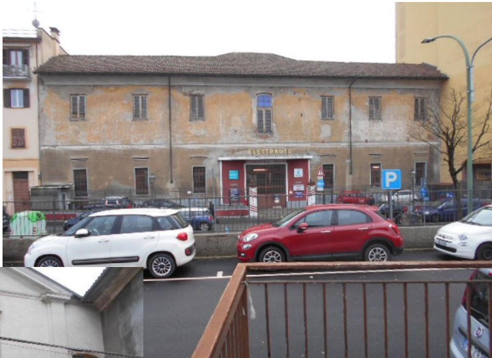
il fronte nord su c.so Marengo