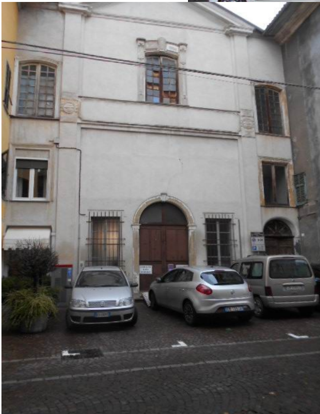
la testata sud e l'ingresso su via Cavour