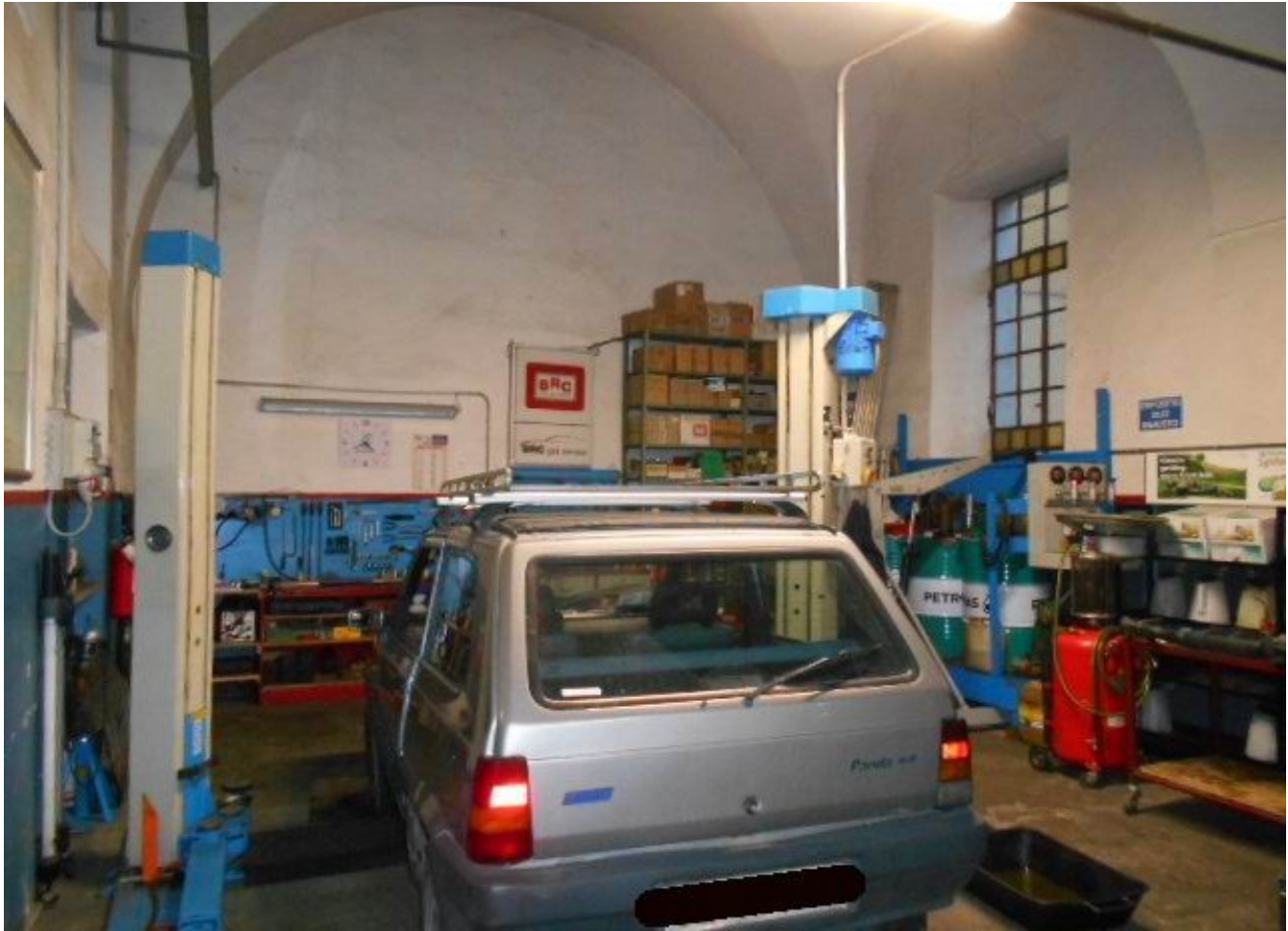
la campata terminale lato ovest che costituisce il fg.32 n.1024 sub.33 e il corrispondente spazio esterno graffiato fg.32 n.147 sub.4