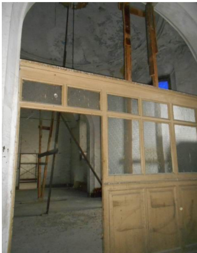
e gli ambienti al piano nobile (fg.32 n.1024 sub.21)