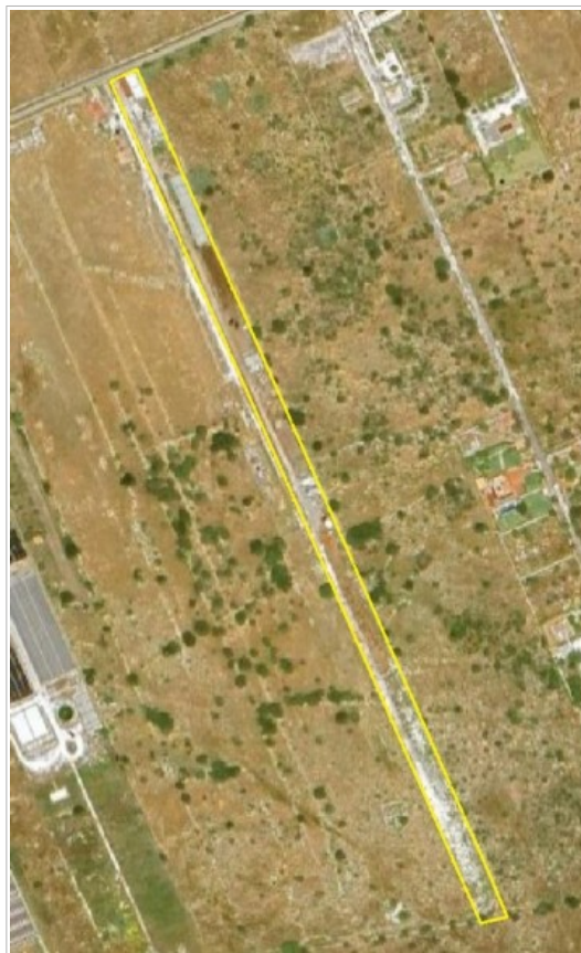
Foto aerea Google Earth 2023.