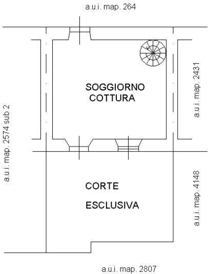
PIANO TERRA H 3.05