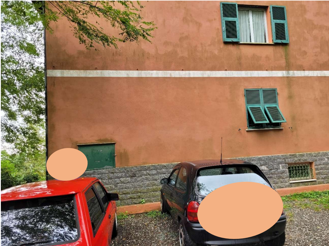
FOTOGRAMMA n.° 2 di 32: prospetto nord con vettura posteggiata sul sub. 12