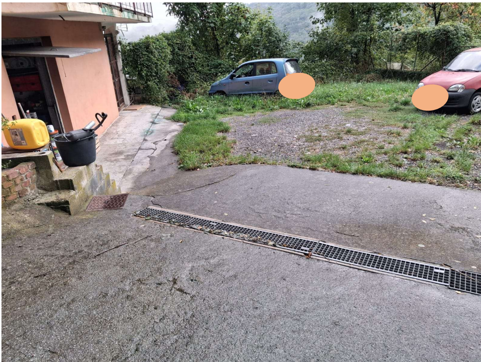
FOTOGRAMMA n.° 8 di 32: prospetto est – rampa sub. 8 ed ingresso al box sub. 6