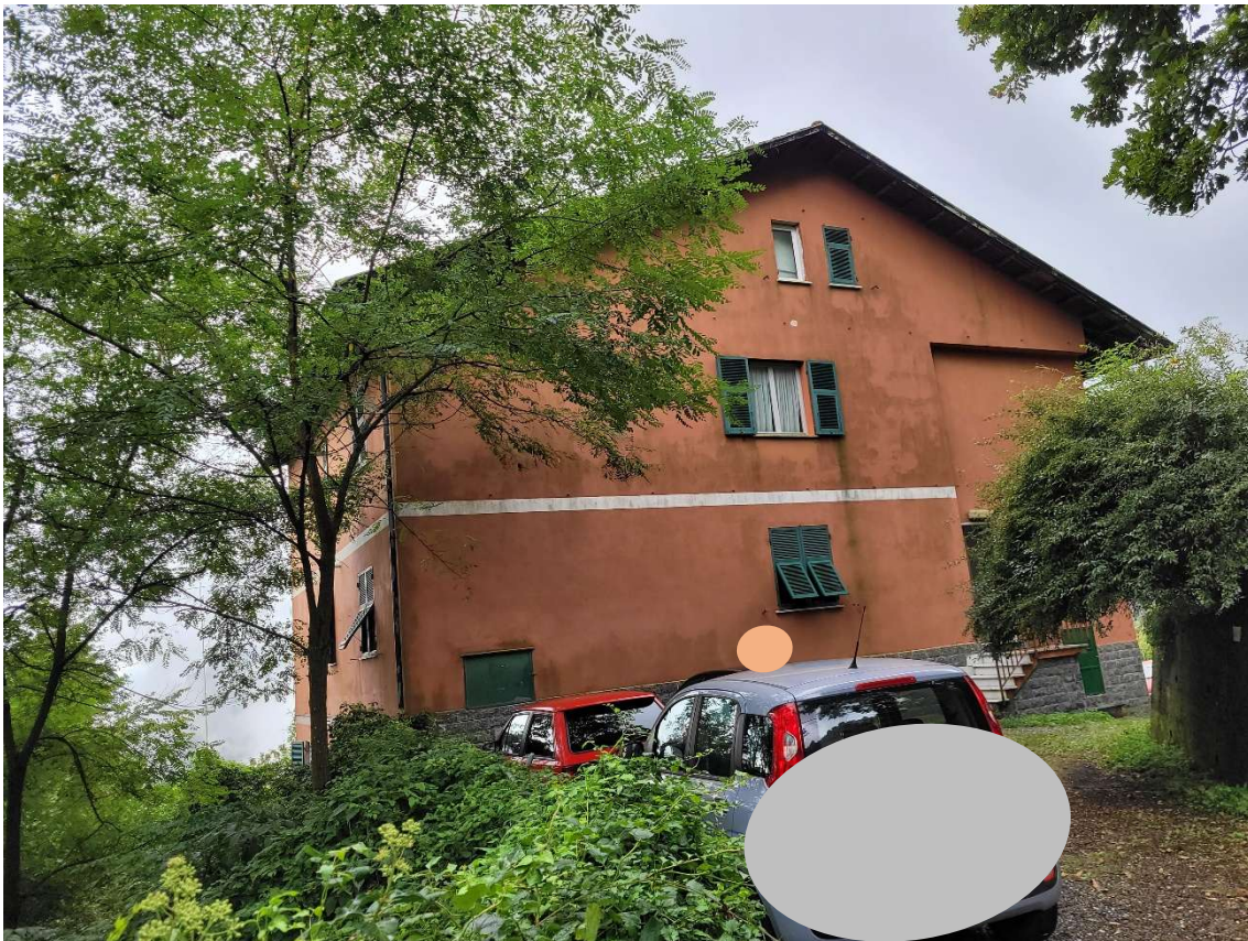
FOTOGRAMMA n.° 3 di 32: prospetto nord con vettura posteggiata sul sub. 8 (fotogramma scattato dal sub. 7)