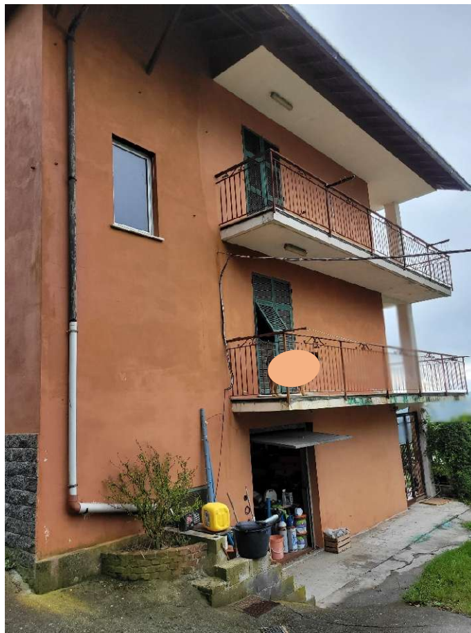
FOTOGRAMMA n.° 5 di 32: prospetto est – ingresso al box sub. 6