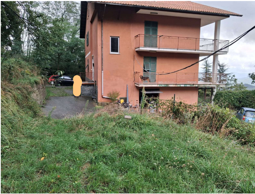
FOTOGRAMMA n.° 7 di 32: prospetto est – fotogramma scattato dal mappale 351