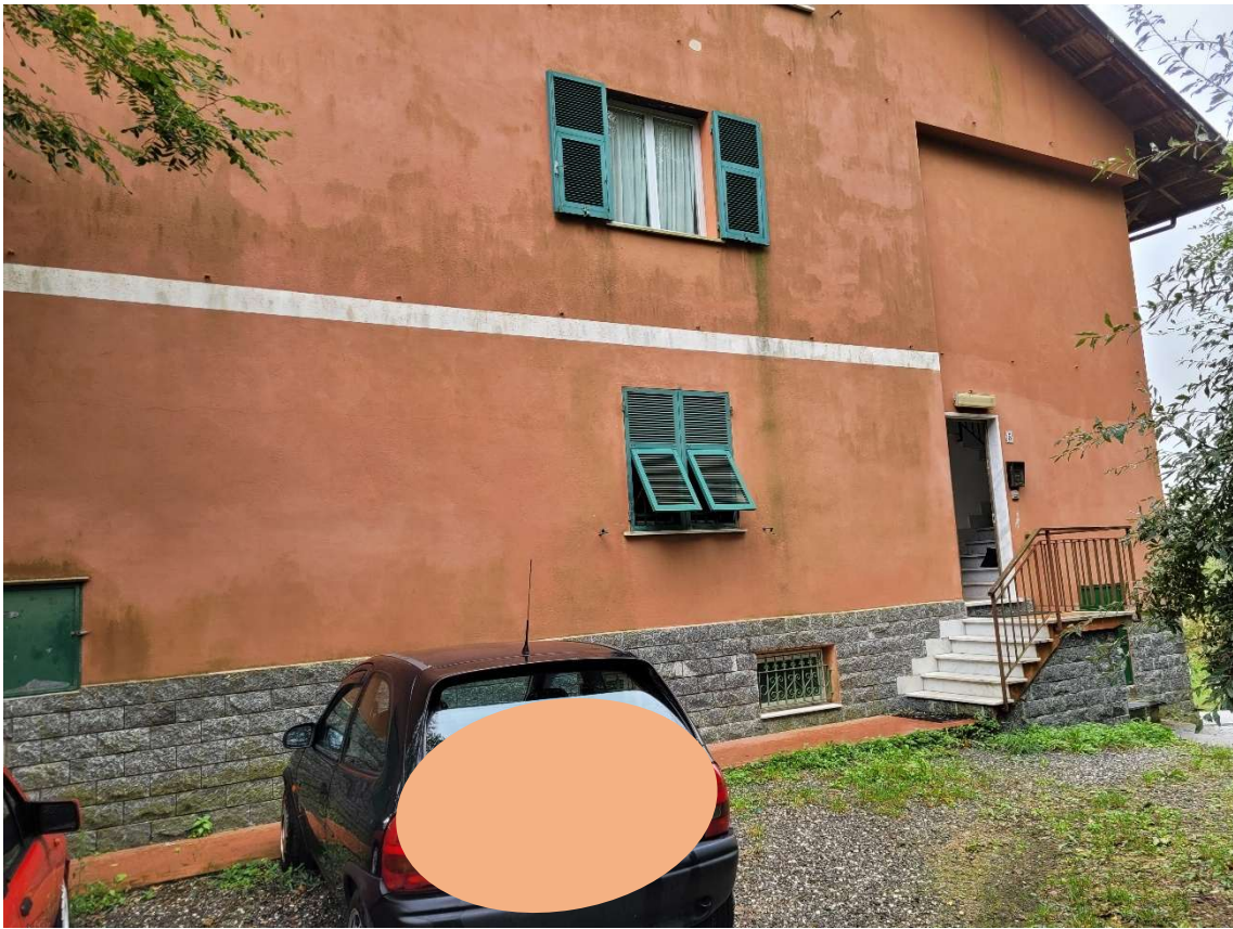
FOTOGRAMMA n.° 1 di 32: prospetto nord con vettura posteggiata sul sub. 12