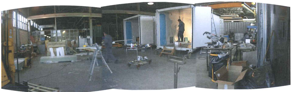
Foto 39 – Visione della porzione di laboratorio in affitto alla Emergency