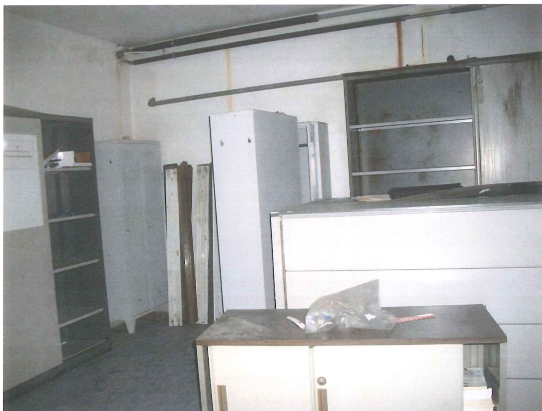
Foto 30 – Archivio (all'interno dei locali spogliatoio – piano terra)