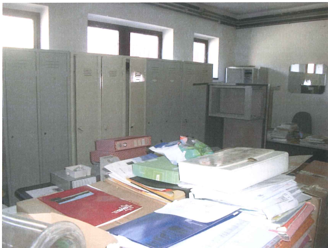
Foto 29 – Archivio (all'interno dei locali spogliatoio – piano terra)