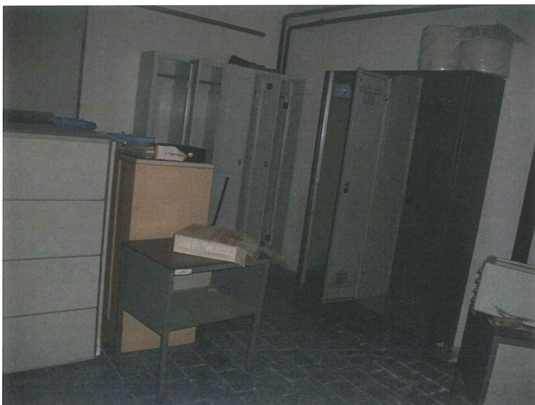
Foto 31 – magazzino (all'interno dei locali spogliatoio – piano terra)