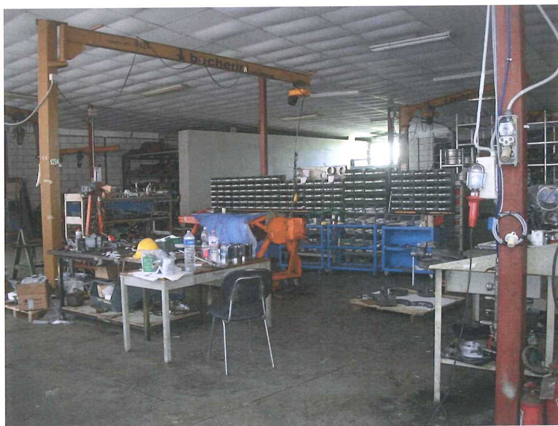
Foto 43 – Visione della porzione edificio sul retro in affitto alla Emergency