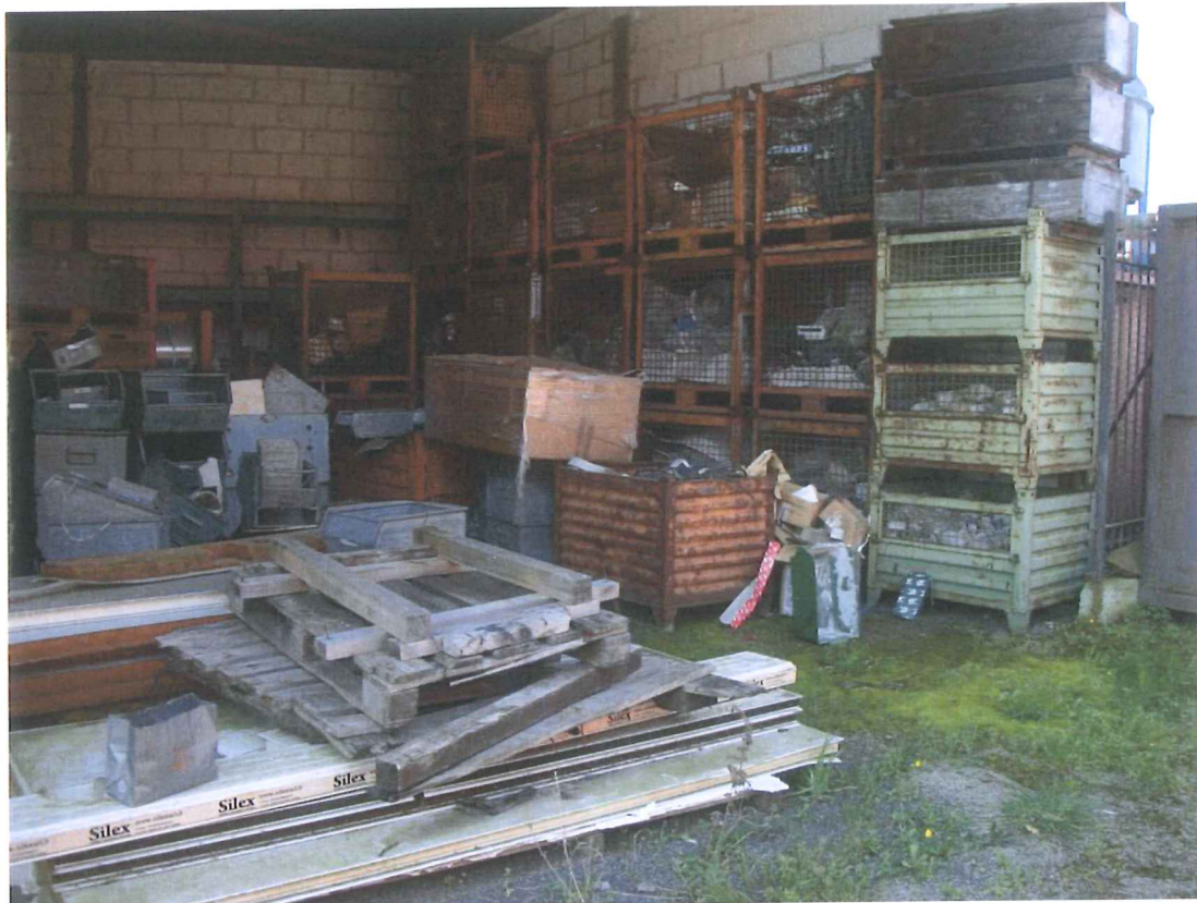
Foto 40 – Visione della porzione edificio sul retro in affitto alla Emergency