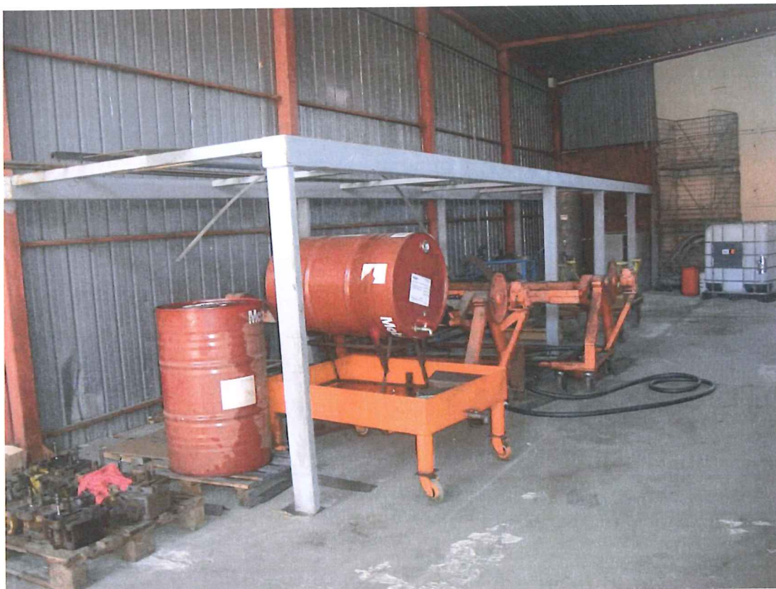
Foto 41 – Visione della porzione edificio sul retro in affitto alla Emergency