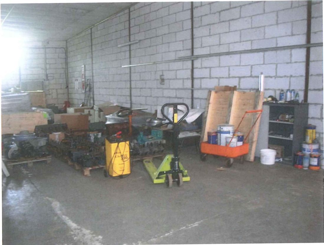
Foto 44 – Visione della porzione edificio sul retro in affitto alla Emergency