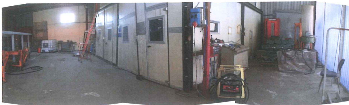
Foto 42 – Visione della porzione edificio sul retro in affitto alla Emergency