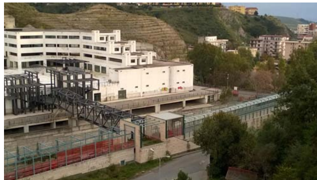
Foto 4 - Portale metallico d'ingresso e ponte pedonale sul Musofalo