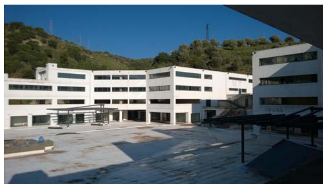
Foto 8 - Piazza