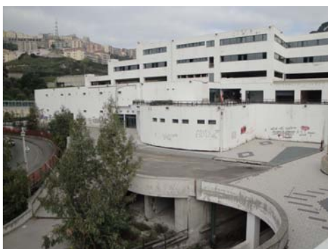
Foto 19 - Prospetto viale Brutium