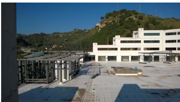
Foto 7 - Accesso alla piazza da portale metallico