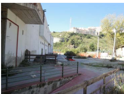
Foto 17 - Uscite dai piani S2,S1 - lato Funicolare