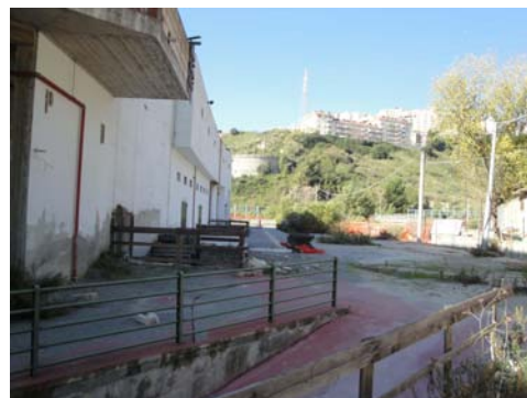
Foto 14 - Uscite dai piani S2,S1 - lato Funicolare