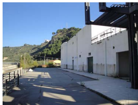
Foto 12 - Prospetto lato Musofalo