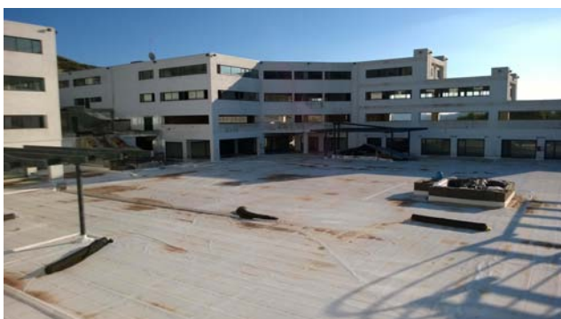
Foto 9 - Piazza