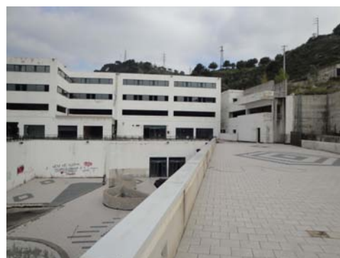
Foto 20 - Terrazzo piano primo