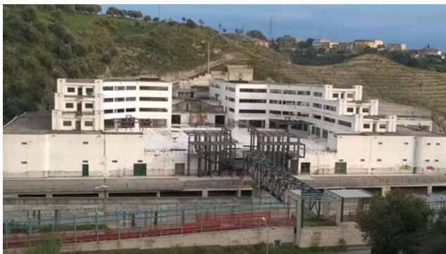
Foto 1 - Prospetto lato Musofalo