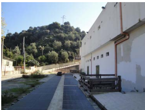
Foto 13 - Prospetto lato Funicolare