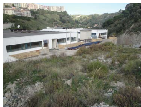
Foto 16 - Prospetto lato monte