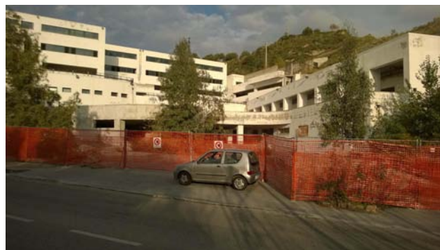
Foto 6 - Prospetto lato viale Brutium