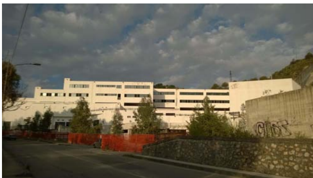
Foto 5 - Prospetto lato viale Brutium