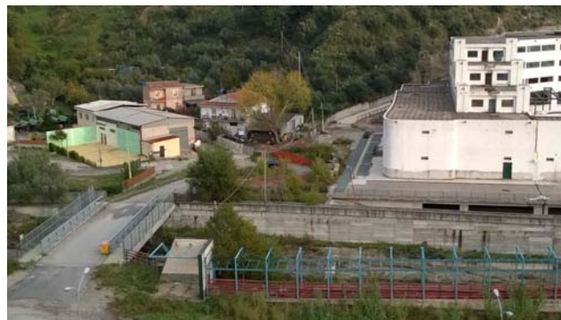
Foto 2 - Ponte Carrabile