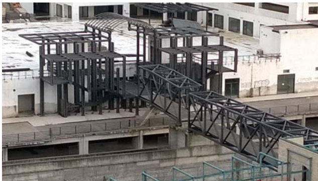
Foto 3 - Portale metallico d'ingresso e ponte pedonale sul Musofalo