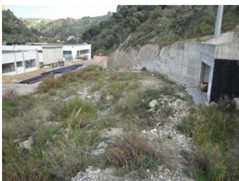
Foto 15 - Area da destinare a parcheggi e zona di manovra