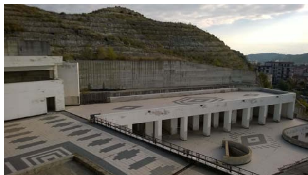
Foto 10 - Terrazzo piano primo - Prospetto viale Brutium