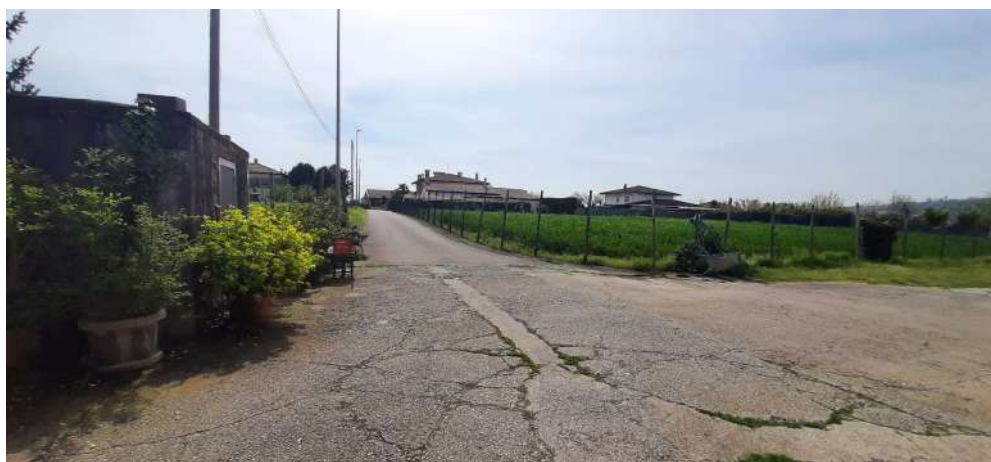
Figura 5 accesso al LOTTO 001 da via Croce di Pietra