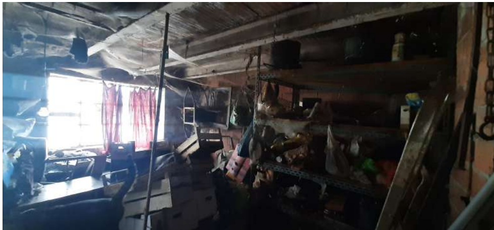
Figura 13 locale cantina