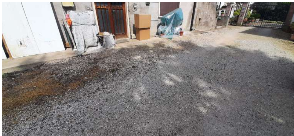
Figura 19 area di corte comune P.Illa106