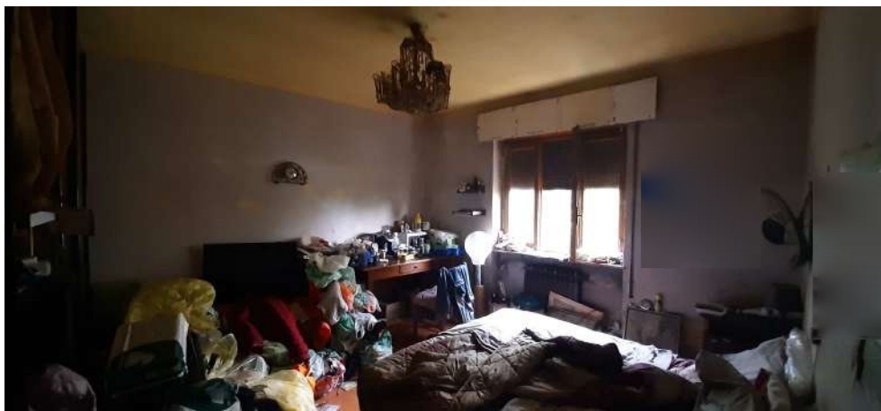
Figura 9 locale camera OVEST