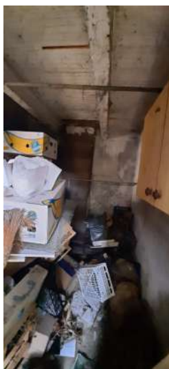
Figura 14 locale C.T.