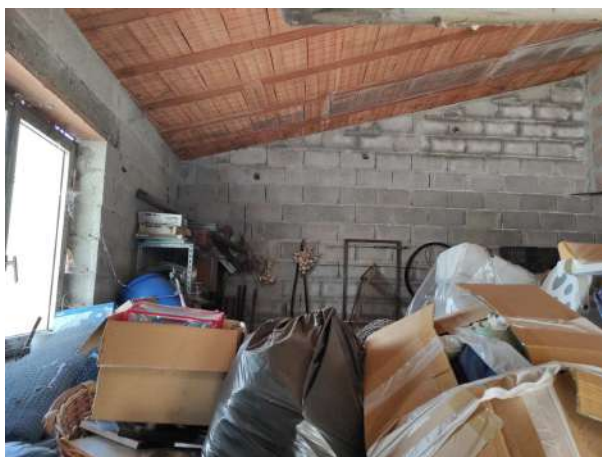
Figura 18 locale magazzino