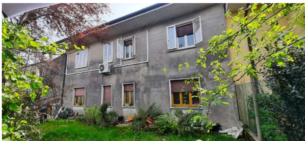
Figura 2 prospetto NORD abitazione al piano terra