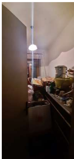
Figura 11 locale ripostiglio