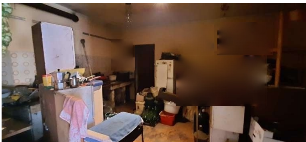
Figura 8 locale cucina