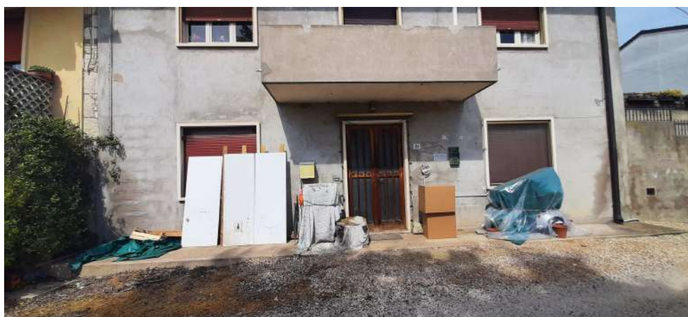
Figura 1 prospetto SUD abitazione al piano terra