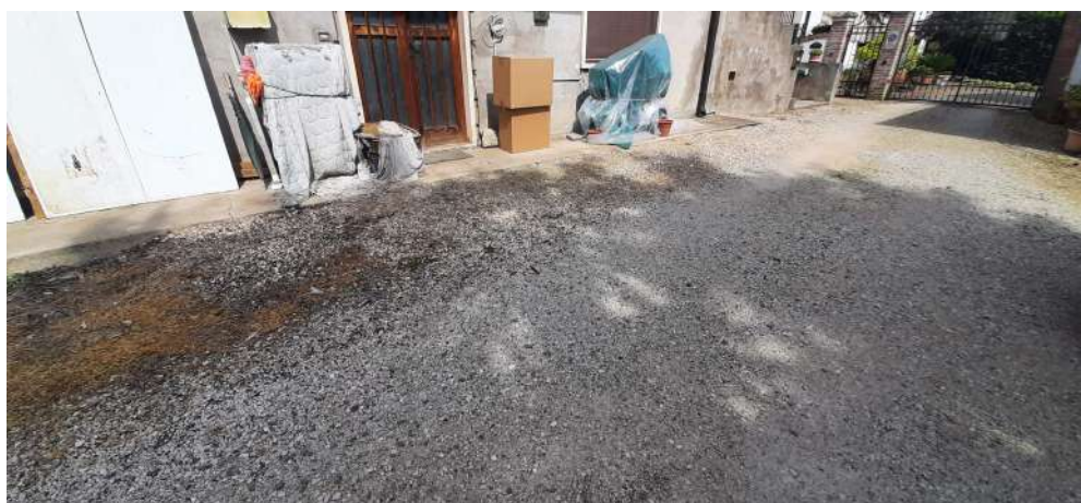
Figura 4 area di corte comune P.Illa106