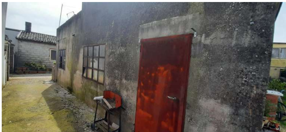
Figura 3 prospetto EST abitazione al piano terra