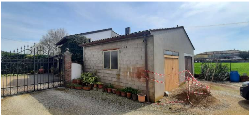
Figura 16 prospetto NORD-OVEST