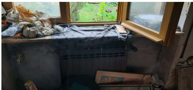
Figura 15 dettagli finiture