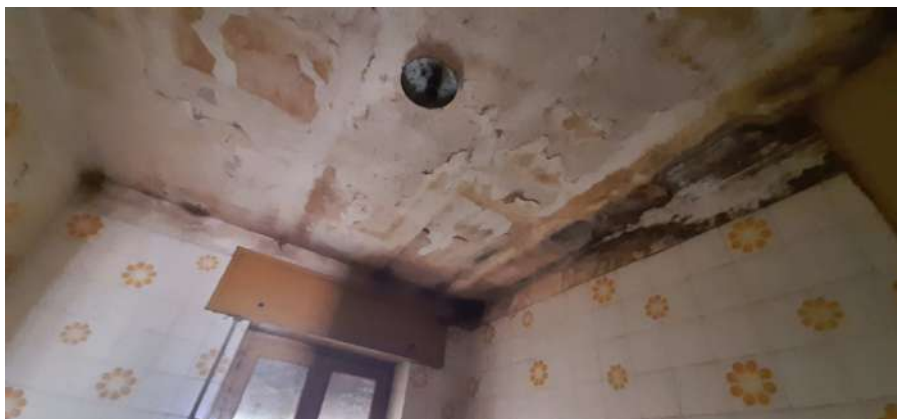
Figura 10 locale bagno