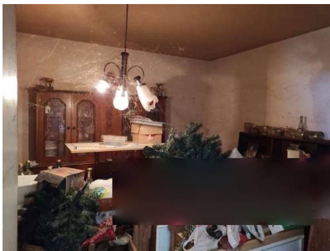
Figura 7 locale soggiorno