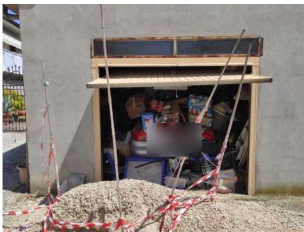
Figura 17 accesso al sub.2