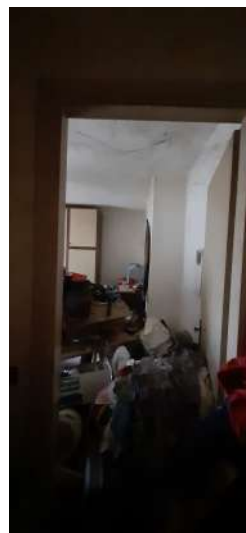
Figura 12 locale camera EST