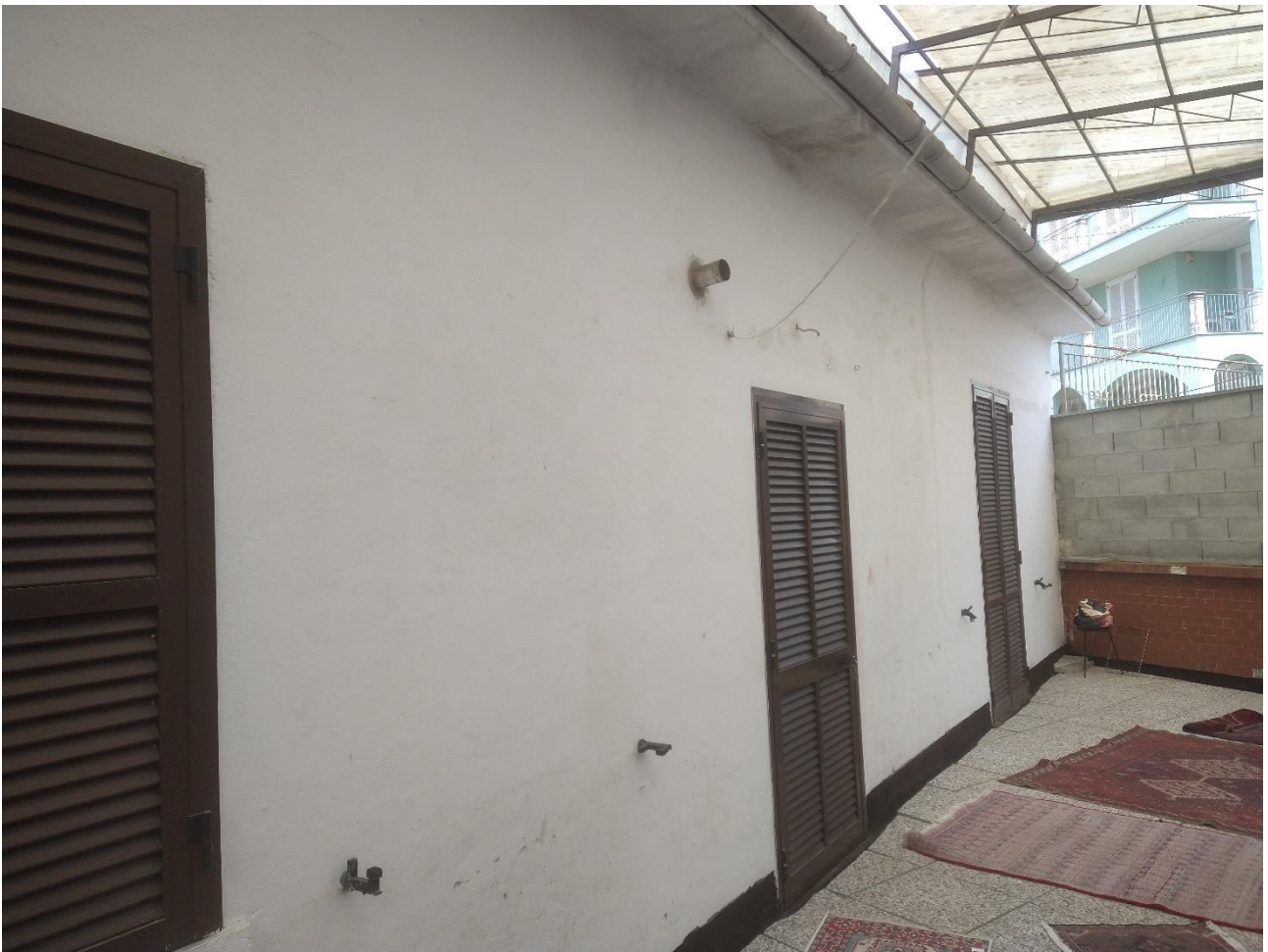
FACCIATA DA TERRAZZO