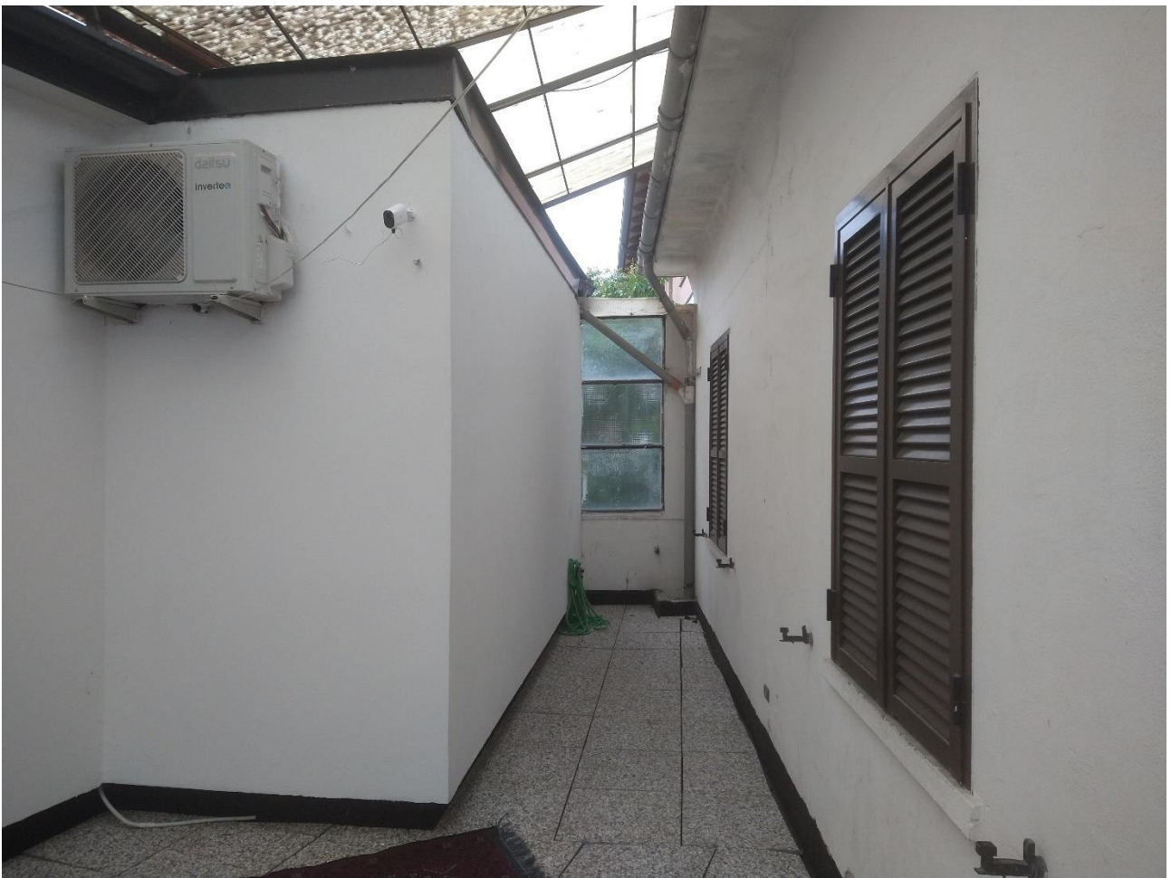
DELIMITAZIONE TERRAZZO LATO EST