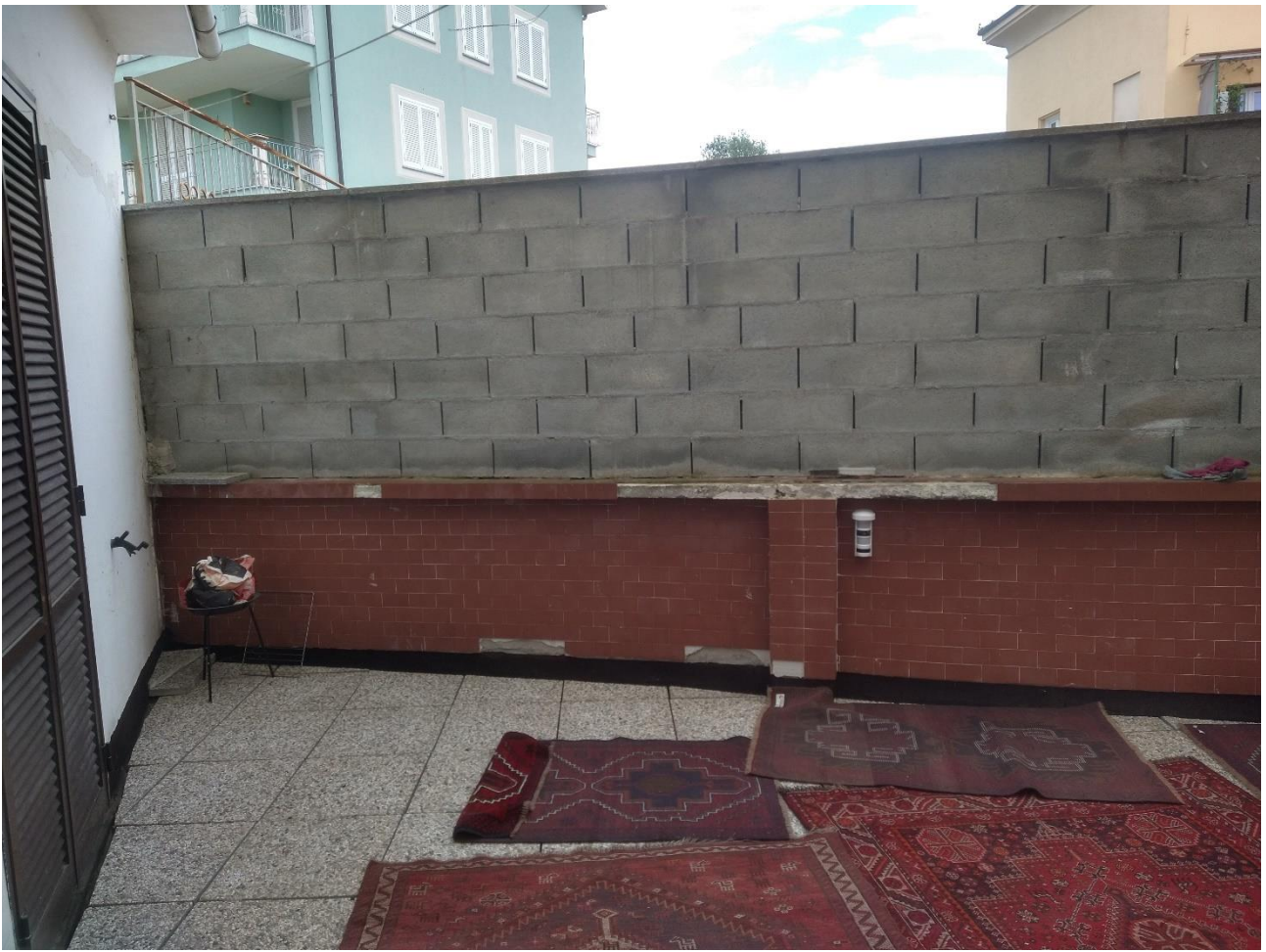
DELIMITAZIONE TERRAZZO LATO EST