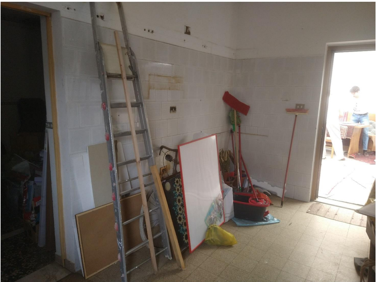
LOCALE INGRESSO – CUNINA – ALTRA VISTA