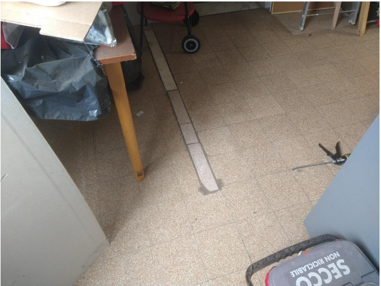
LOCALE INGRESSO-CUCINA – RAPPEZZO PAVIMENTO OVE E' STATO DEMOLITO IL TRAMEZZO