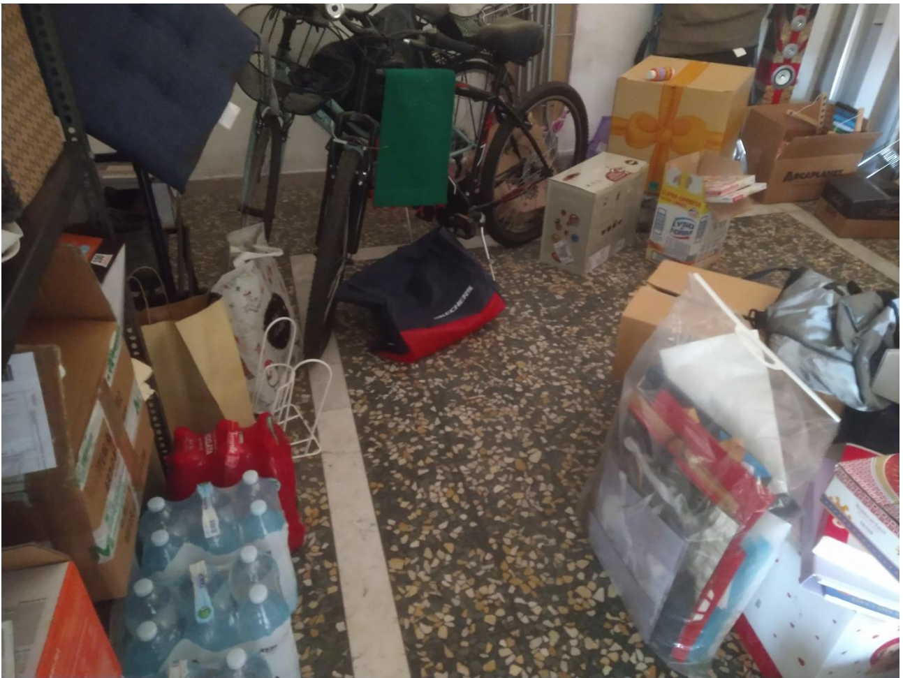
LOCALE SALA – ALTRA VISTA