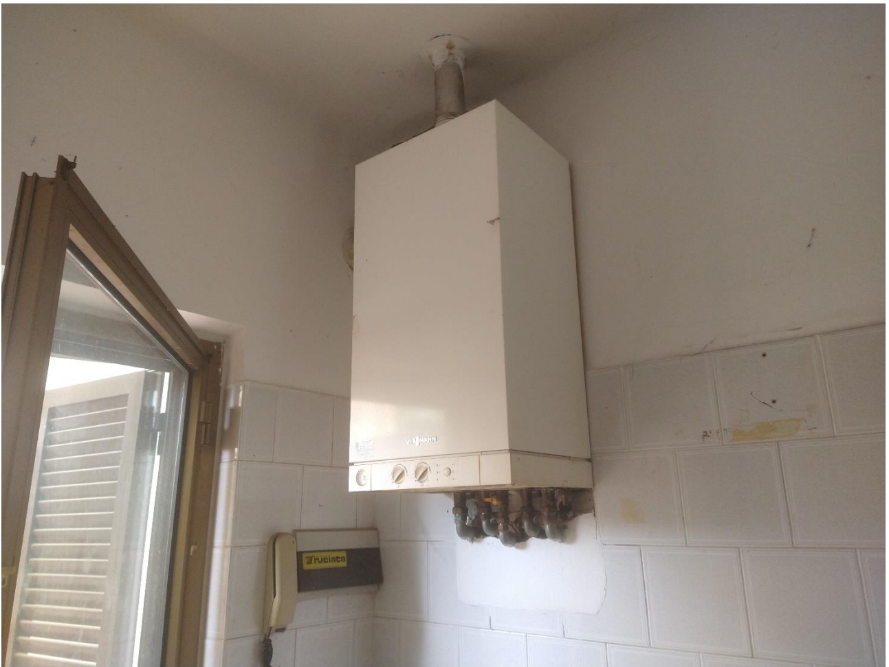
CALDAIA NEL LOCLE INGRESSO – CUCINA – INFISSI IN ALLUMINIO ANODIZZATO