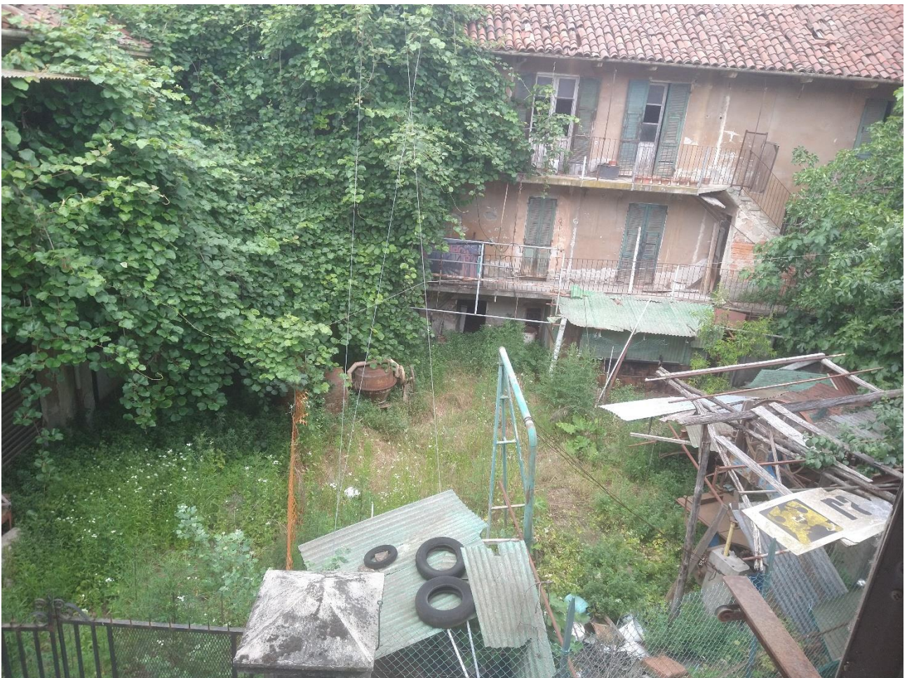
VISTA DI AREA IN DEGRADO DA FINESTRA DISIMPEGNO