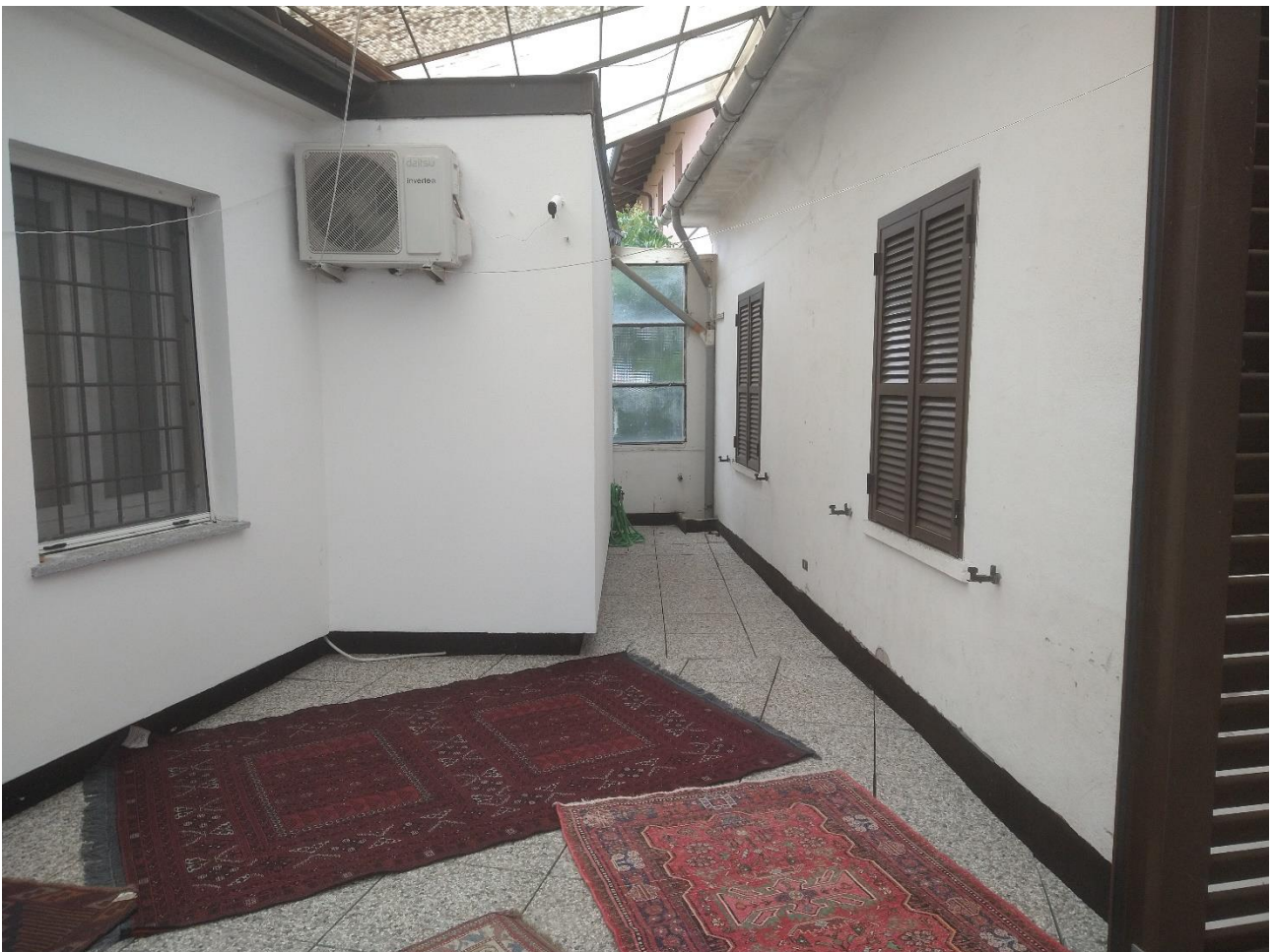
FACCIATA DA TERRAZZO ALTRA PROSPETTIVA LA UI OGGETTO DI ESECUZIONE E' QUELLA A DESTRA