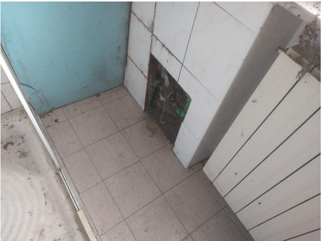
BAGNO – SARACINESCA ACQUA