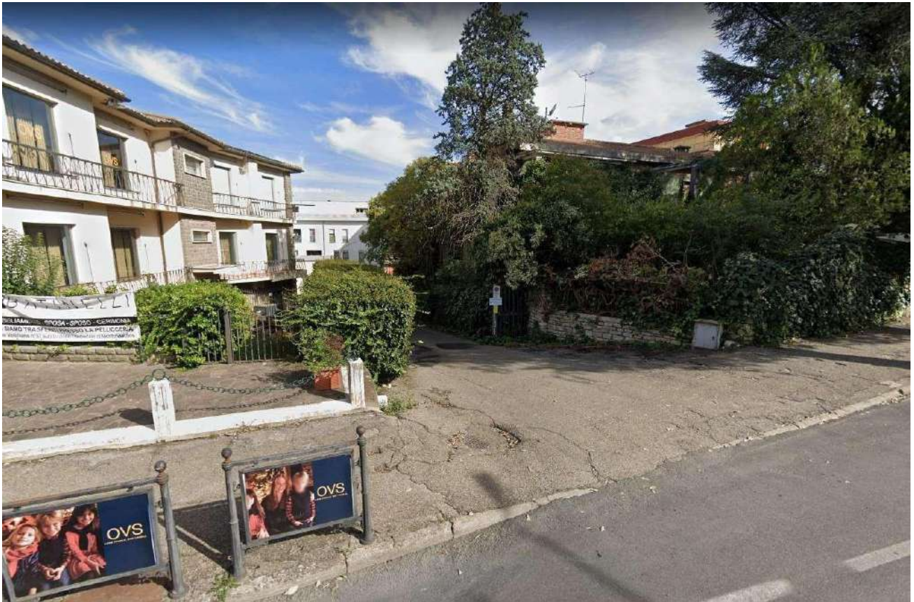
Foto 7 - Accesso da Via Dante Alighieri