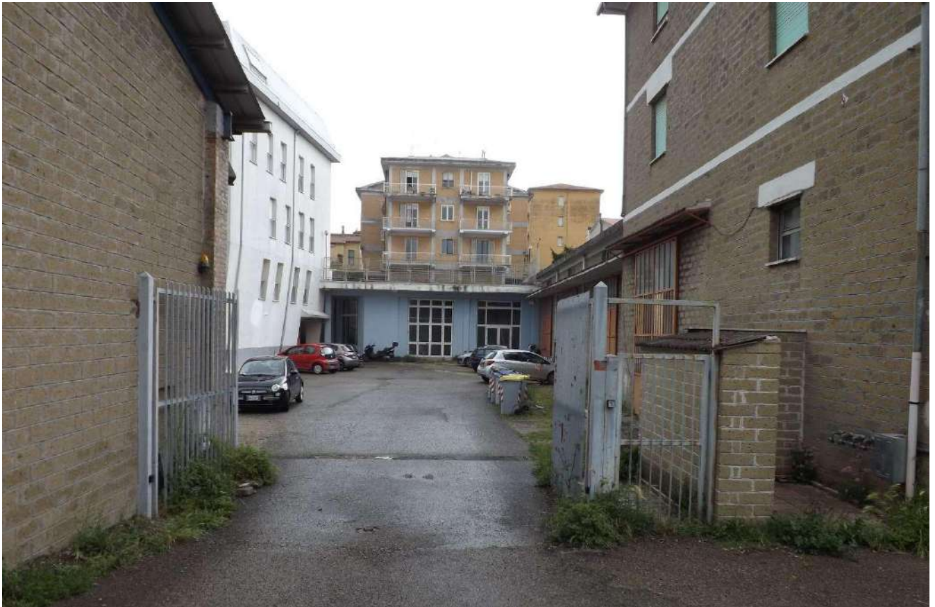
Foto 3 - Accesso da Via Cavalieri di Vittorio Veneto