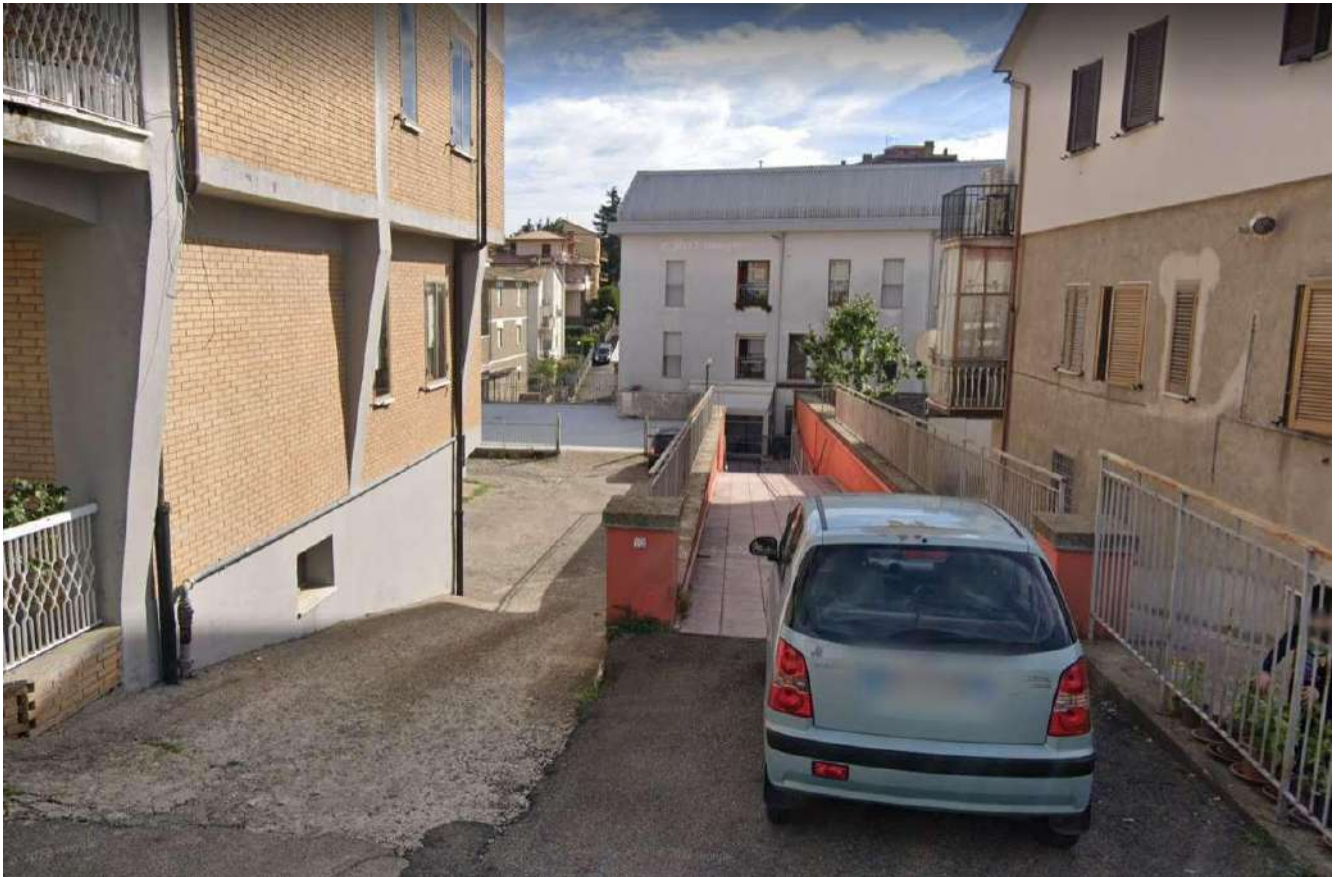
Foto 5 - Accesso da Via Tagliamento