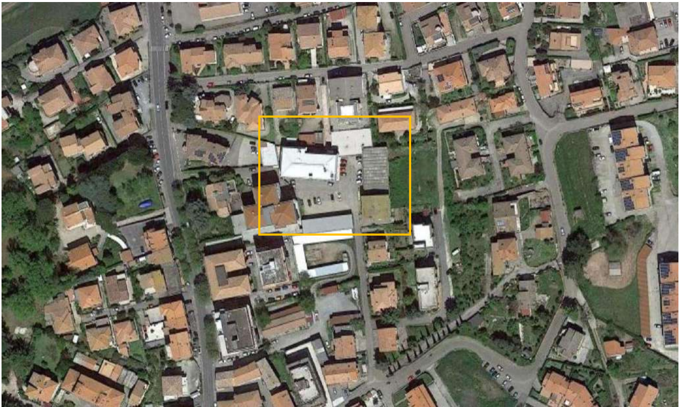
Foto 1 – Aereofotogrammetria con indicazione della massa fallimentare sita nel centro urbano di Montefiascone