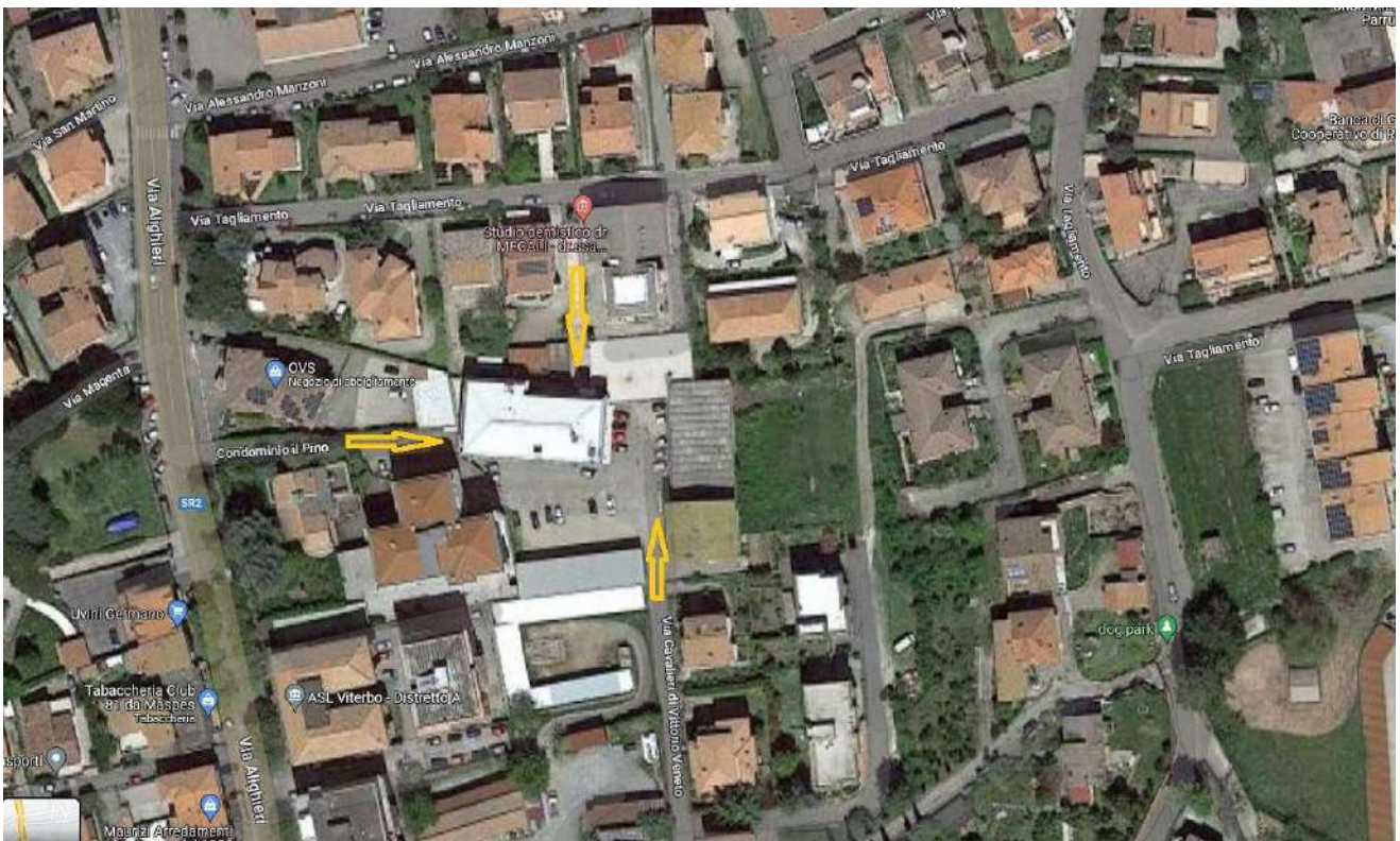
Foto 2 – Aereofotogrammetria con individuazione delle vie d'accesso