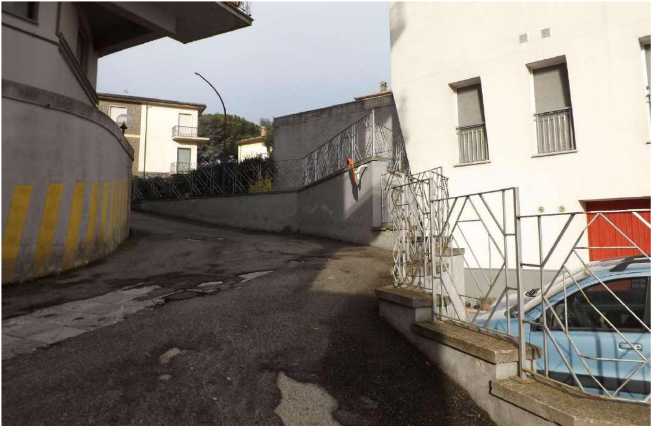
Foto 9 - Dettaglio rampa accesso da Via Dante Alighieri