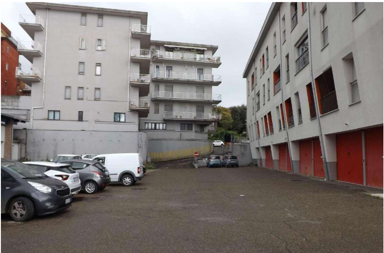
Foto 8 - Accesso da Via Dante Alighieri