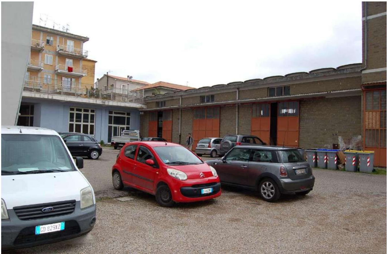
Foto 11 - Vista della corte comune adibita a parcheggio