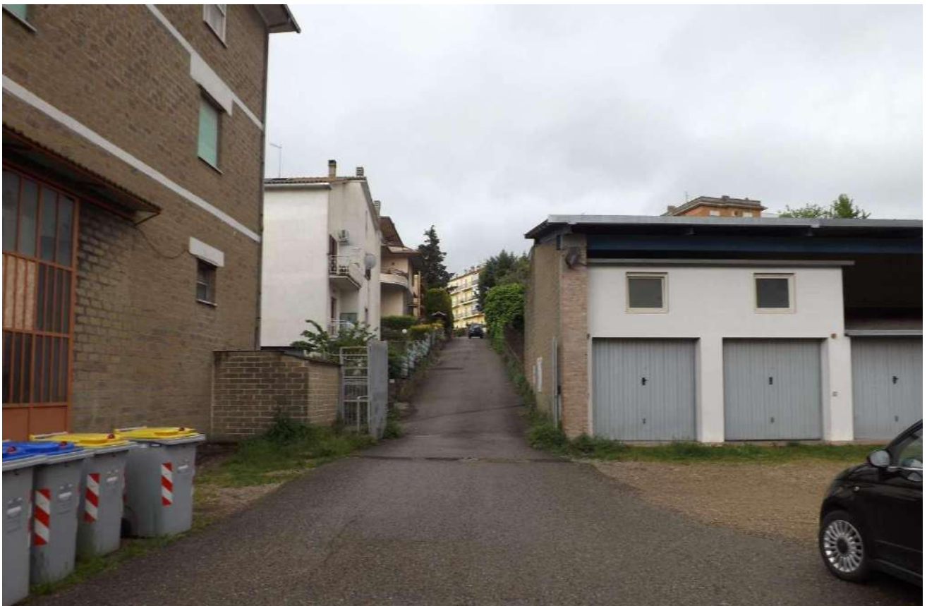
Foto 4 - Accesso da Via Cavalieri di Vittorio Veneto