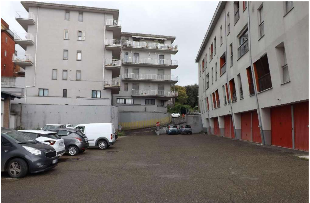
Foto 10 - Vista della corte comune adibita a parcheggio