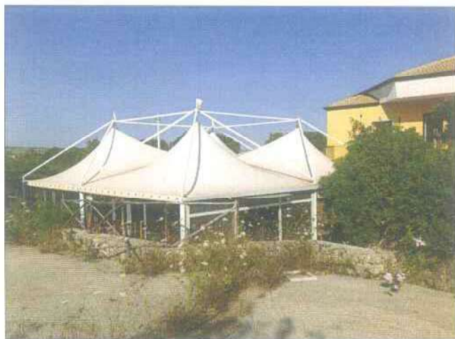
Foto 27 locale gazebo