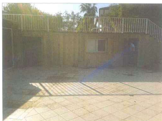
Foto 30 Locali pompe e deposito della piscina