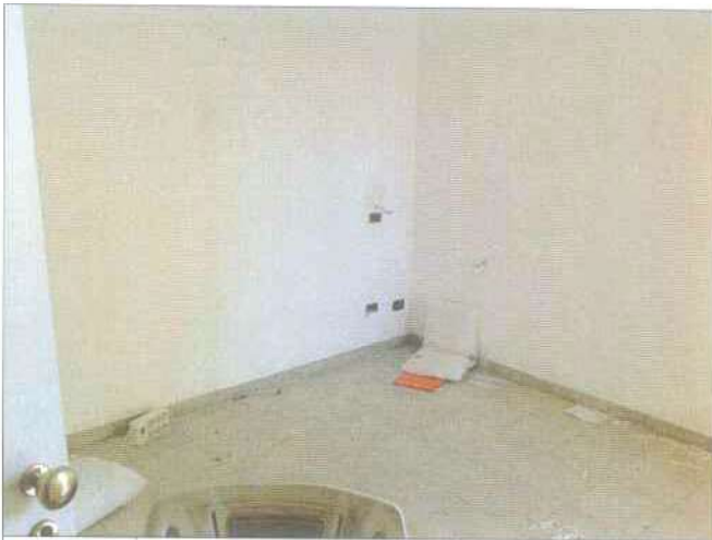
Foto 19 interni piano terra