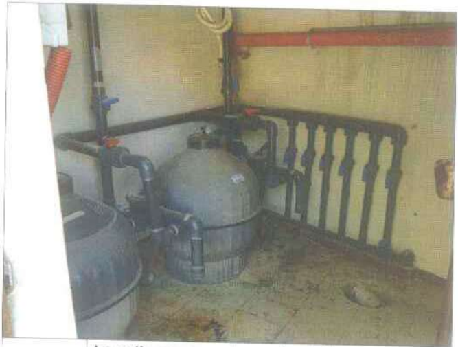
Foto 32 Locali pompe e deposito della piscina