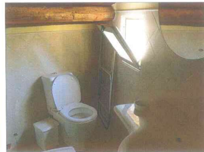
Foto 6 Interni piano mansarda