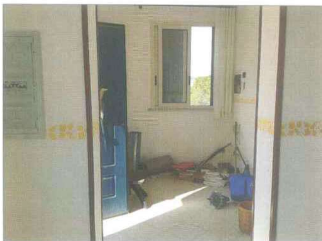
Foto 10 interni piano terra