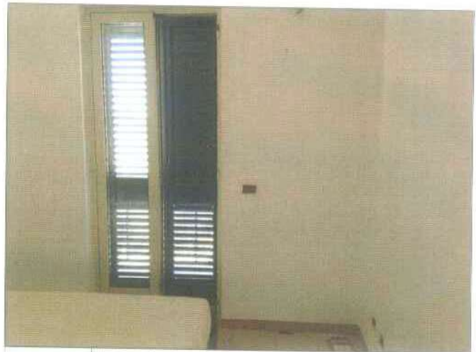
Foto 16 interni piano terra