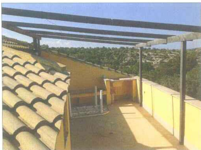
Foto 1 terrazza piano mansarda