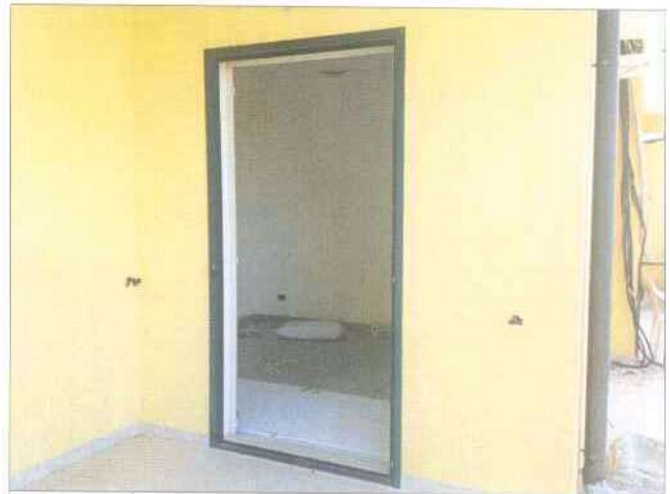
Foto 20 esterni piano terra