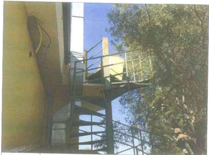
Foto 34 Prospetti esterni