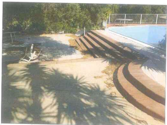
Foto 36 esterni