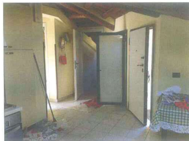
Foto 4 Interni piano mansarda