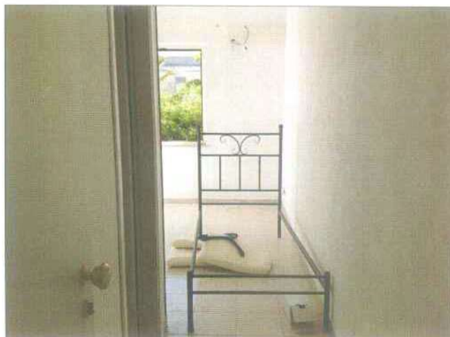
Foto 12 interni piano terra