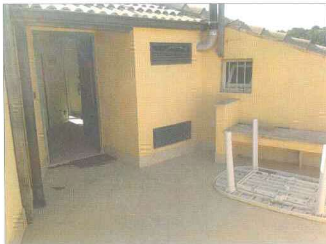
Foto 2 ingresso piano mansarda