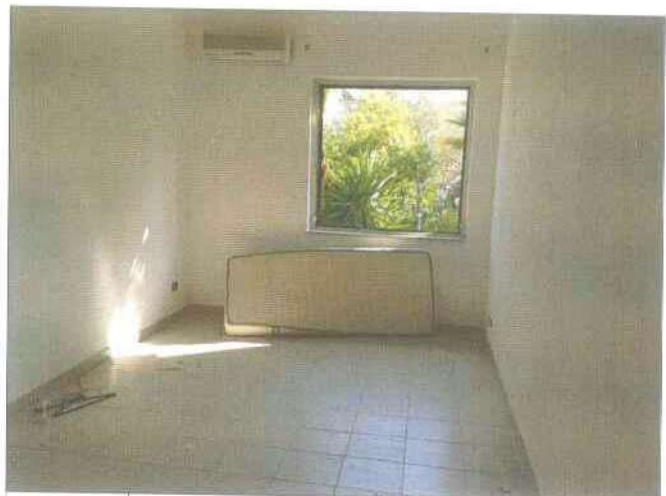
Foto 18 interni piano terra