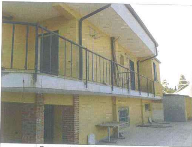
Foto 33 Prospetti esterni