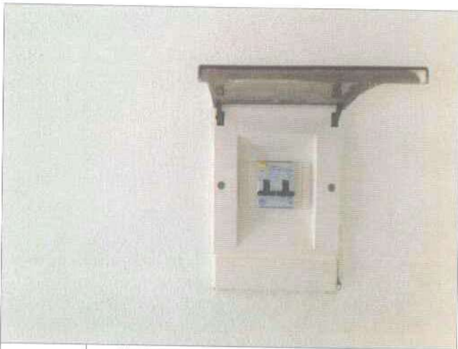
Foto 13 particolare quadretto elettrico camere piano terra