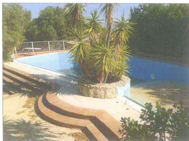
Foto 29 Piscina