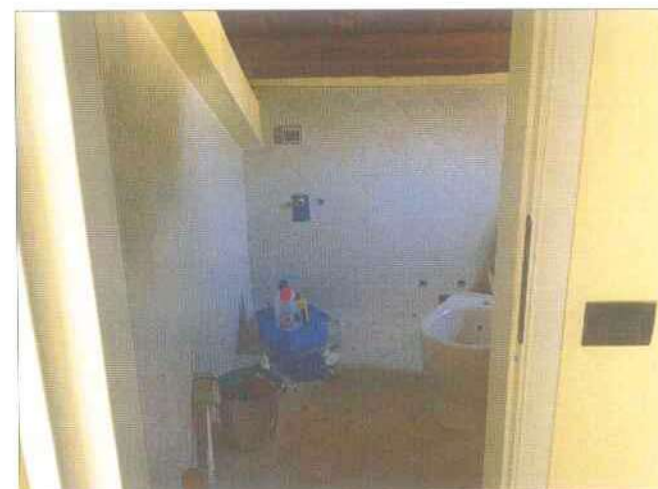
Foto 5 Interni piano mansarda