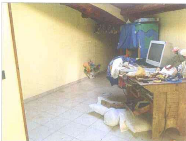
Foto 8 Interni piano mansarda