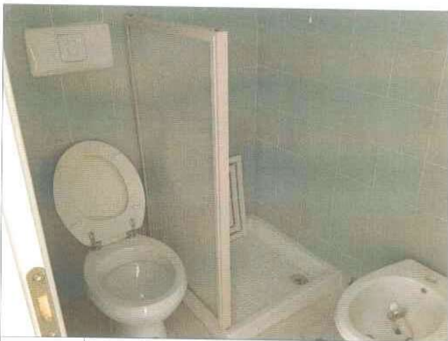
Foto 15 interni piano terra