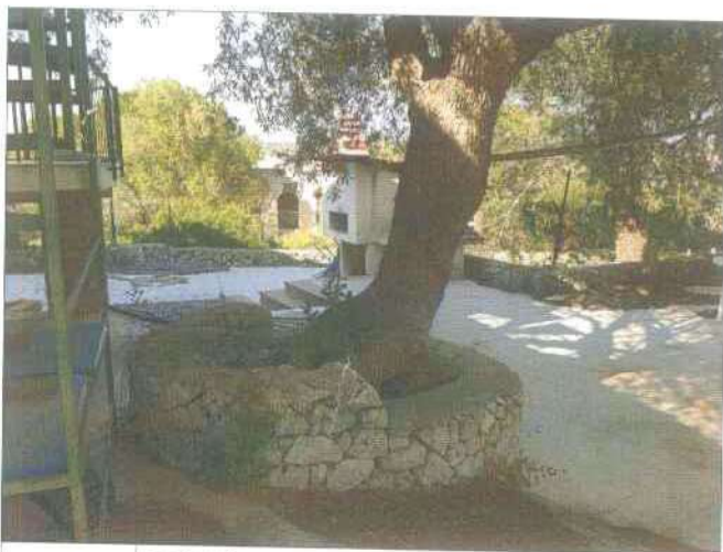
Foto 35 esterni