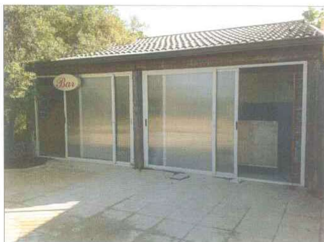
Foto 28 area ristoro adiacente alla piscina