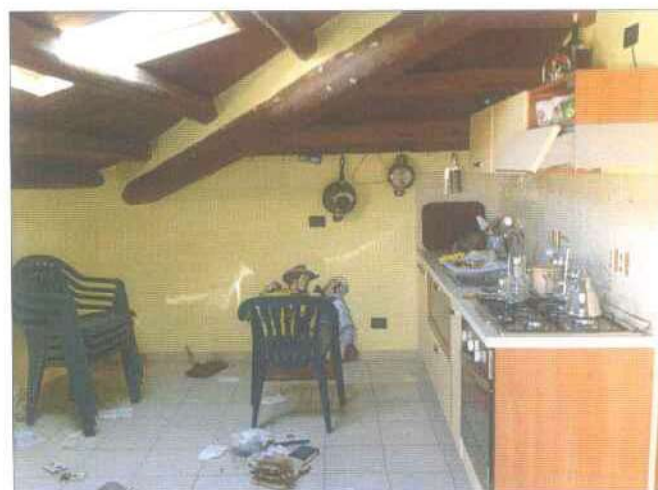
Foto 3 Interni piano mansarda