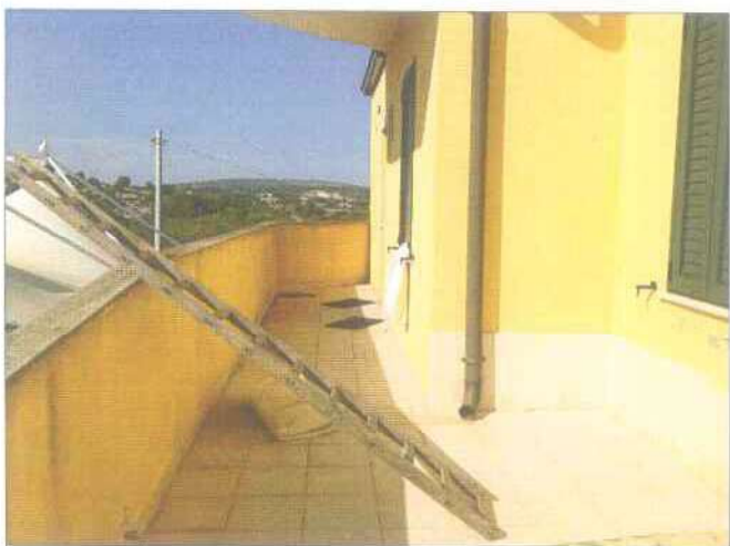
Foto 9 Accesso al piano terra