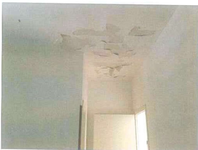
Foto 17 interni piano terra (ammalloreamenti intonaci del solaio)