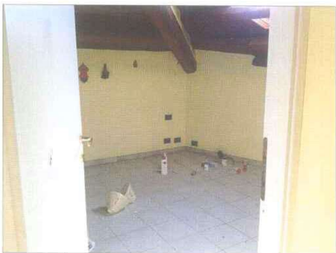
Foto 7 Interni piano mansarda