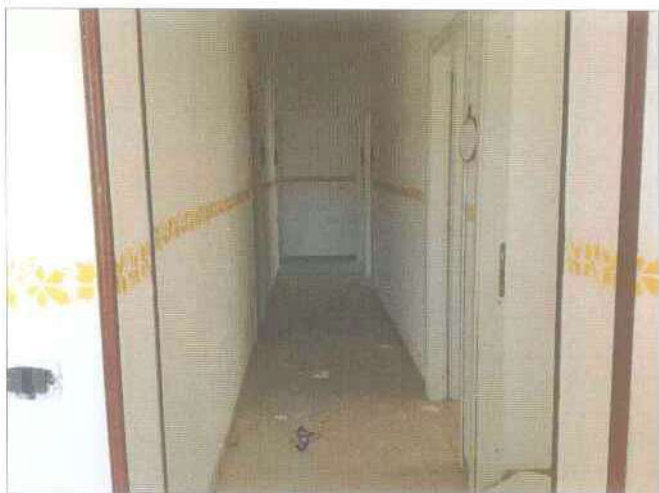
Foto 11 interni piano terra