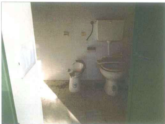
Foto 25 blocco servizi igienici