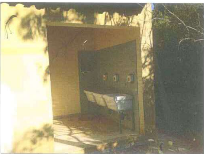
Foto 23 blocco servizi igienici