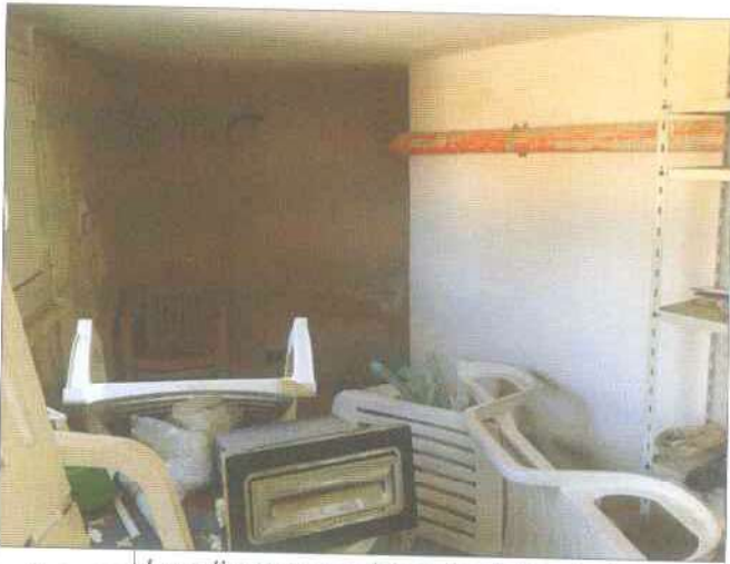
Foto 31 Locali pompe e deposito della piscina