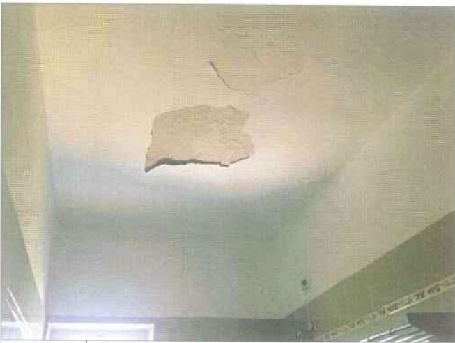
Foto 21 interni piano terra (ammalloreamenti intonaci del solaio)