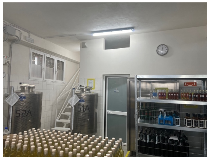
Laboratorio per lavorazione - Servizi