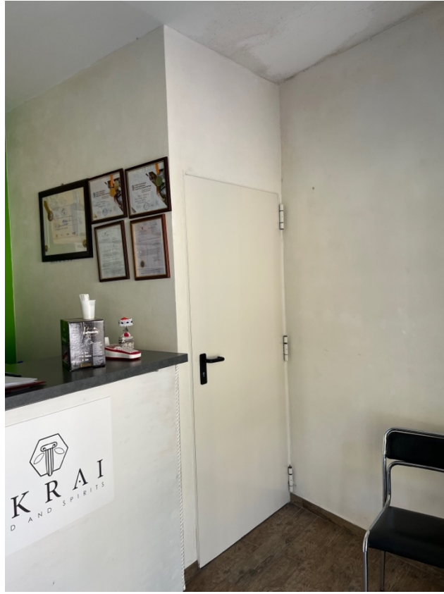
Ingresso vano scala PT