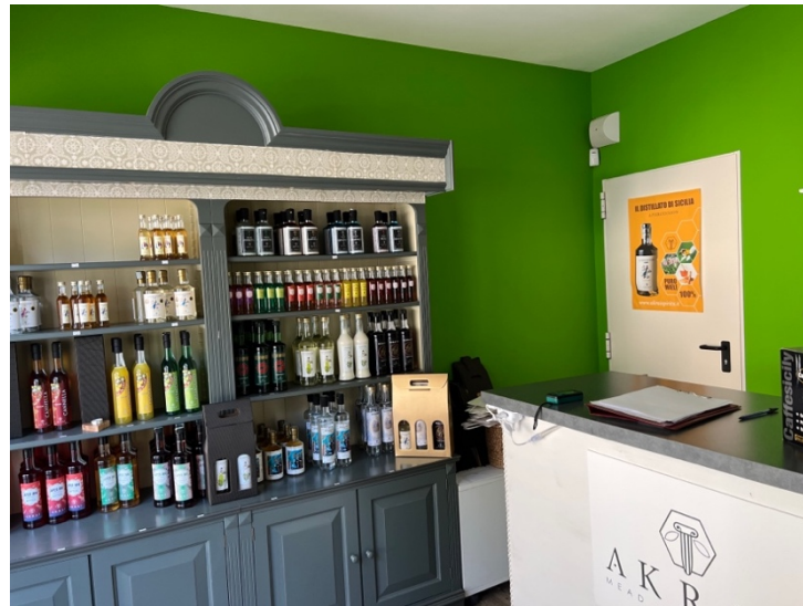
Vano stoccaggio alcolici