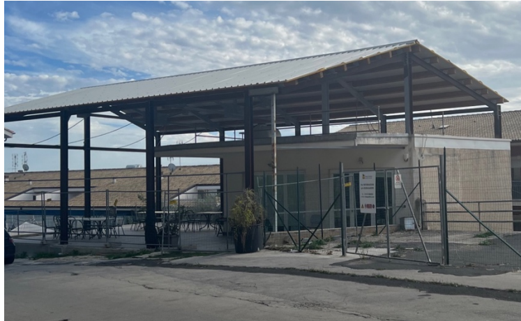
Vista su via IV novembre