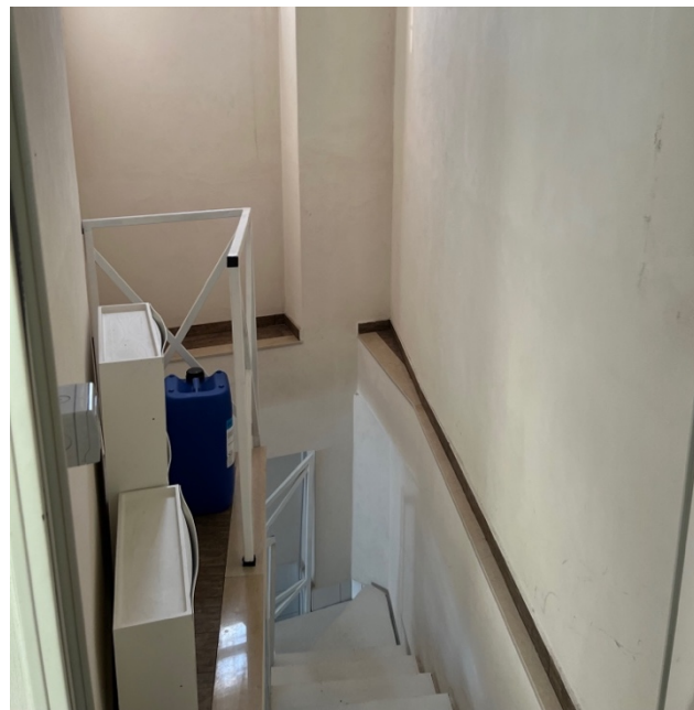
Vano scala PT