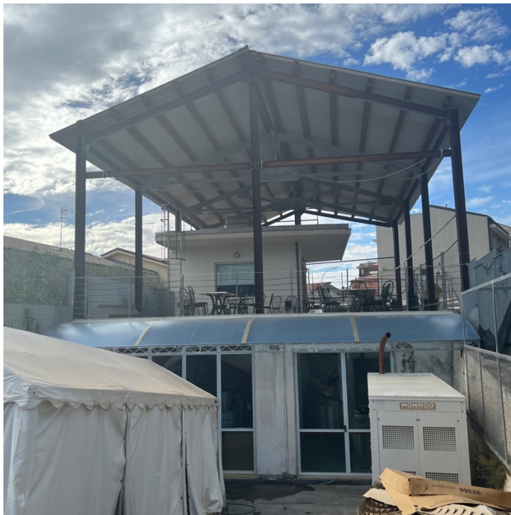
Ingresso locale seminterrato