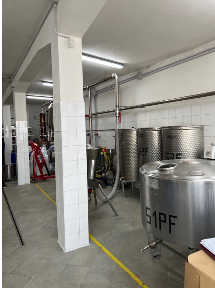
Laboratorio per lavorazione