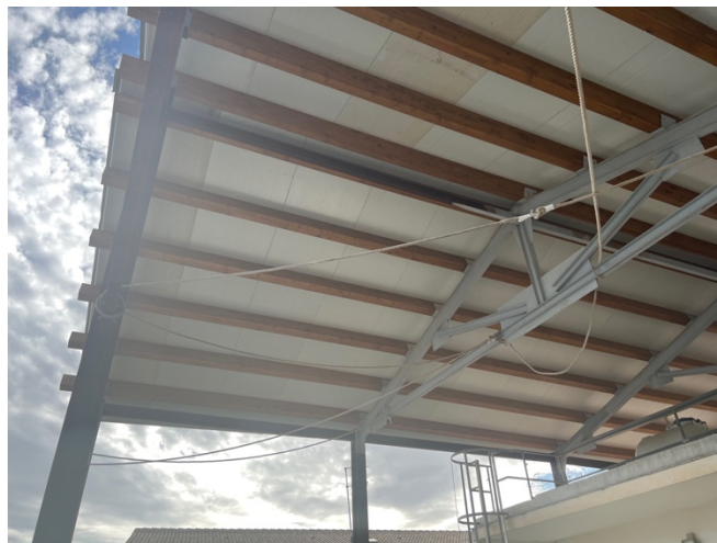
Copertura - Dettaglio