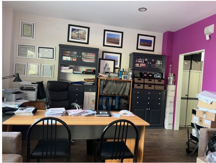
Vano deposito PT