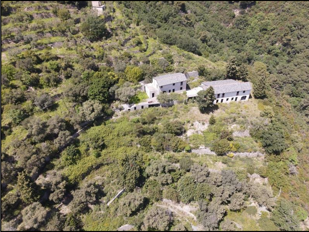
Foto n.1 – vista dall'alto dei fabbricati e dei terreni circostanti