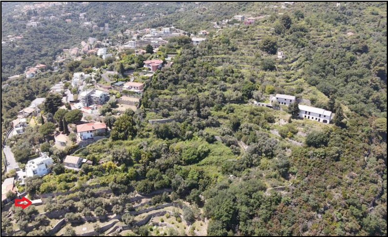
Foto n.1 – vista dall’alto del compendio – freccia rossa su ingresso