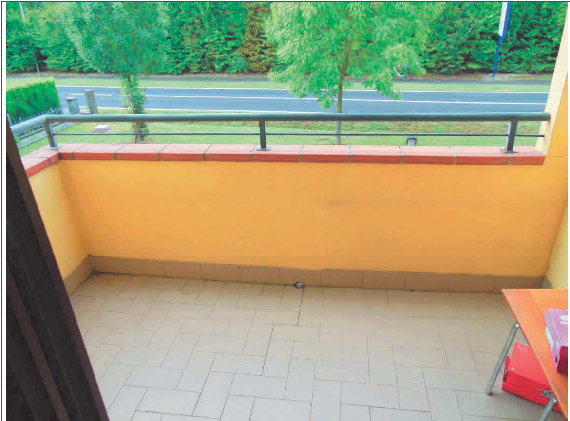
INTERNO APPARTAMENTO (LOGGIA SU CAMERA DA LETTO)