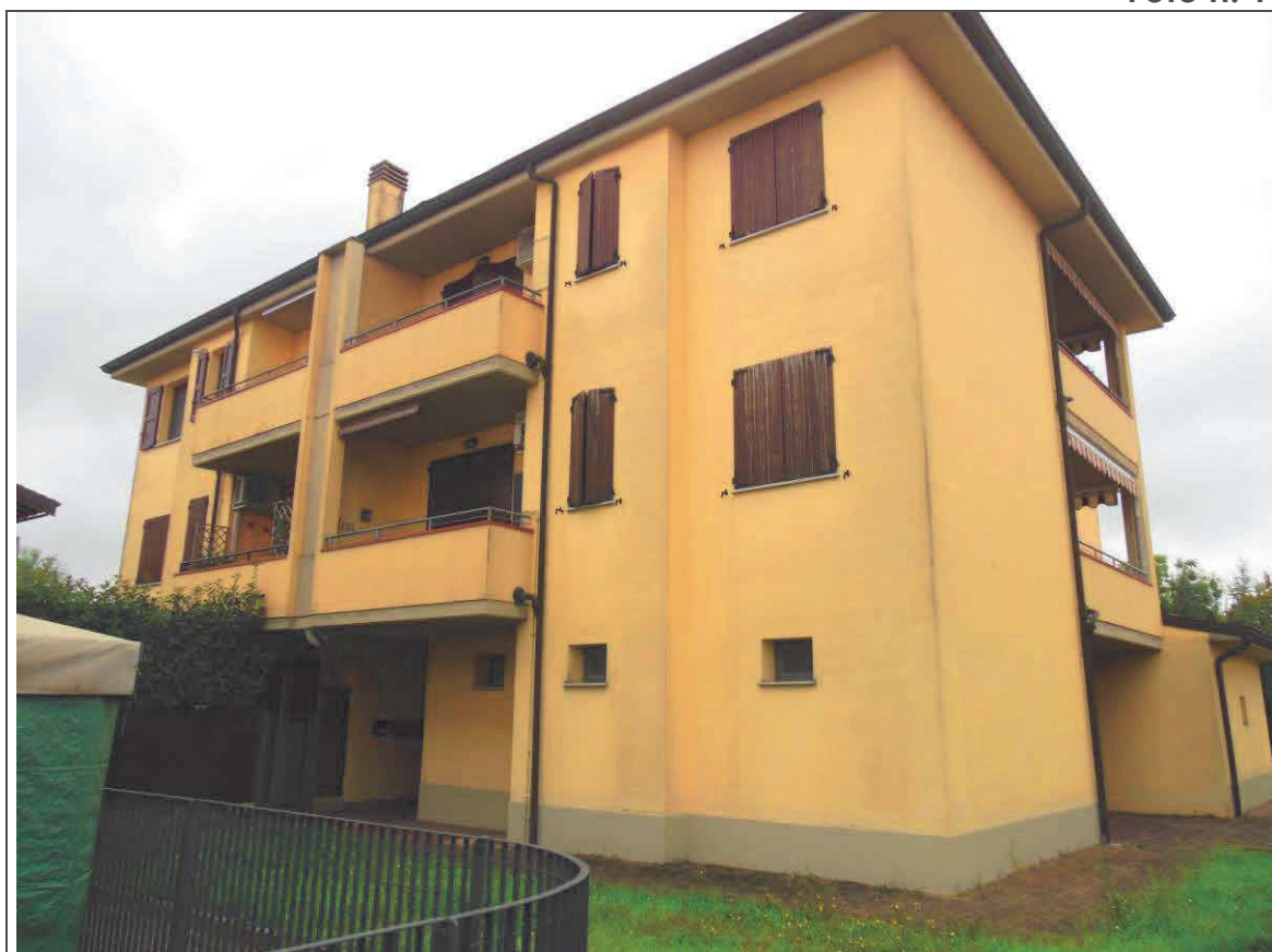
PROSPETTO GENERALE DEL FABBRICATO CONDOMINIALE - FRONTE DI INGRESSO