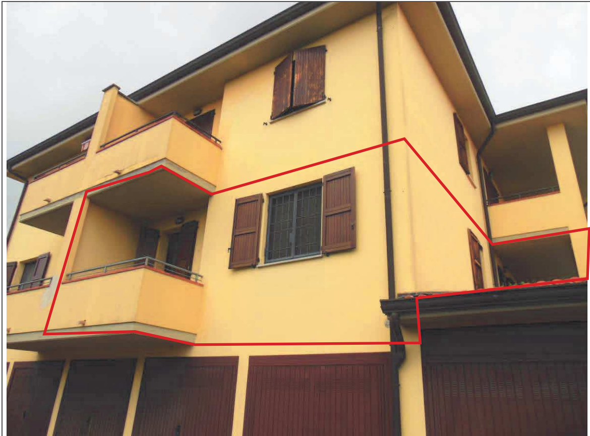
PROSPETTO SUD FABBRICATO – APPARTAMENTO AL P. 1