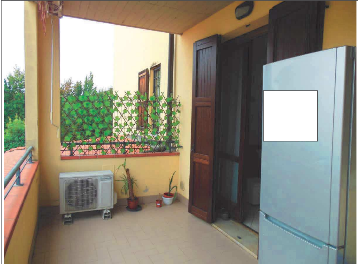
INTERNO APPARTAMENTO (LOGGIA SU SOGGIORNO)