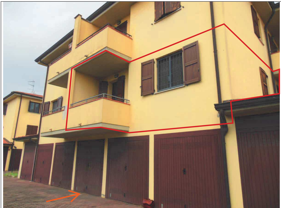
PROSPETTO SUD FABBRICATO – APPARTAMENTO AL P. 1 E GARAGE