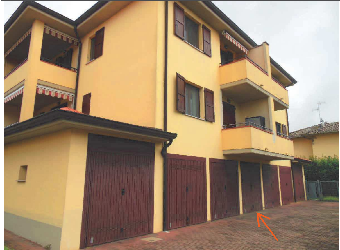
PROSPETTO SUD FABBRICATO – GARAGE