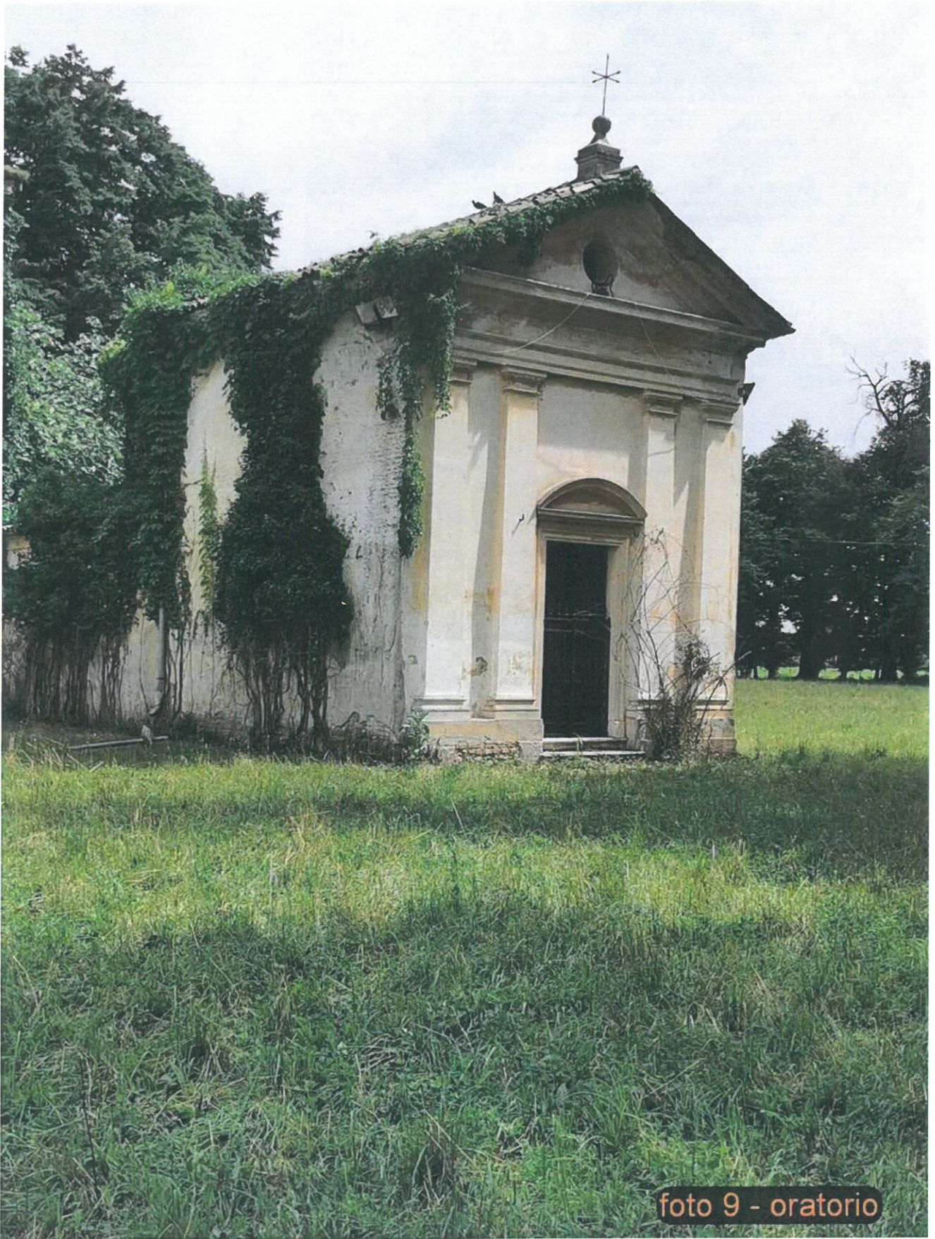
foto 9 - oratorio