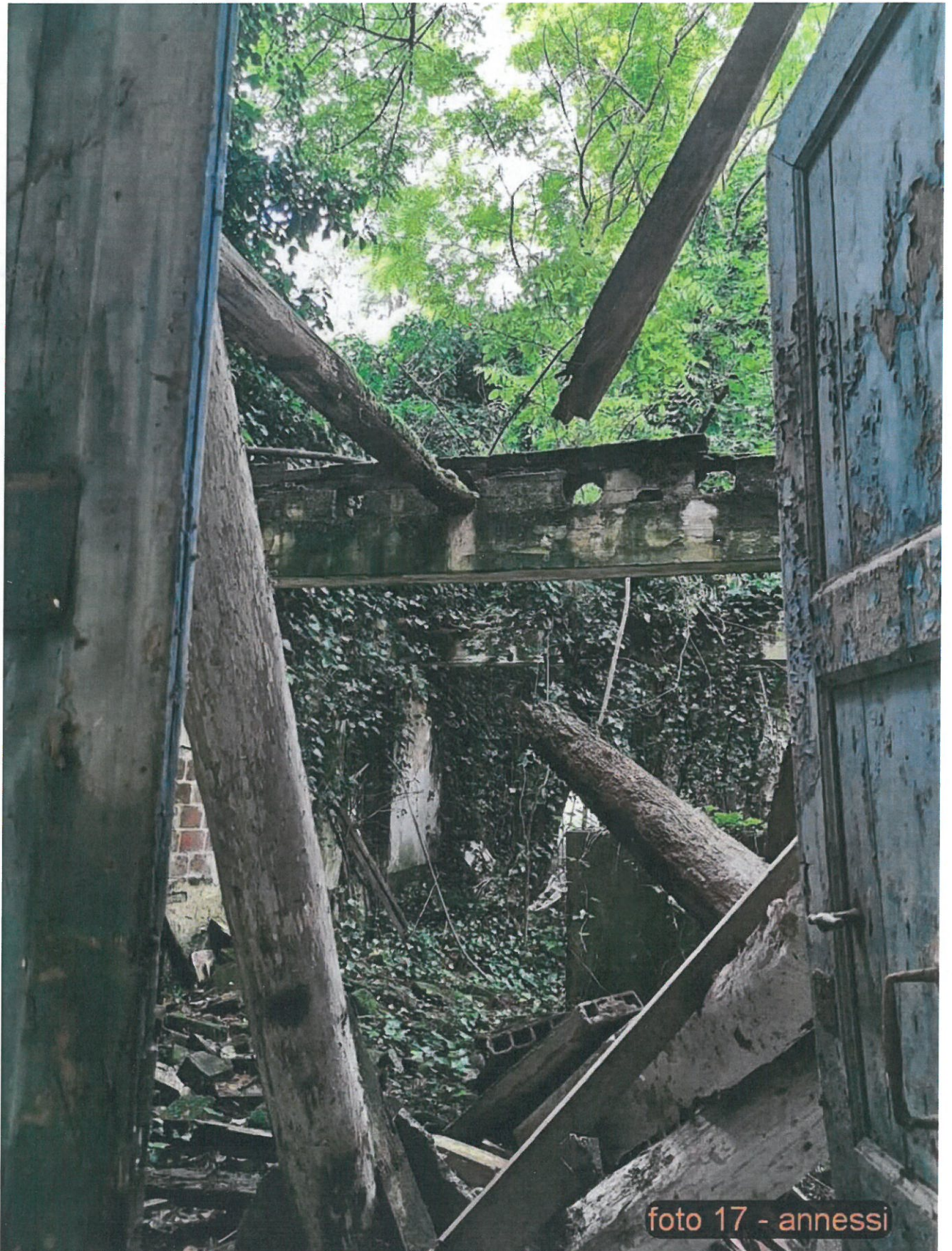
foto 17 - annessi