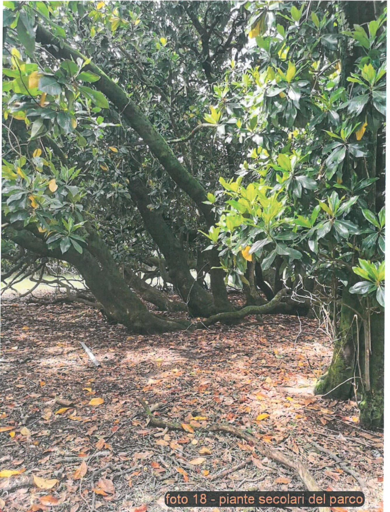
foto 18 - piante secolari del parco