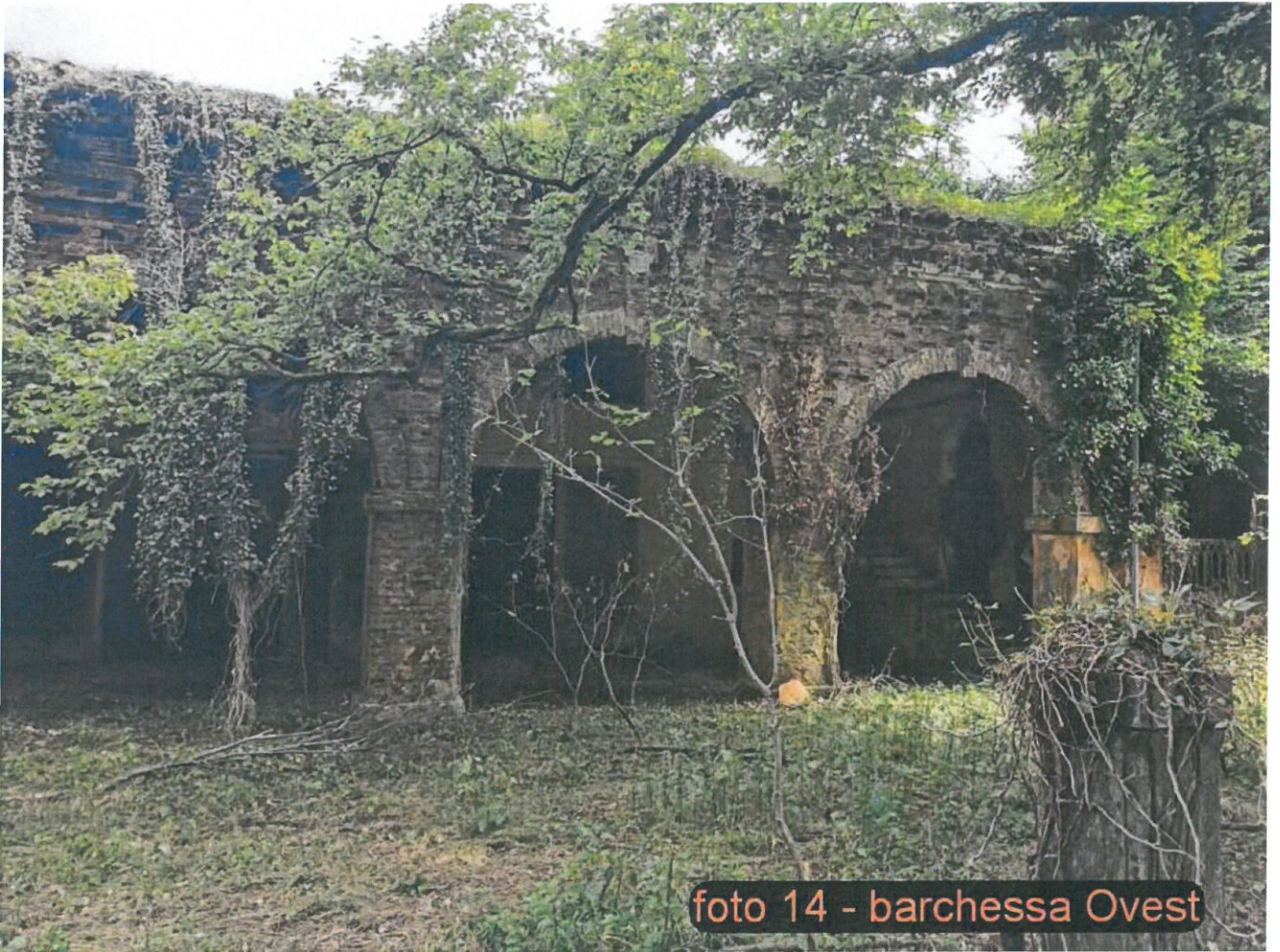
foto 14 - barchessa Ovest