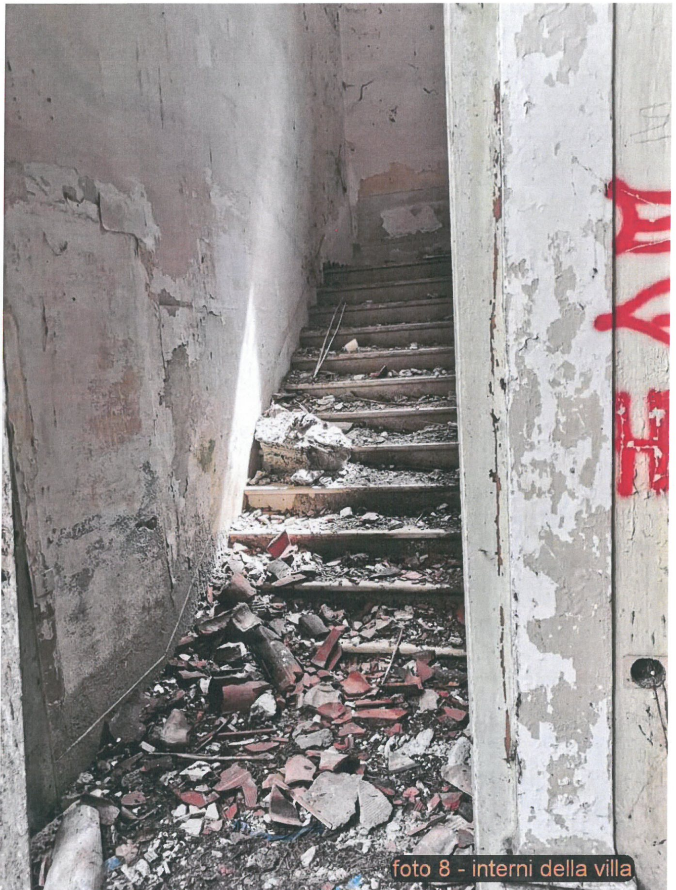
foto 8 - interni della villa