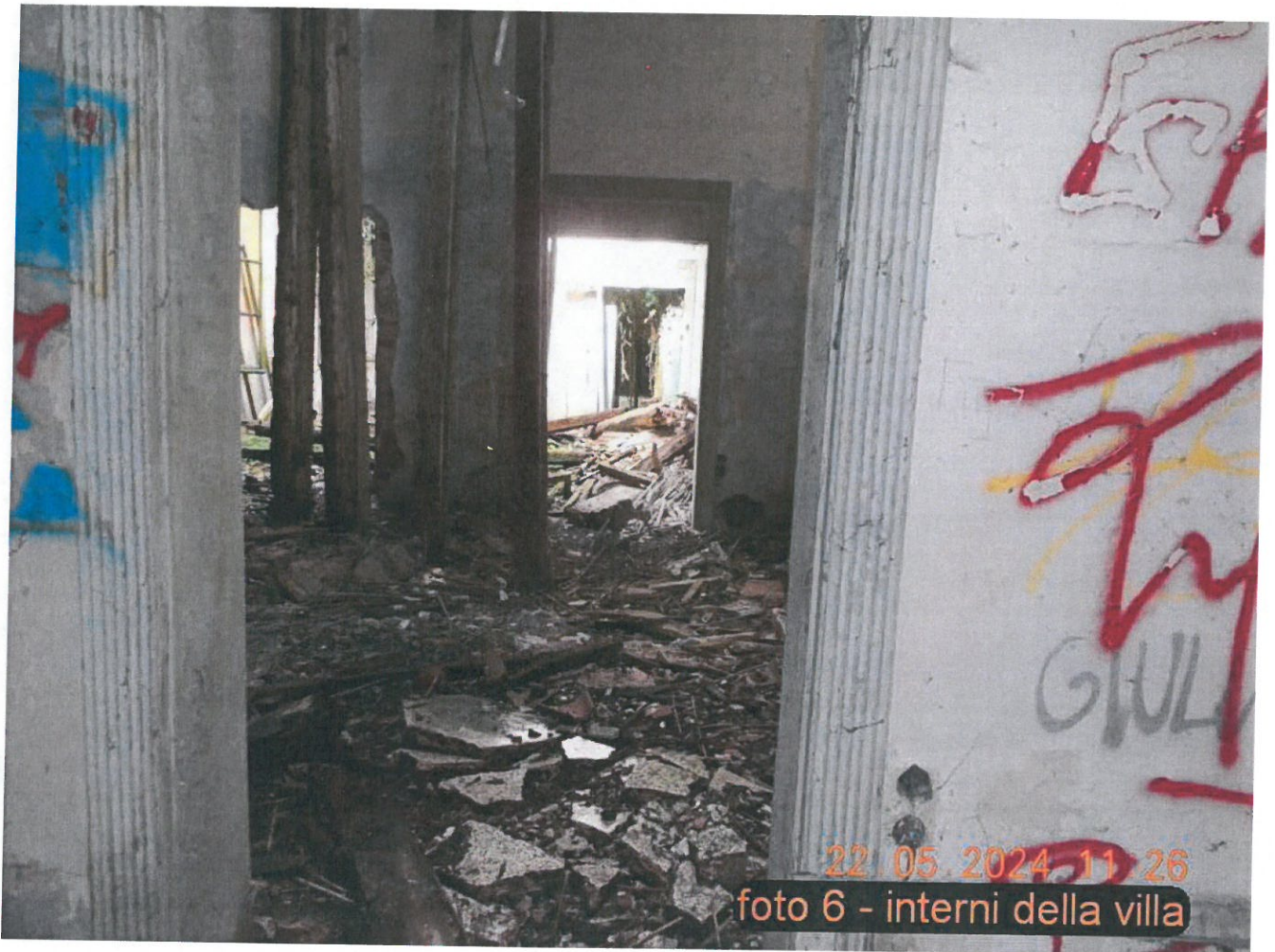
22.05.2024 11:26 foto 6 - interni della villa