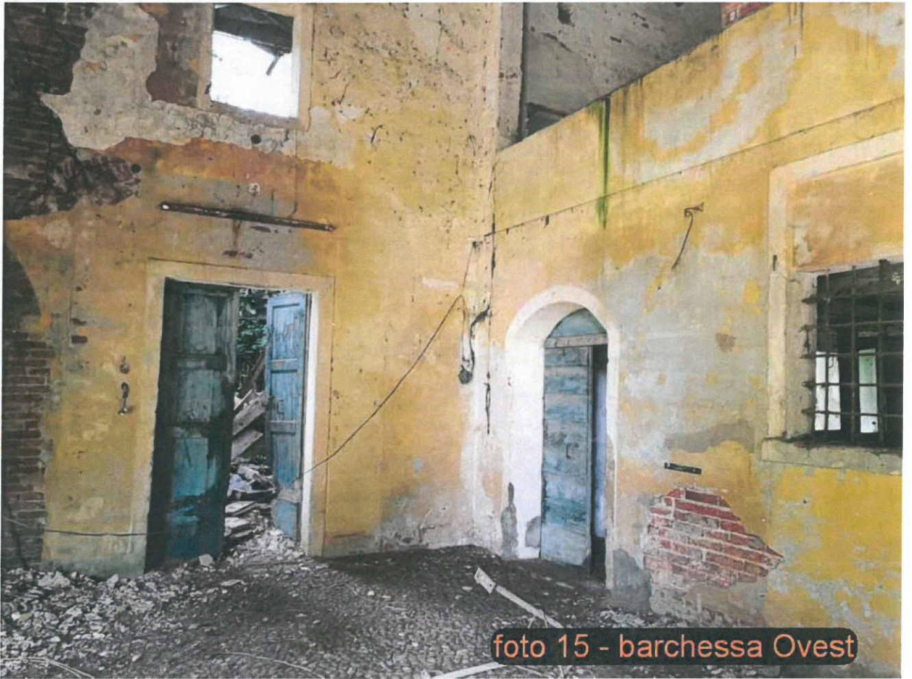
foto 15 - barchessa Ovest