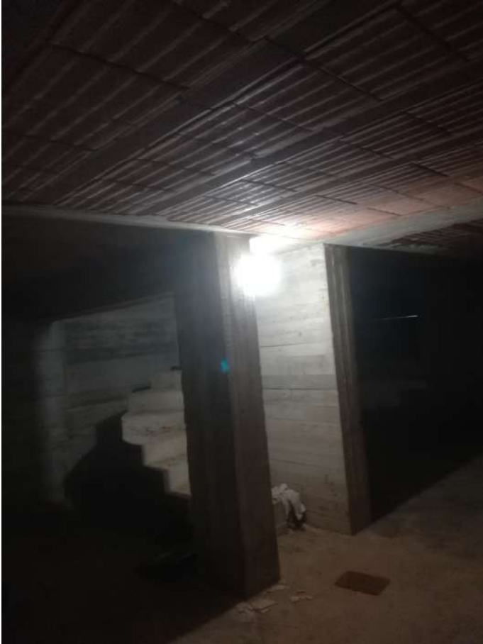
locale realizzato abusivamente I piano interrato del locale deposito