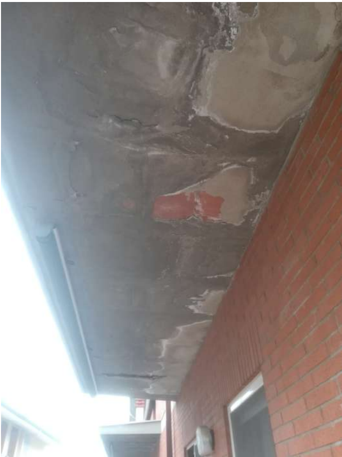
intradosso solaio di copertura