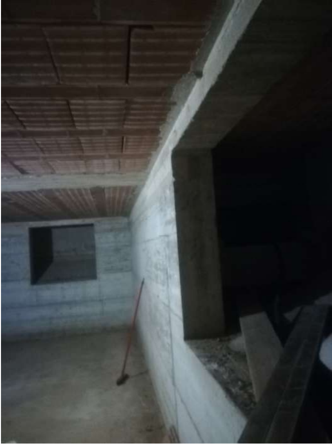
locale realizzato abusivamente I piano interrato del locale deposito