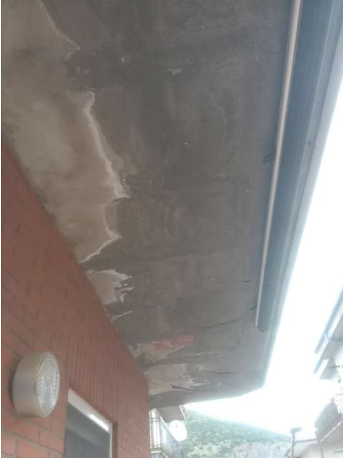
intradosso solaio di copertura