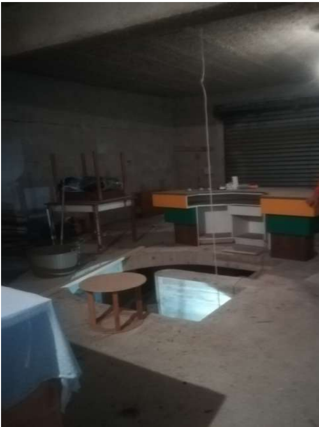
interno locale deposito – foro scala