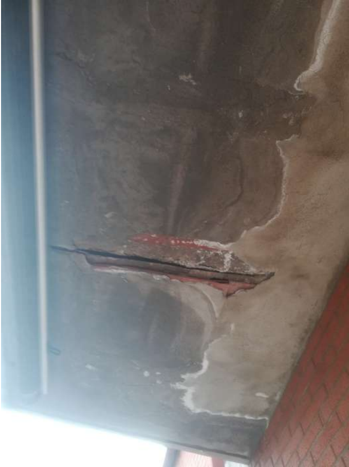
intradosso solaio di copertura