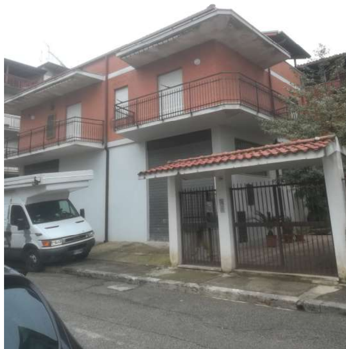
Accesso – Via V. Gioberti n°128