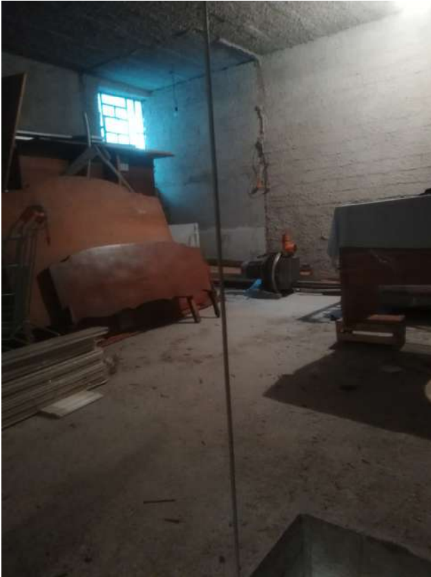
interno locale deposito

Locale deposito ubicato in Fondi (LT), in Via Genova n. 37 (fg. 22, mapp. 1236, sub. 6)