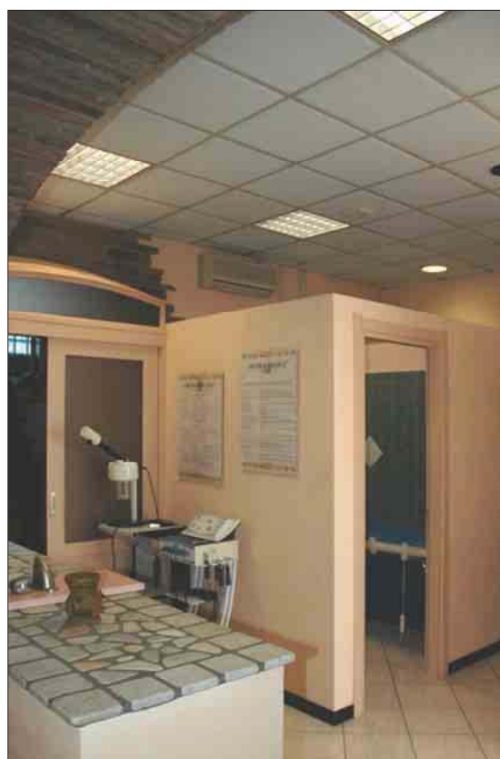
Foto n. 06-07-08-09: viste degli interni