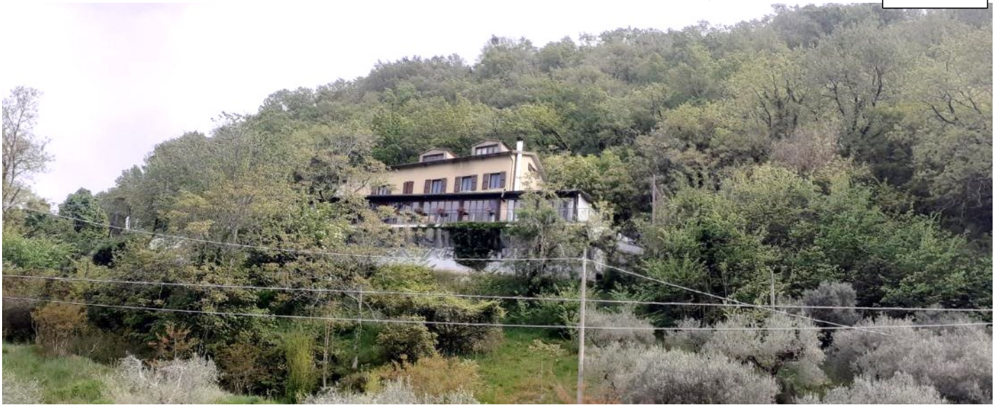
Foto 20 – La collina in cui ricade il bosco da stimare. In primo piano il complesso ricettivo della ditta esecutata