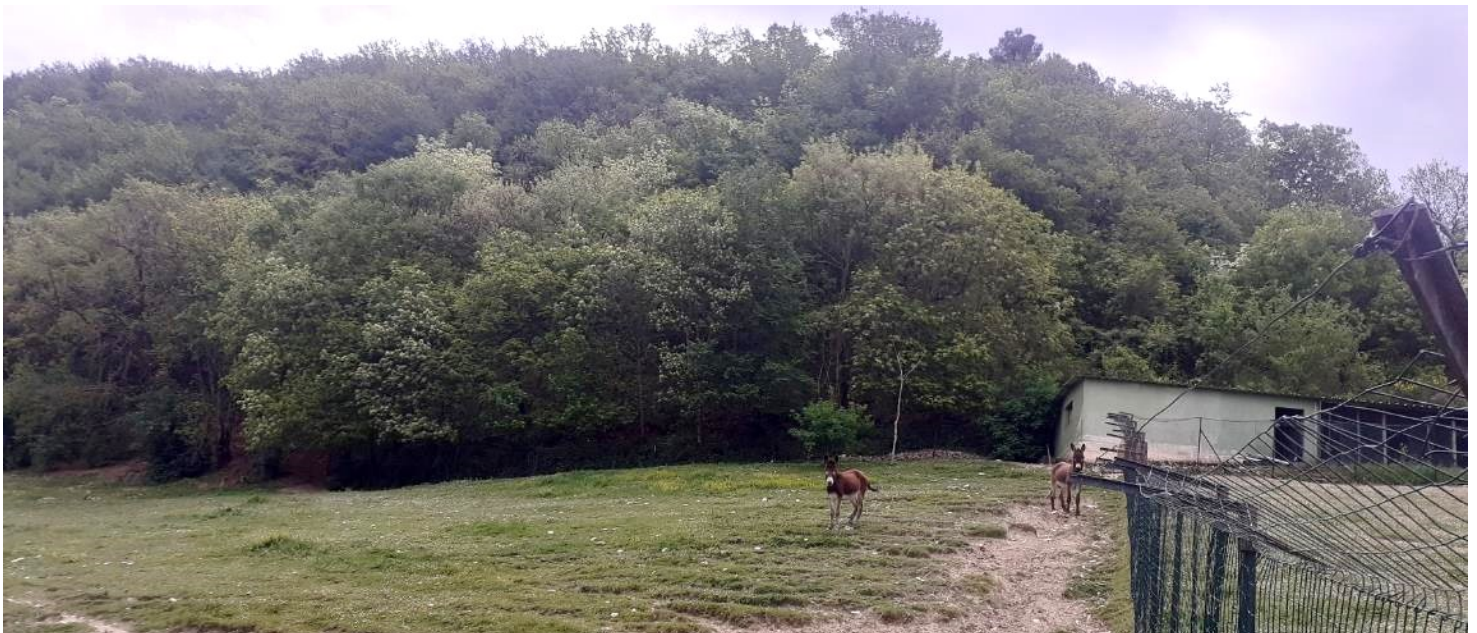
Foto 22 – Altra vista del bosco; all'interno sono ricavati due appezzamenti olivati