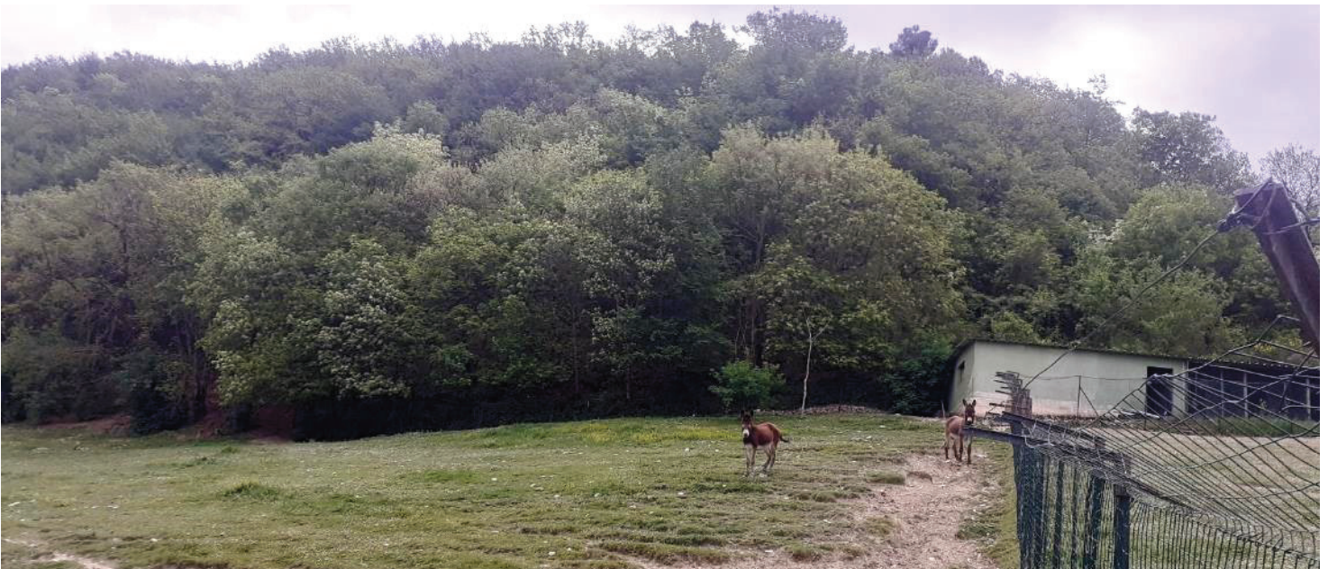
Foto 22 – Altra vista del bosco; all'interno sono ricavati due appezzamenti olivati