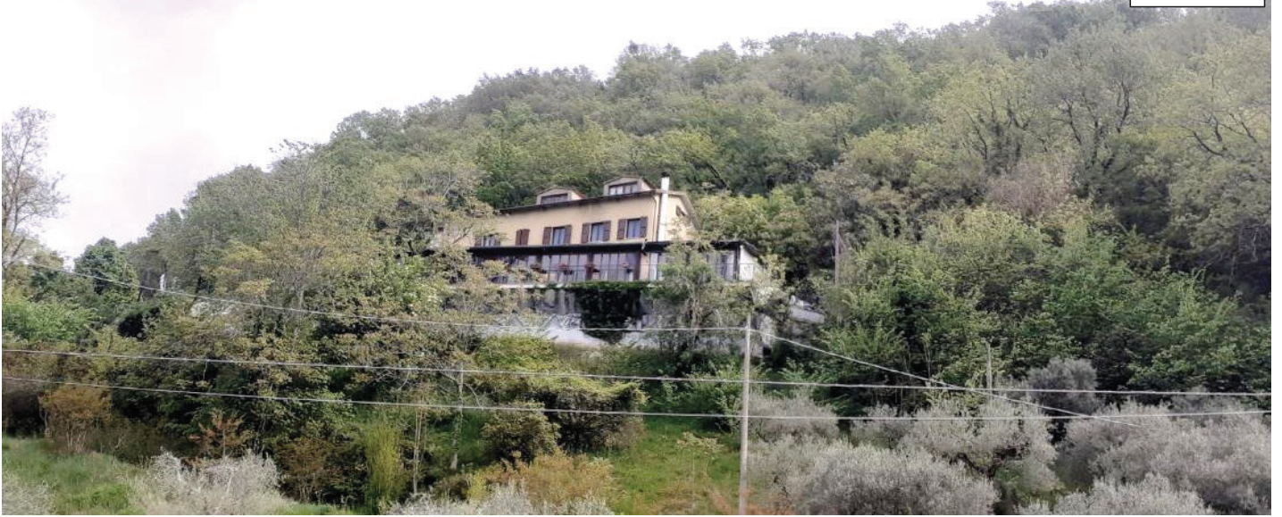
Foto 20 – La collina in cui ricade il bosco da stimare. In primo piano il complesso ricettivo della ditta esecutata