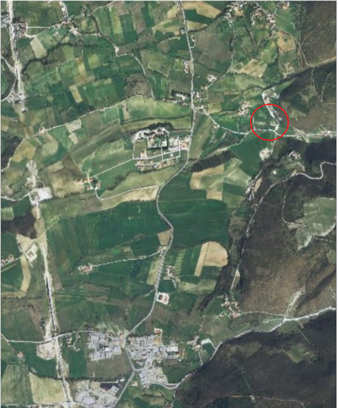
Figura 2 - Foto aerea dell'area in cui ricadono i lotti oggetto di stima.