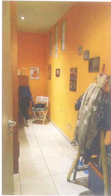
Piano Primo - Ripostiglio