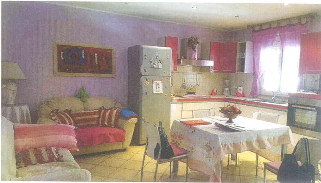
Piano Secondo - locale soggiorno-cucina