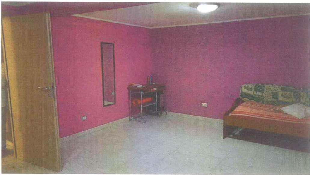
Camera al Piano rialzato