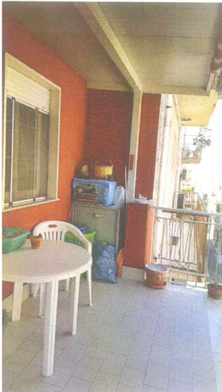
Piano Secondo - Terrazzo su via Monte Grappa