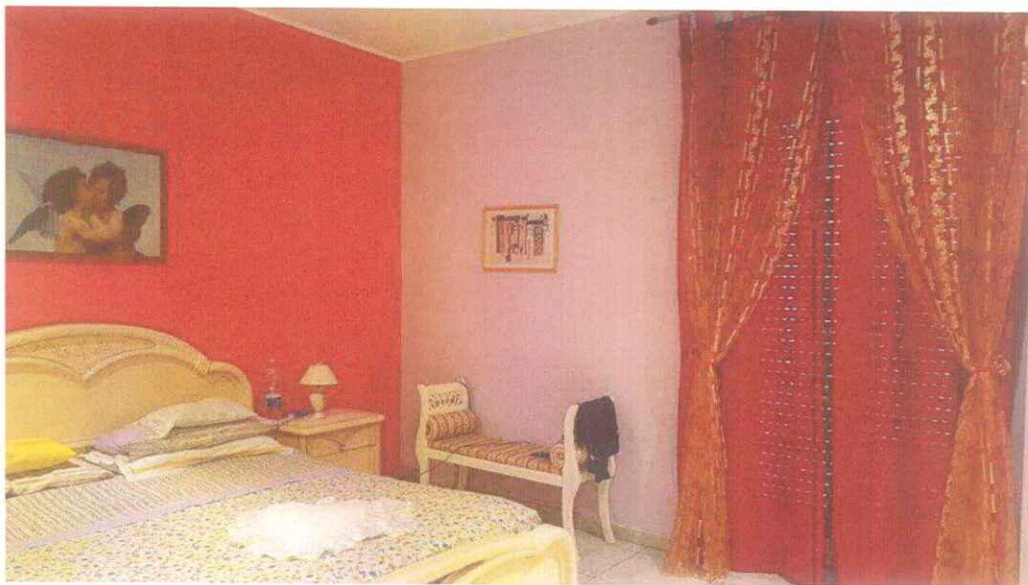
Piano Primo - Camera