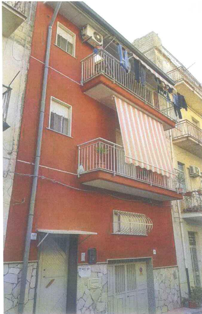
Prospetto su via Monte Grappa