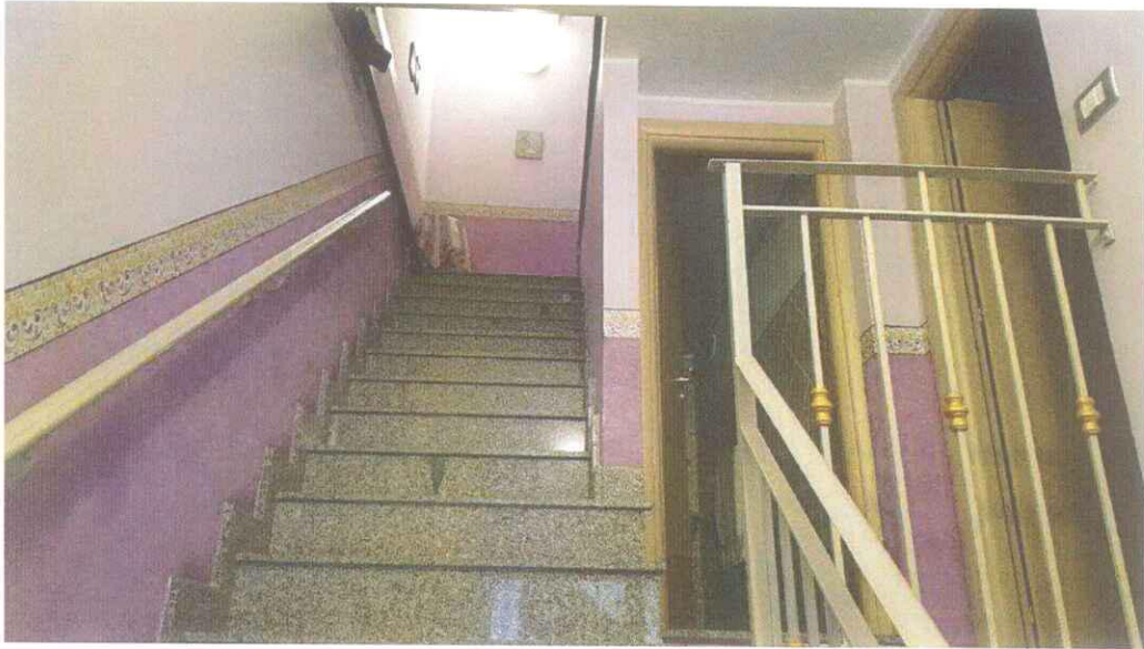
Vano scala e accesso al Piano rialzato