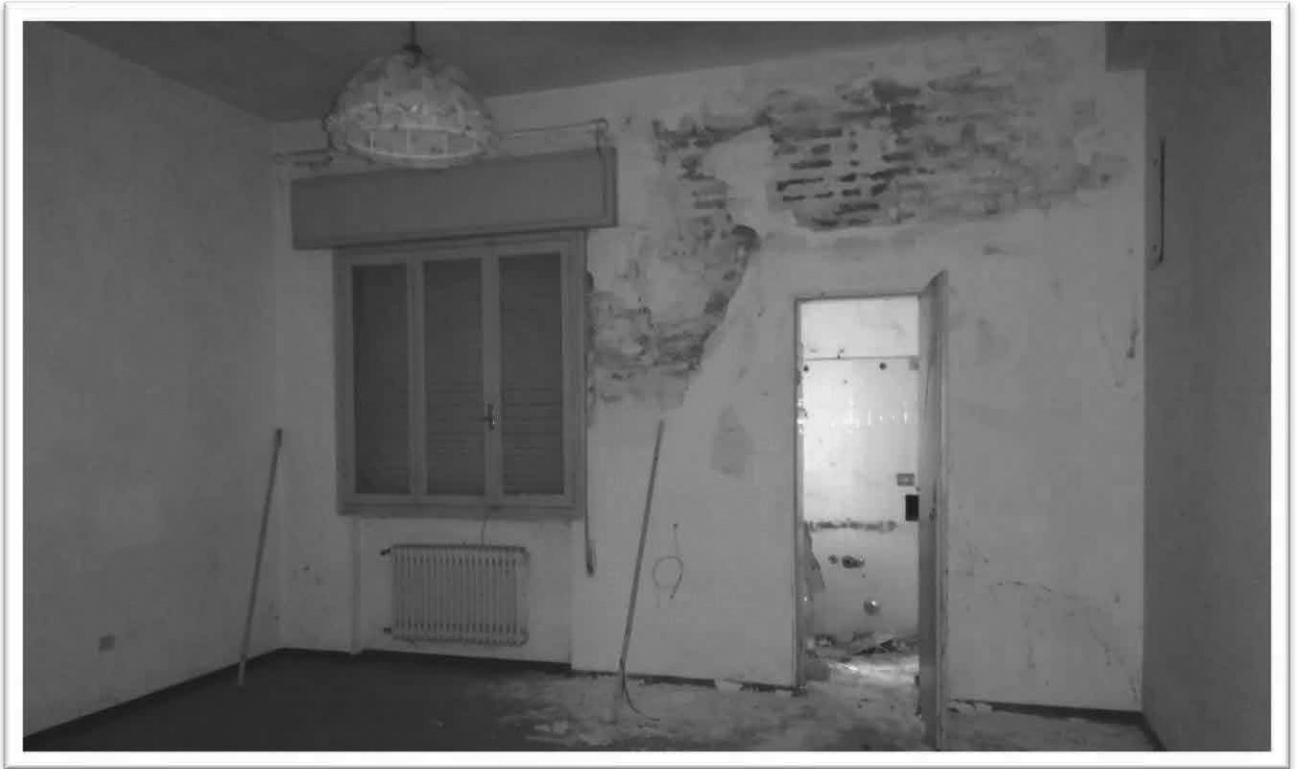
Figura 6 – Camera