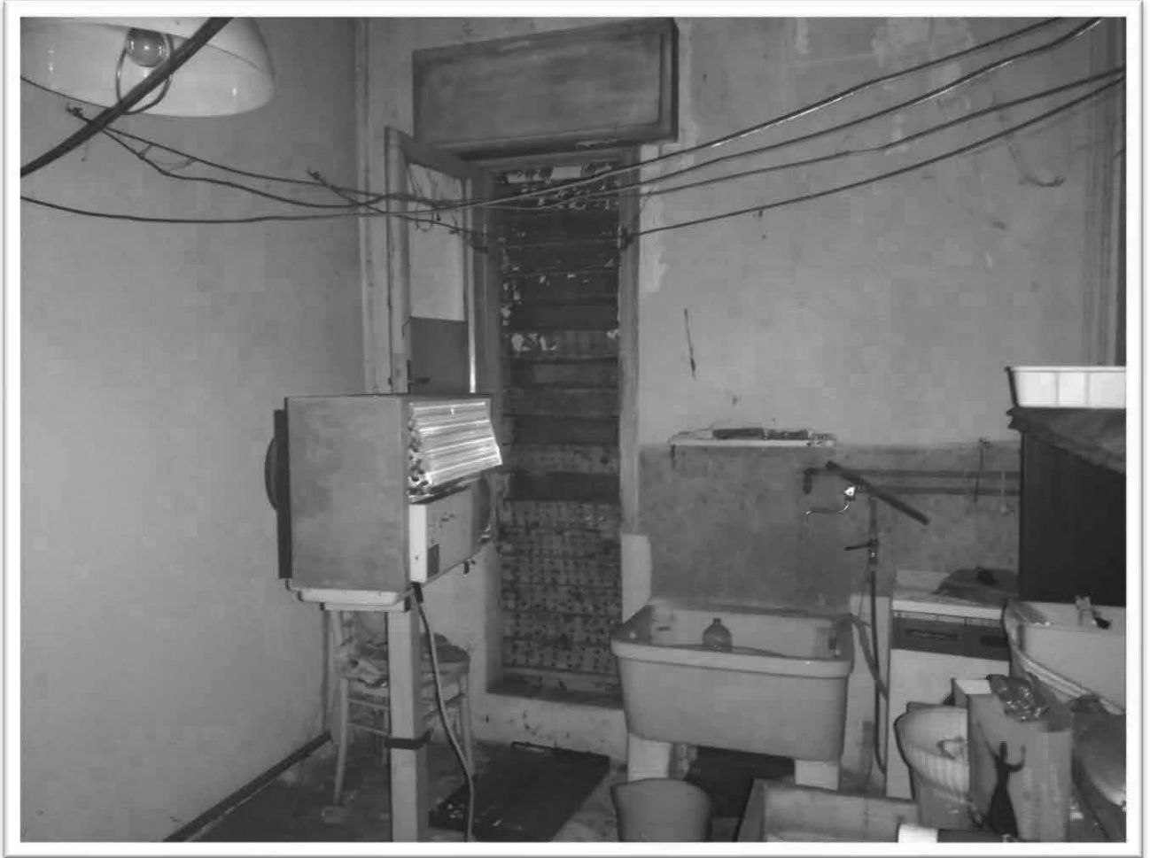
Figura 19 - Centrale termica