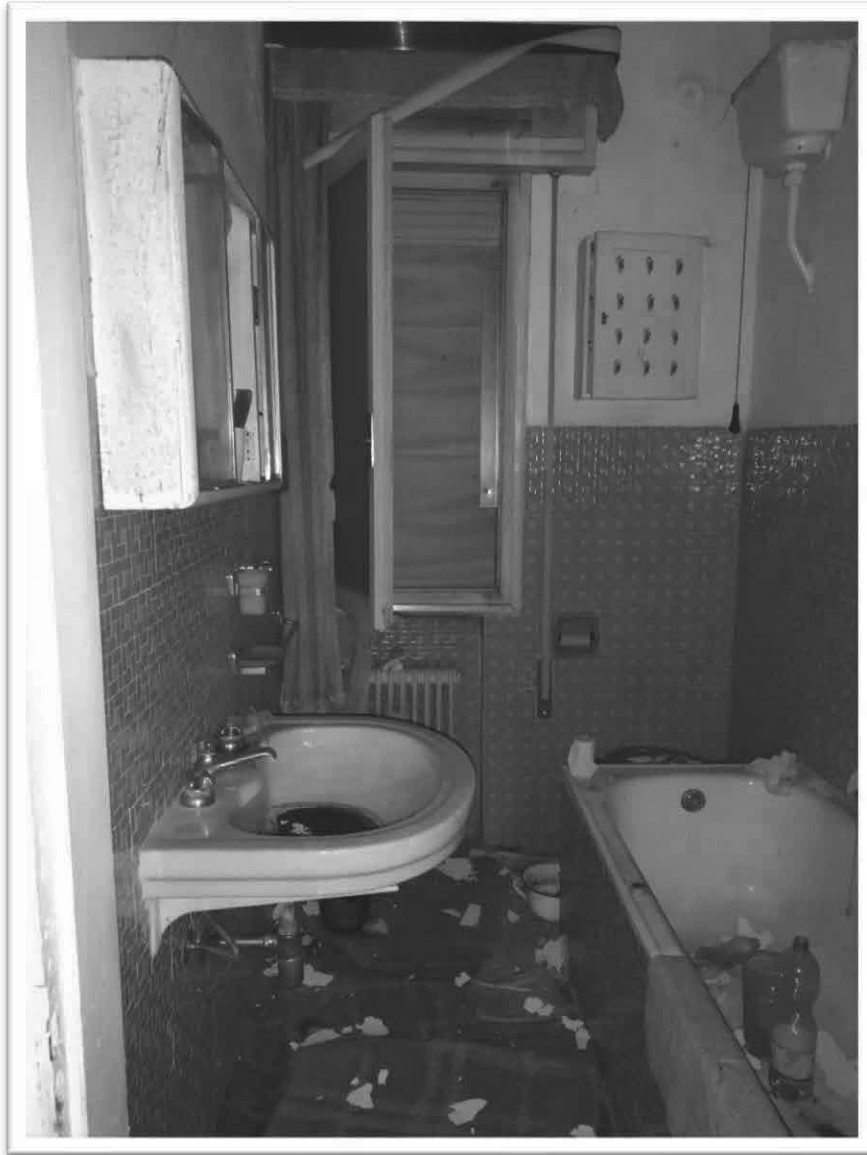
Figura 14 - Bagno