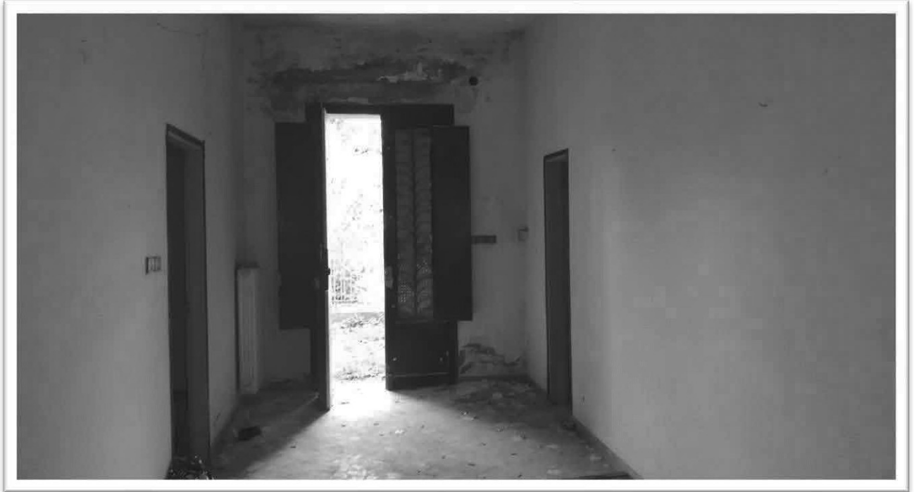
Figura 3 – Ingresso