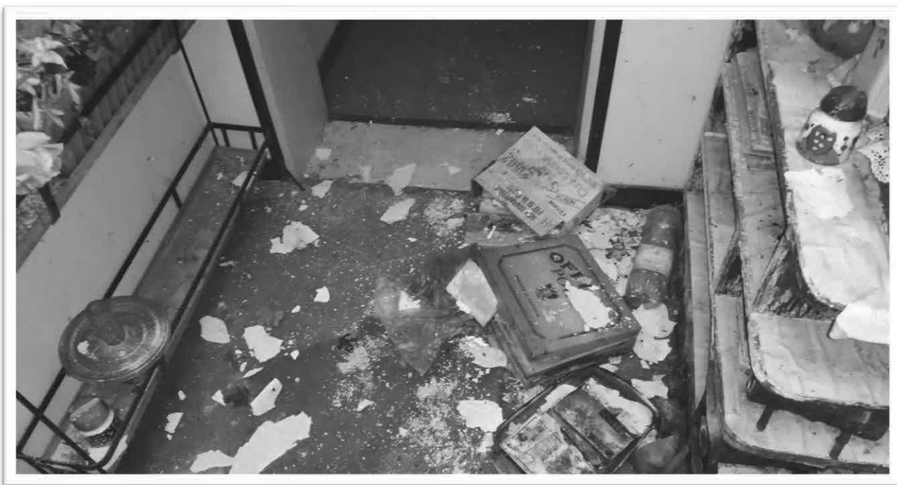
Figura 10 - Disimpegno