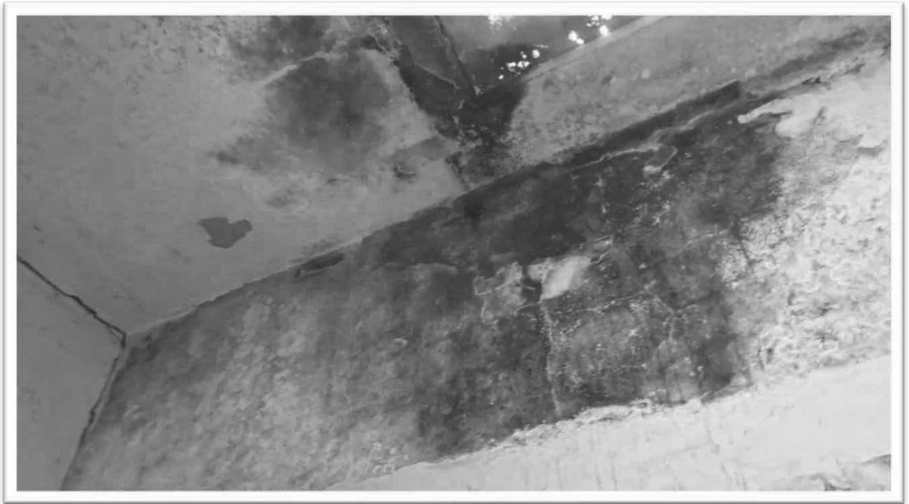
Figura 11 – Soffitto disimpegno