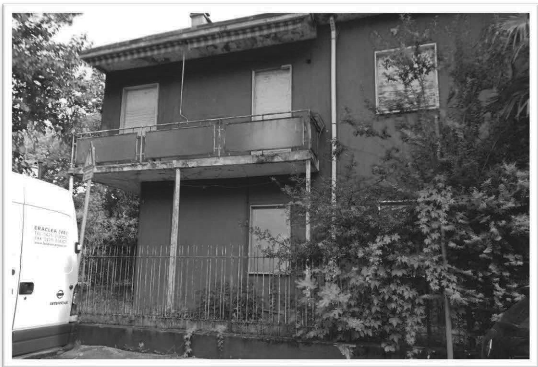
Figura 2 - Veduta intero compendio