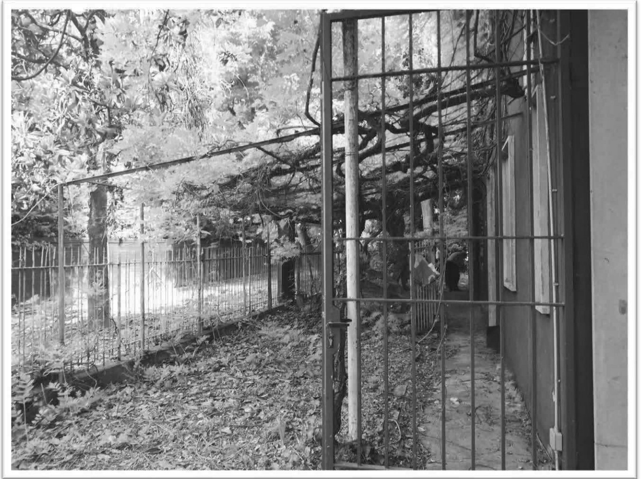
Figura 20 - Scoperto comune