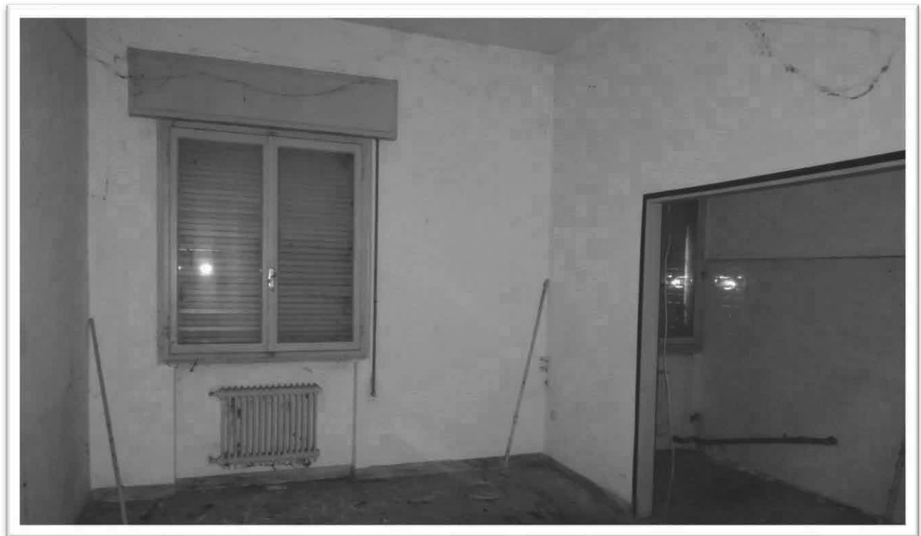
Figura 4 - Soggiorno con angolo cottura