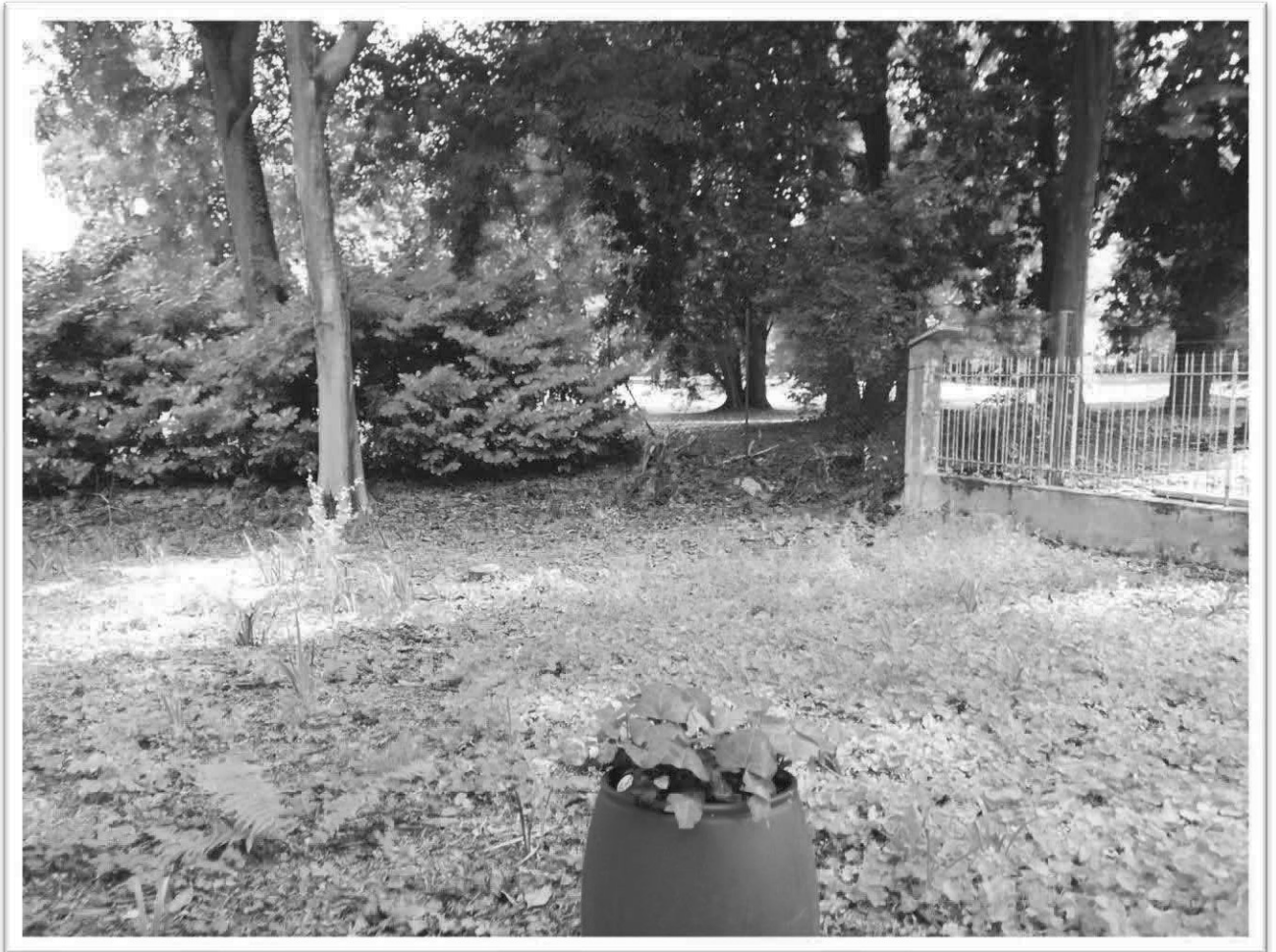
Figura 22 - Scoperto comune