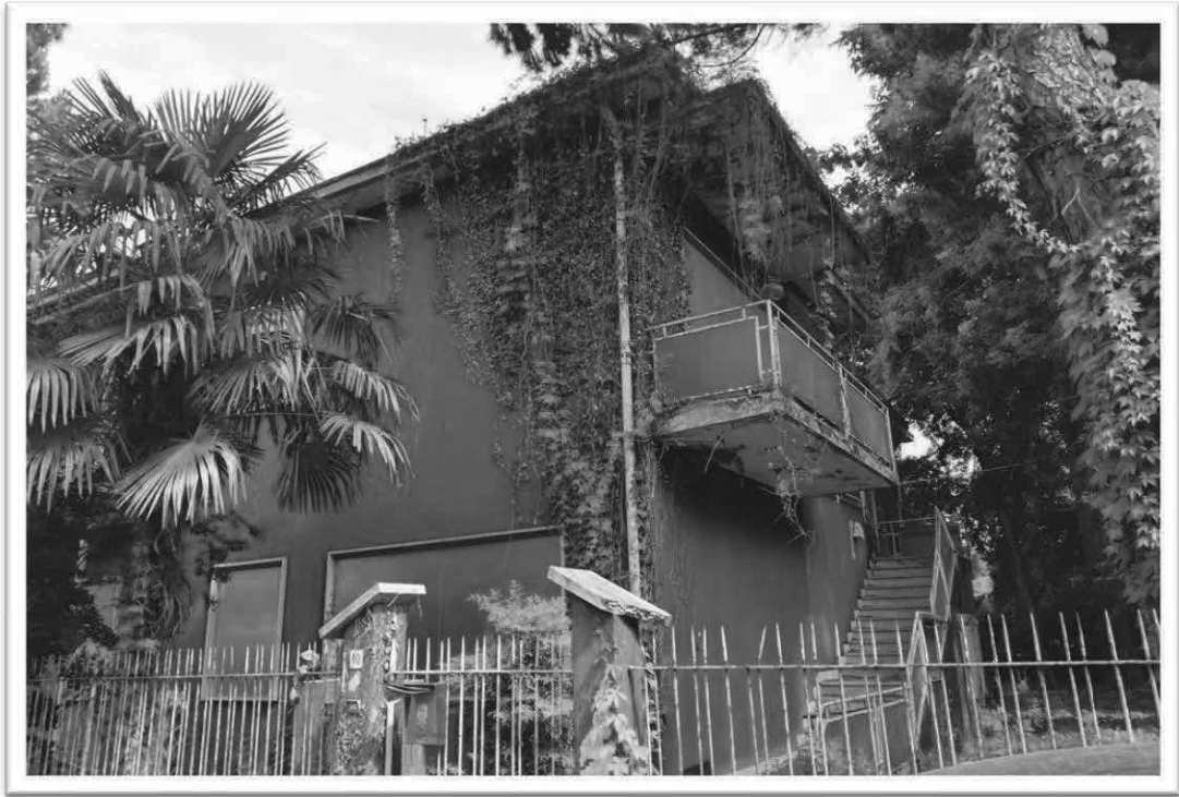
Figura 1 - Veduta intero compendio