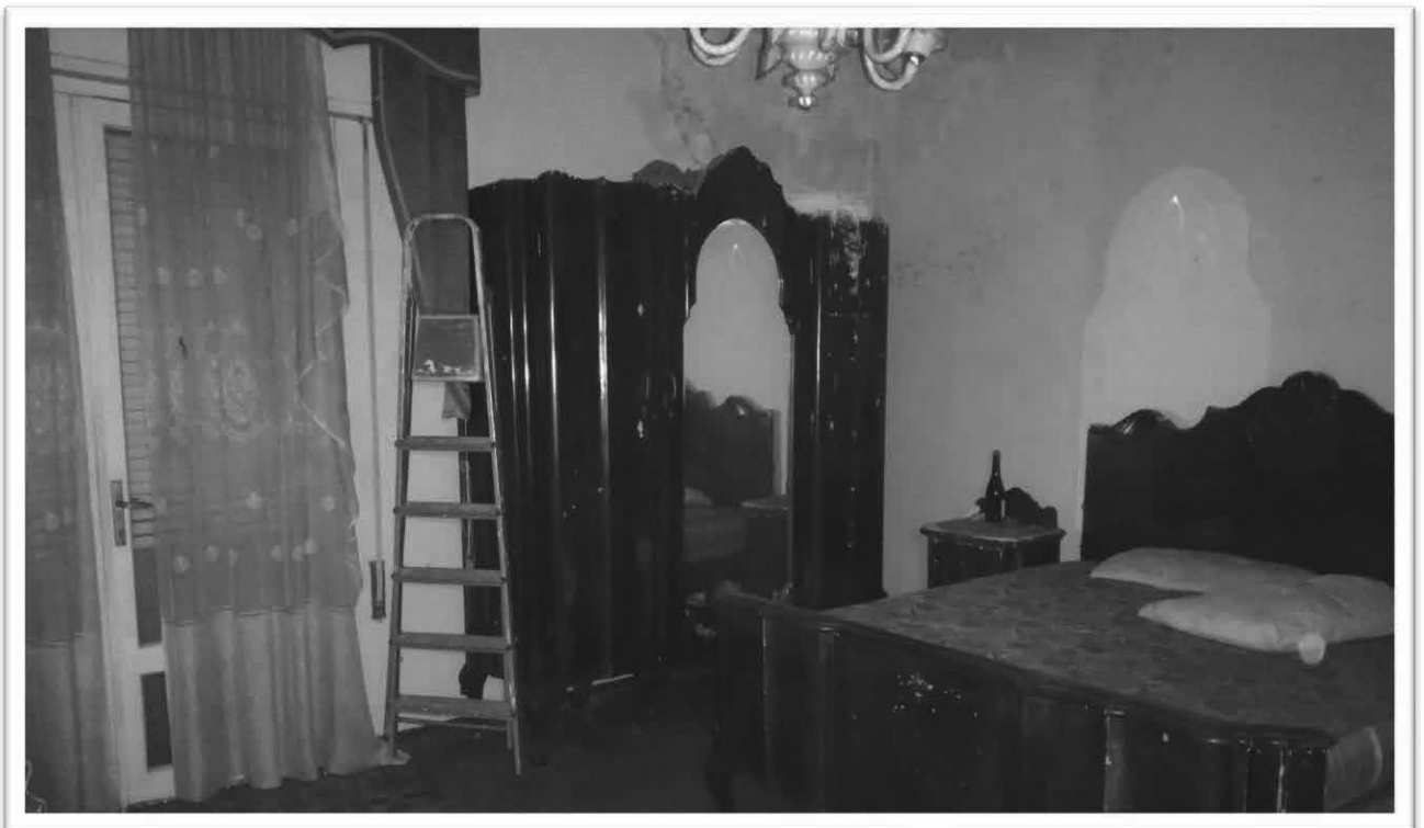
Figura 16 – Camera