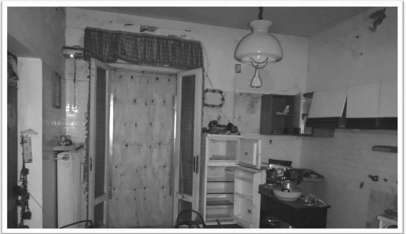
Figura 17 – Cucina