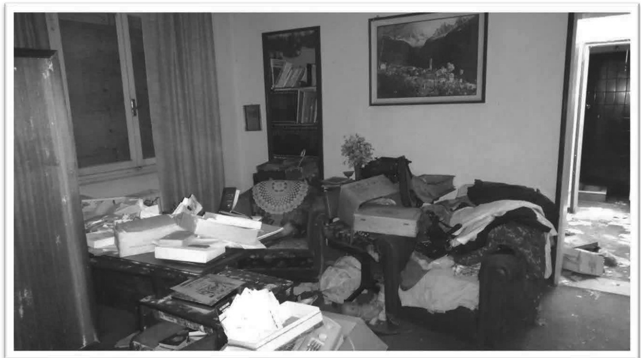
Figura 12 - Stanza studio