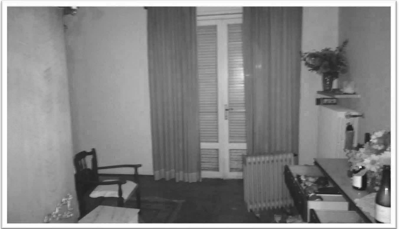
Figura 15 – Camera