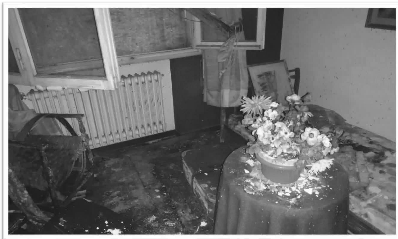
Figura 9 - Soggiorno