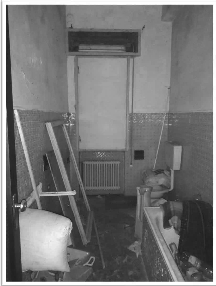
Figura 8 - Bagno