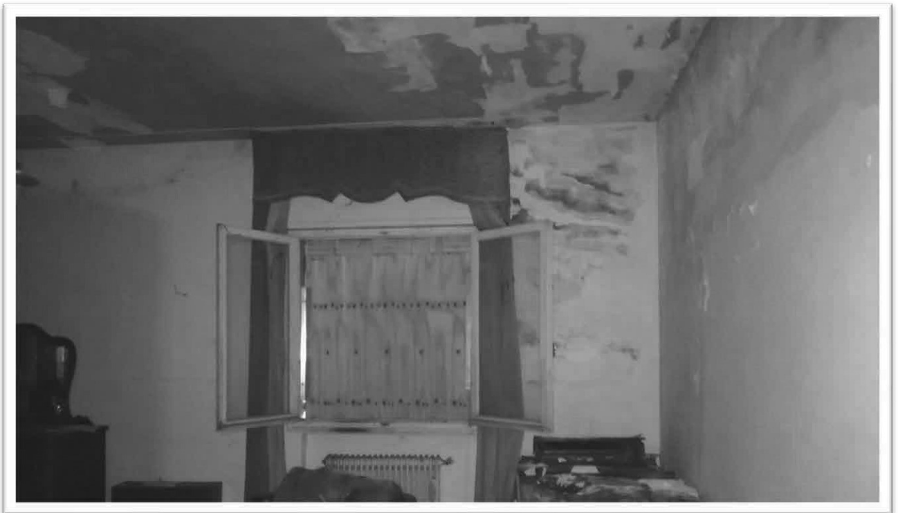
Figura 18 – Soggiorno