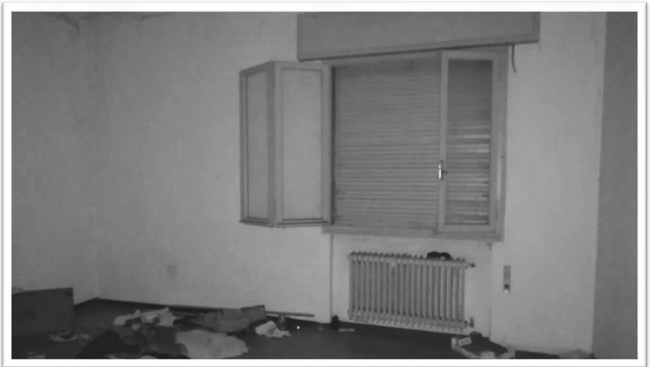
Figura 7 – Camera