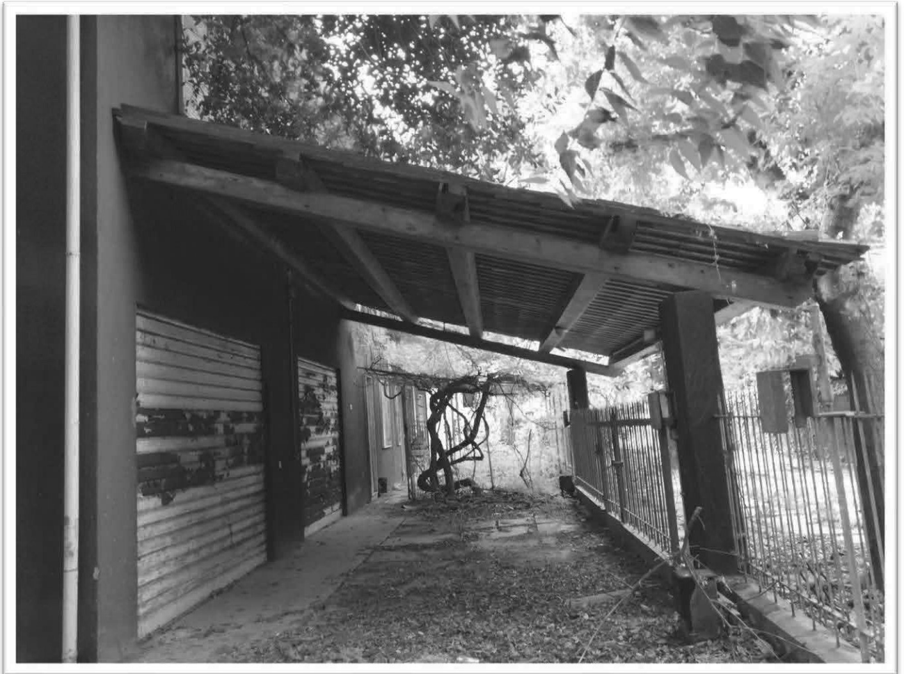
Figura 23 - Scoperto e tettoia comune

L'Esperto alla stima Arch. Marika Barozzi