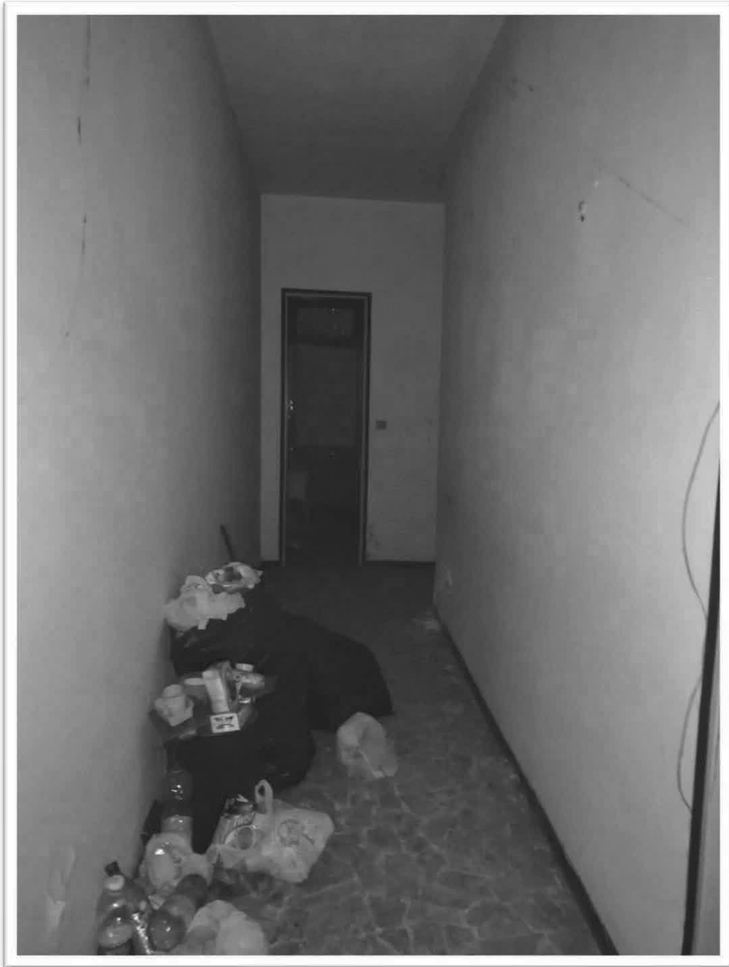
Figura 5 – Corridoio