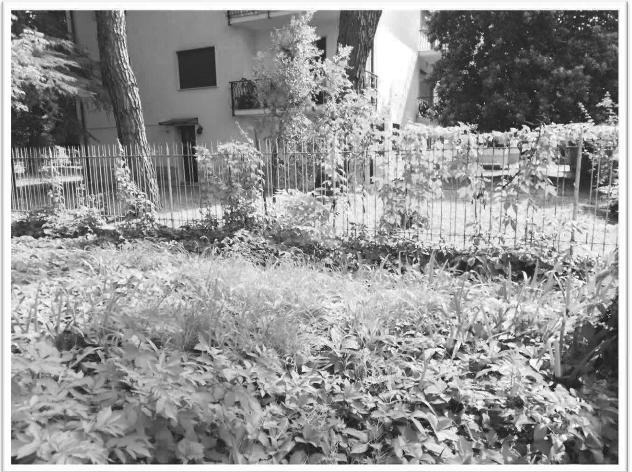
Figura 21 - Scoperto comune