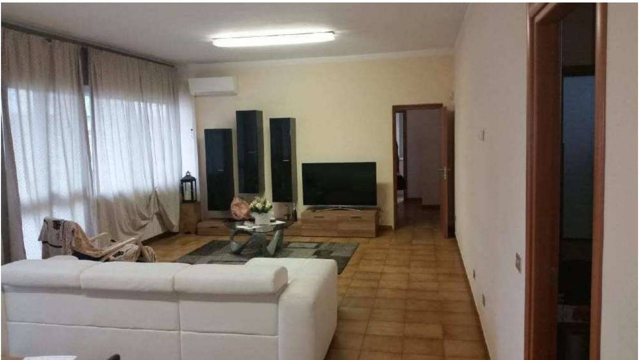
Piano primo – Il secondo ufficio allestito con mobili da soggiorno e angolo cottura