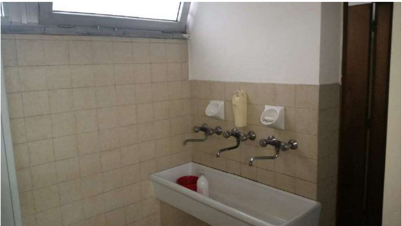
Piano terra – I bagni e spogliatoi dipendenti uomini