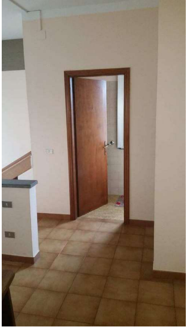
Piano primo – La scala n.1 di accesso al piano primo e pianerottolo di sbarco