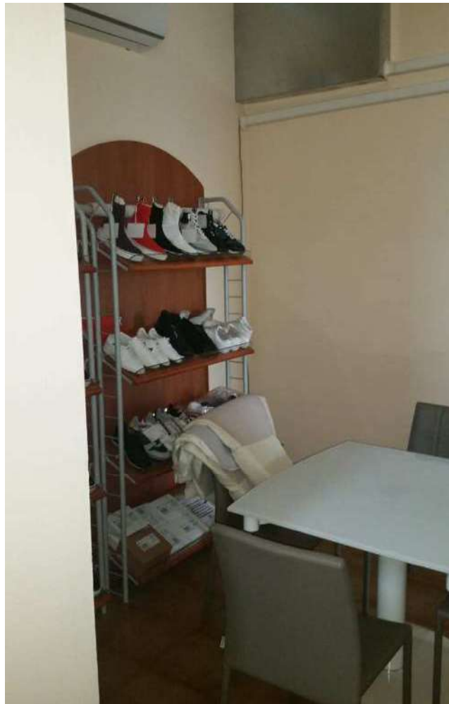
Piano terra – L'ufficio