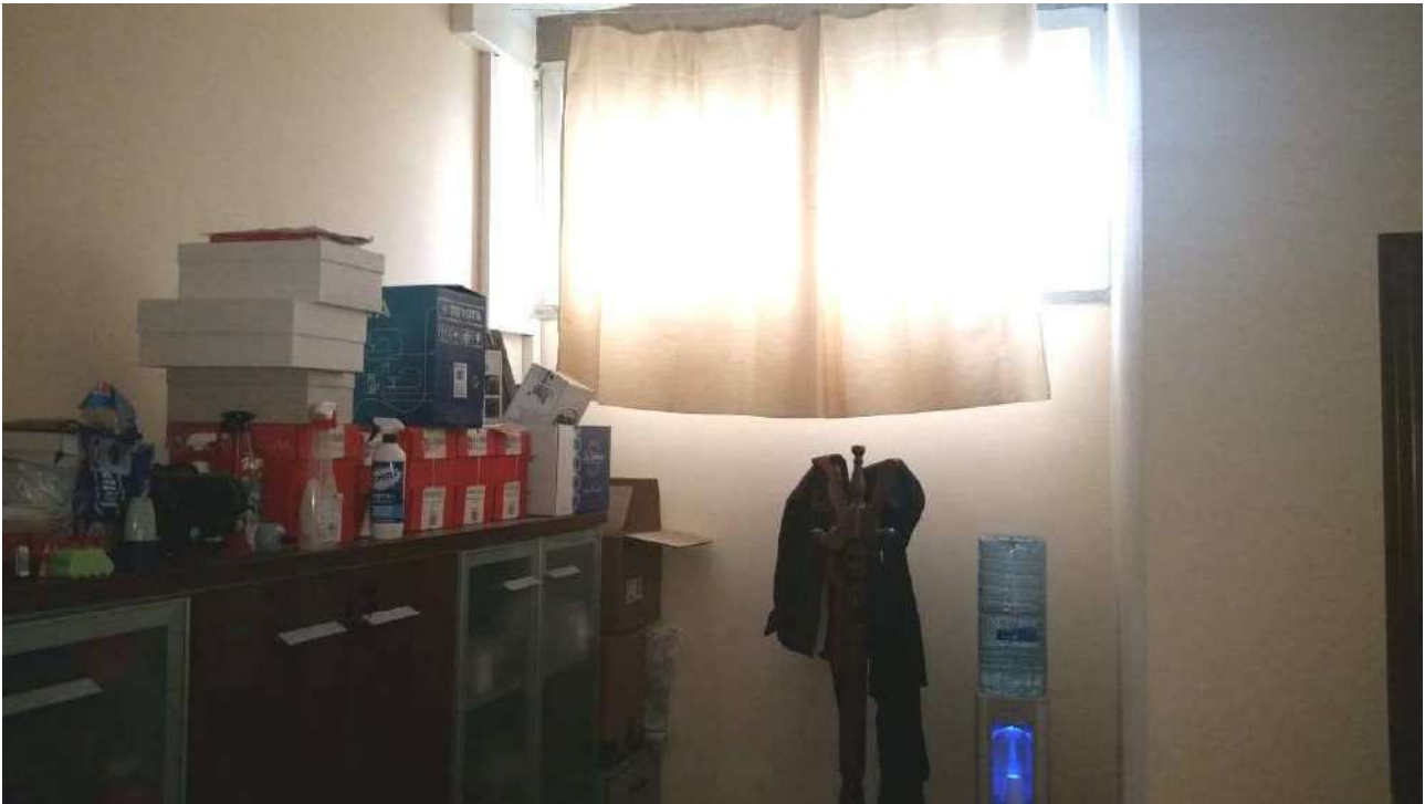
Piano terra – L'ufficio