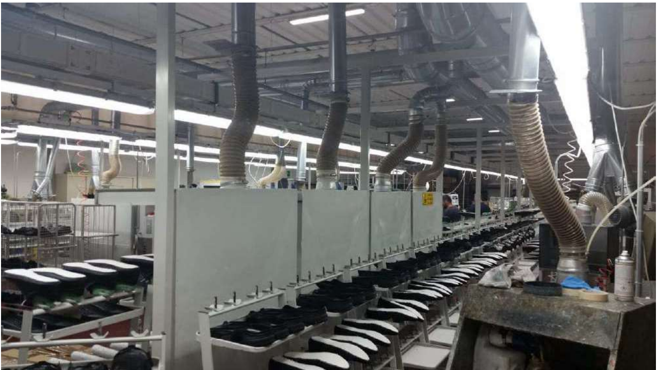
Piano terra – Il laboratorio