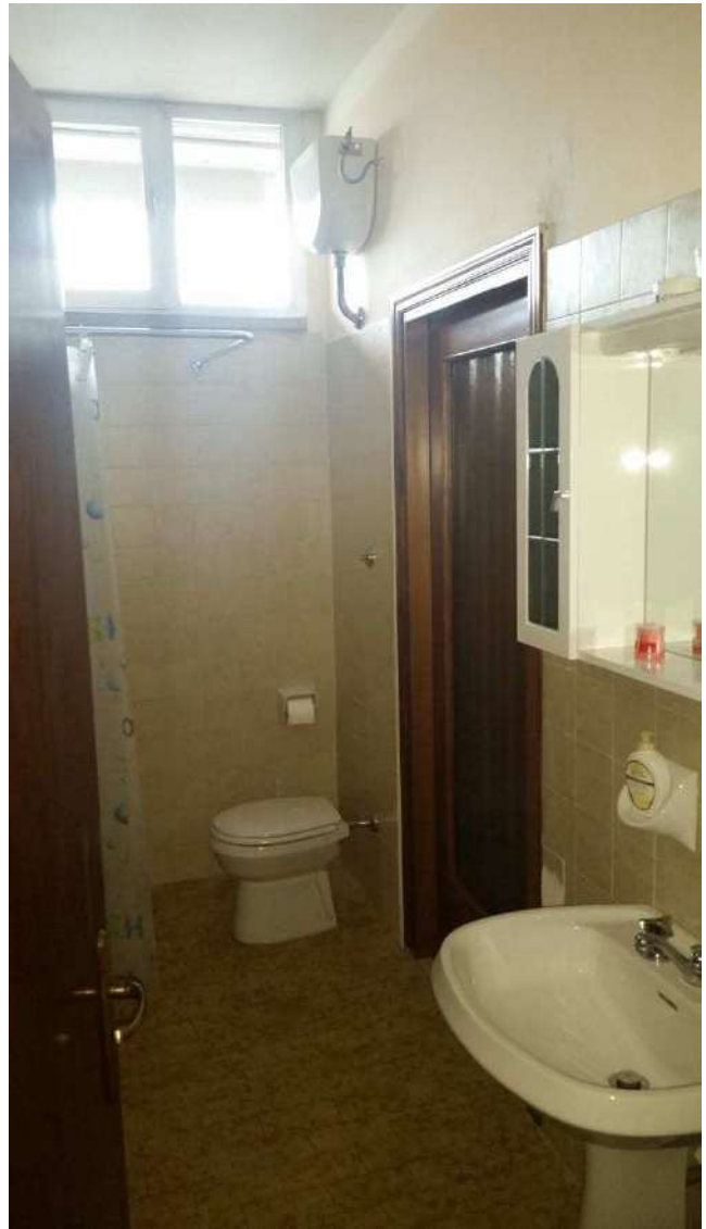
Piano primo – L'archivio allestito con letto matrimoniale e locale bagno-doccia per spogliatoio donne