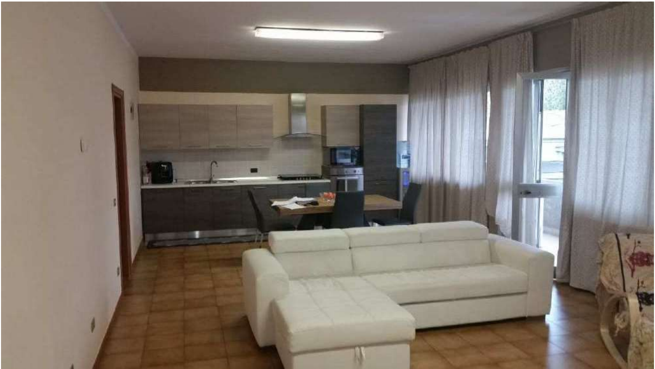
Piano primo – Il secondo ufficio allestito con mobili da soggiorno e angolo cottura