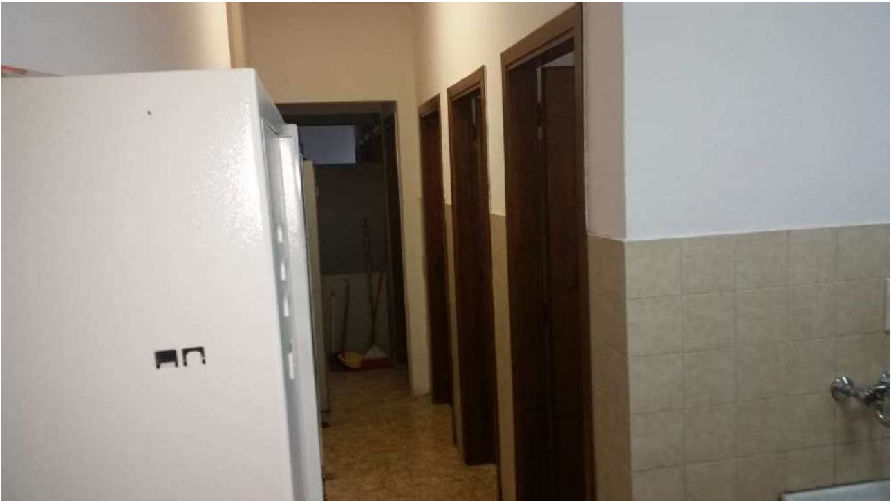
Piano terra – I bagni e spogliatoi dipendenti uomini