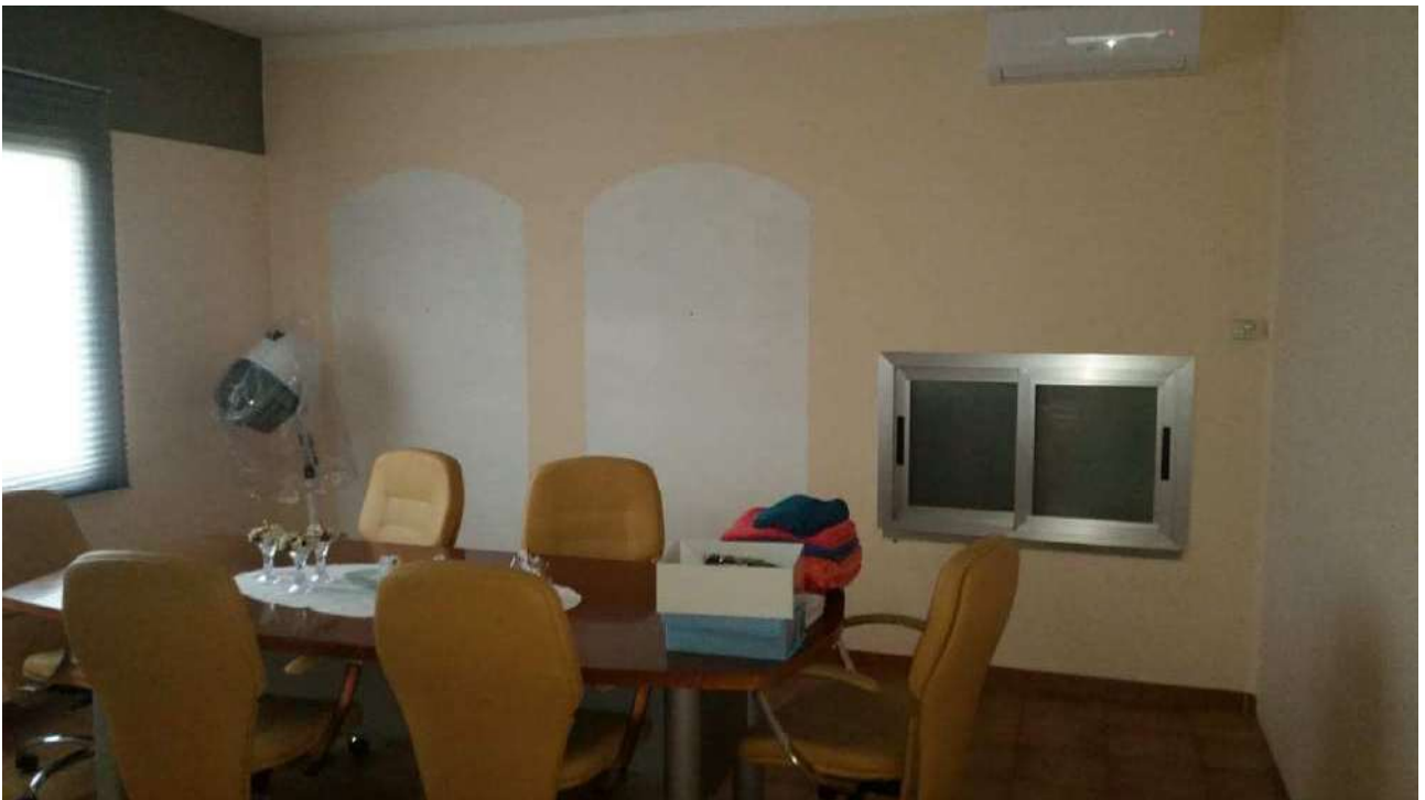
Piano primo – Il primo ufficio