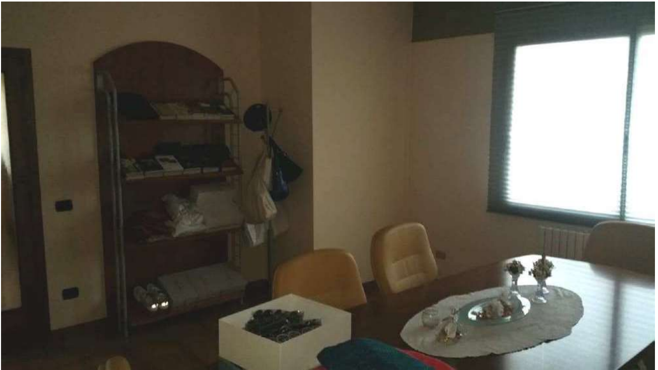
Piano primo – Il primo ufficio