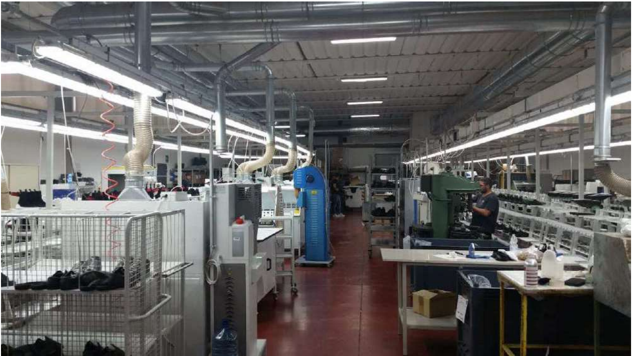
Piano terra – Il laboratorio