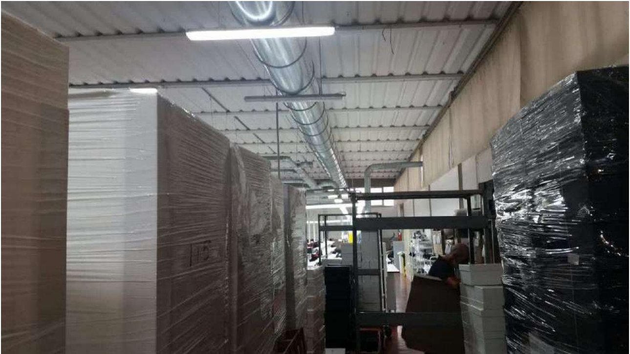
Piano terra – Il laboratorio