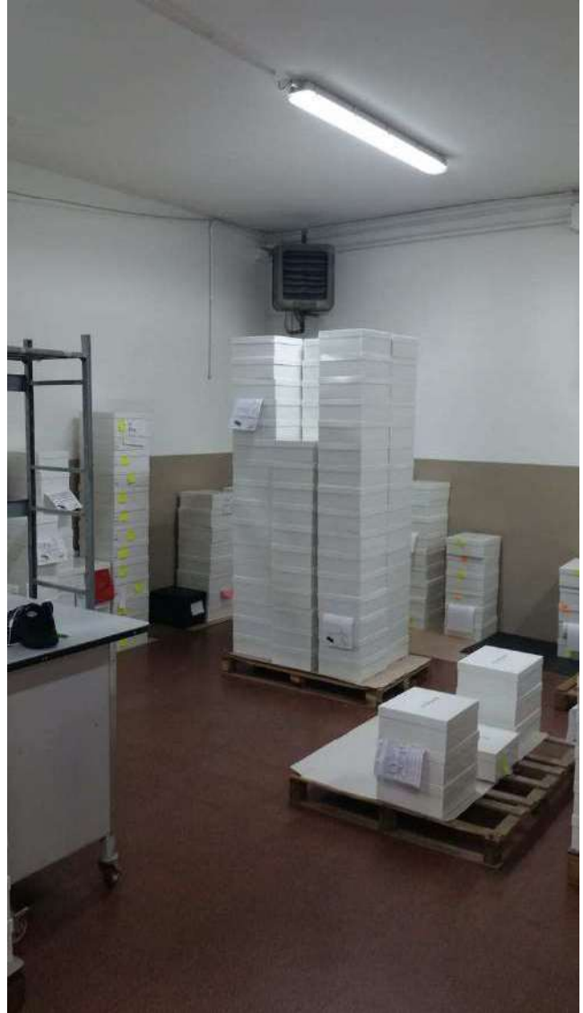
Piano terra – Il magazzino