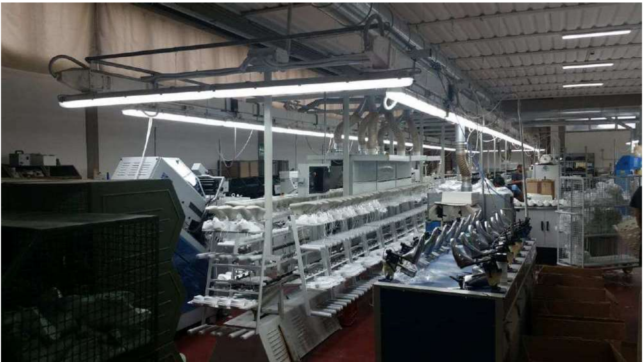
Piano terra – Il laboratorio