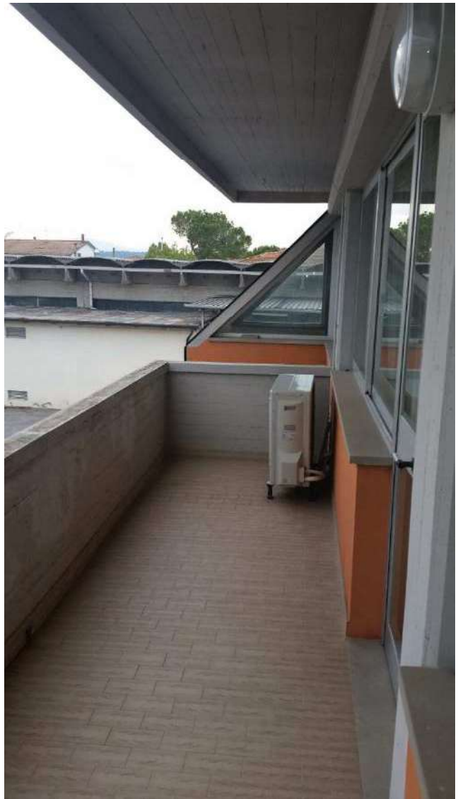
Piano primo – Il terrazzo perimetrale