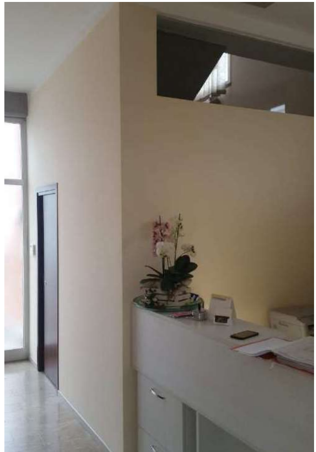
Piano terra – L'ingresso con desk accoglienza clienti