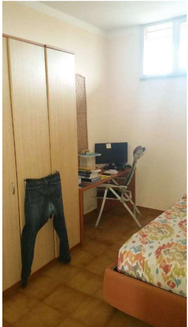
Piano primo – Lo spogliatoio donne allestito con letto singolo