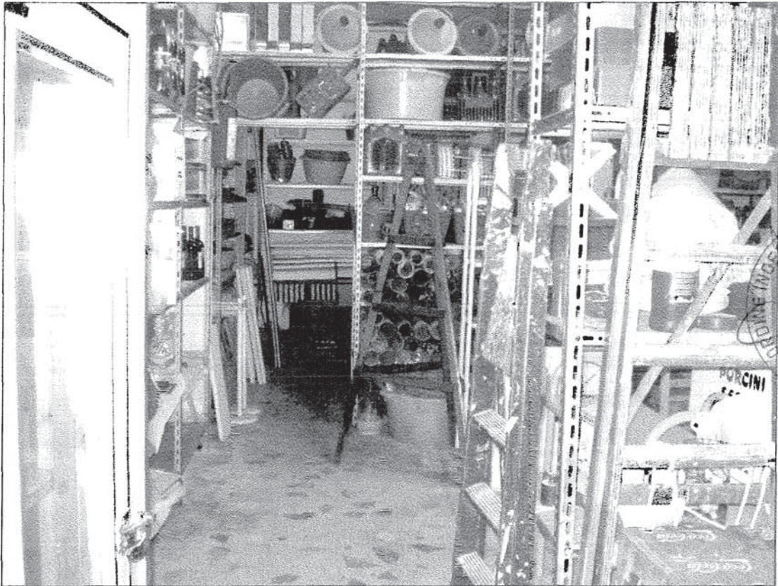
Foto 9 Vista interna dei magazzini di altezza 3,5 m compresi nel lotto n. 4