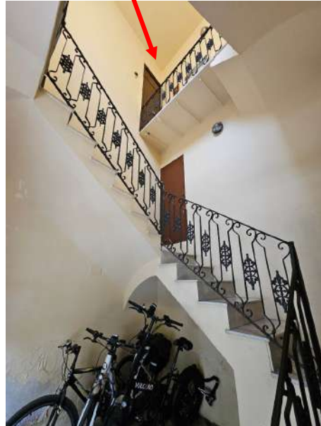
Androne comune e vista della scala di collegamento, con la freccia è indicato l'ingresso all'immobile