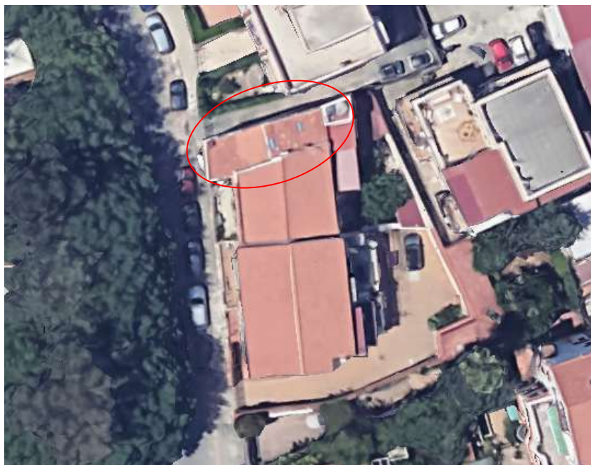
Ortofoto attuale