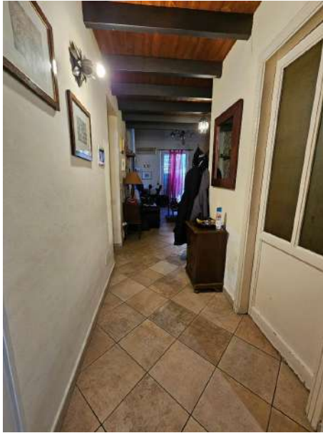
Vista dall'ingresso verso la sala da pranzo entrando a destra, e verso il soggiorno, a sinistra