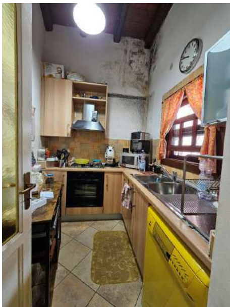
Cucina e terrazza coperta