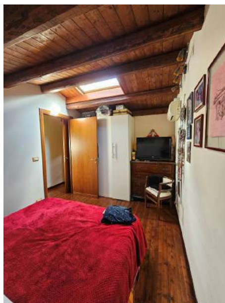
Scala verso il soppalco. Salendo a destra la prima camera da letto