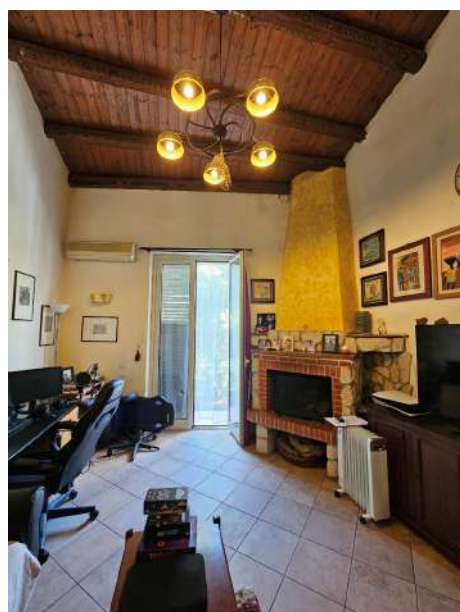
Ambiente soggiorno con camino e soppalco verso le camere da letto