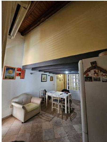
Vista della zona pranzo. L'altezza utile è pari a c.ca 2,20m per via del sovrastante soppalco dove si trovano le camere da letto