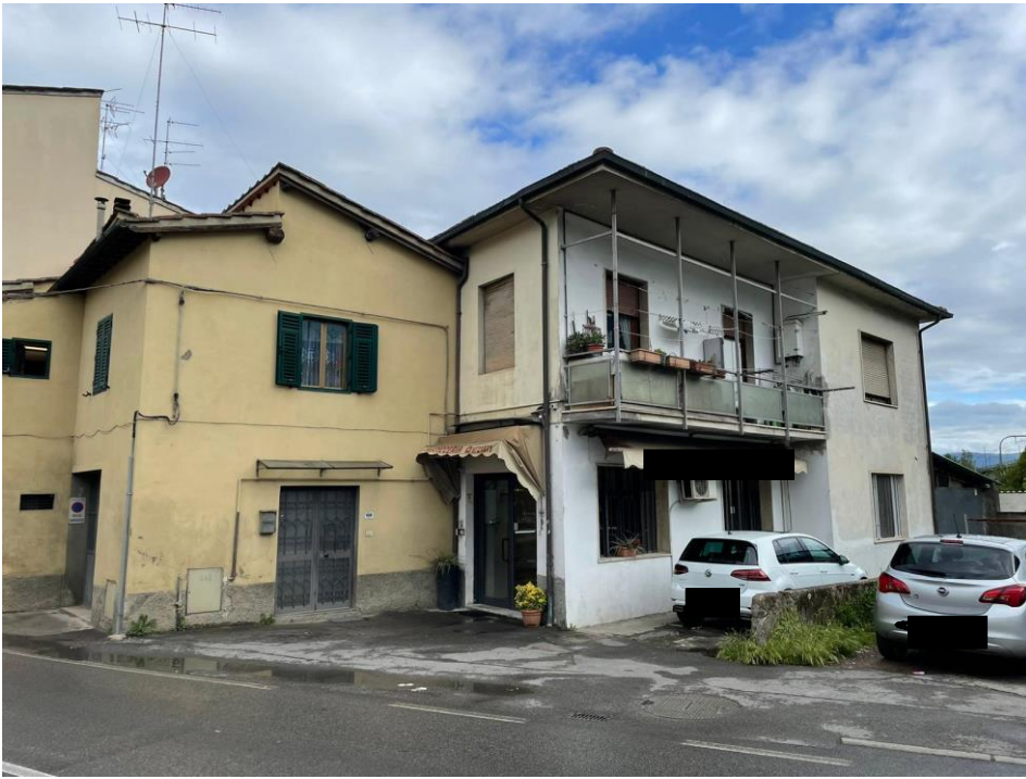
FOTO N. 1 VISTA DEL FABBRICATO E DELLA PORTA DI INGRESSO A PIANO TERRA;