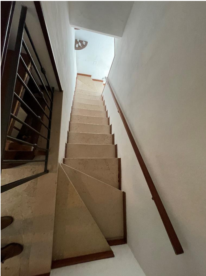
FOTO N. 4 VANO SCALA