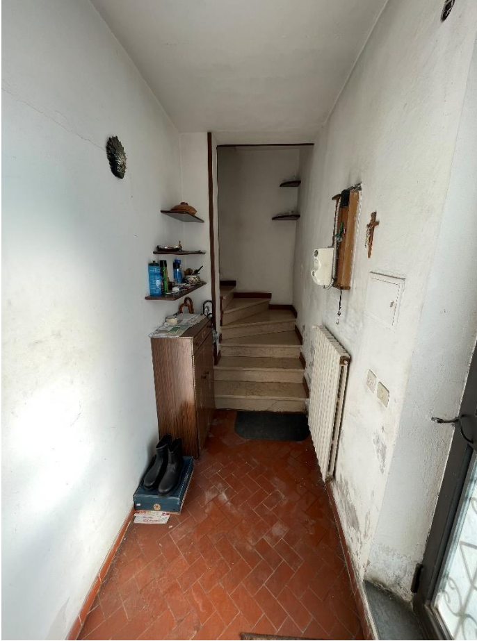
FOTO N. 3 INGRESSO DA PIANO TERRA