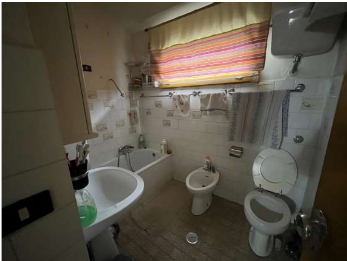
Fig.20– Vista vano bagno del sub.2 con affaccio sul fronte sud