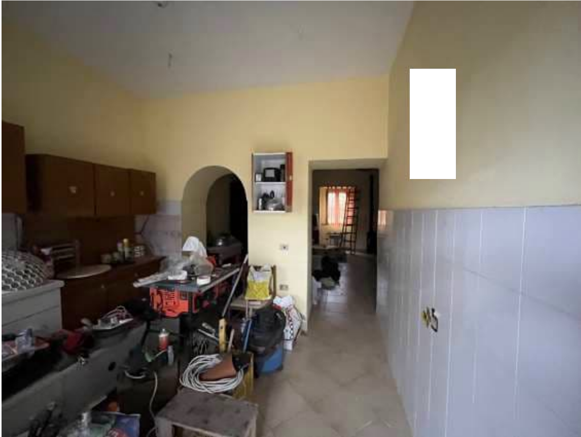
Fig.24– Vista interna del sub.3, ambiente adibito ad ingresso e cucina