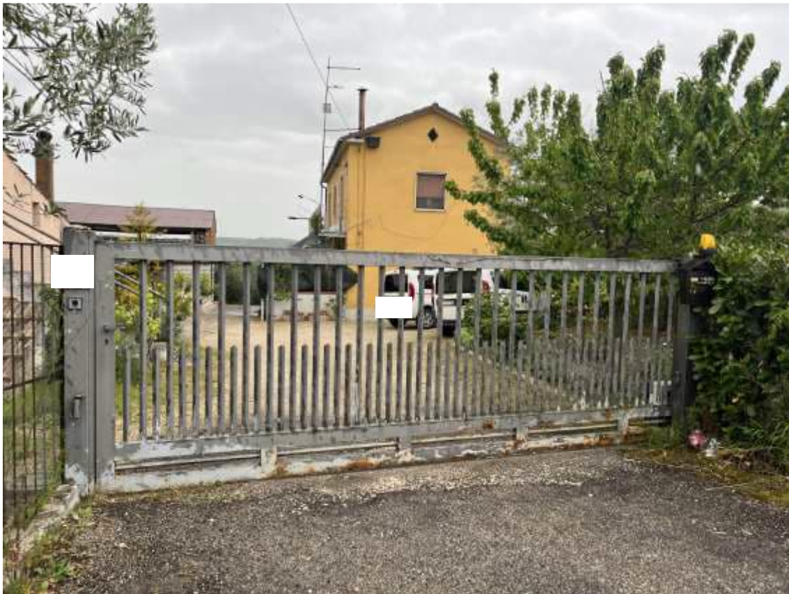
Fig.2 – Vista su cancello d’ingresso alla p.IIa 694 da Contrada Torre Monte al civico n. 5