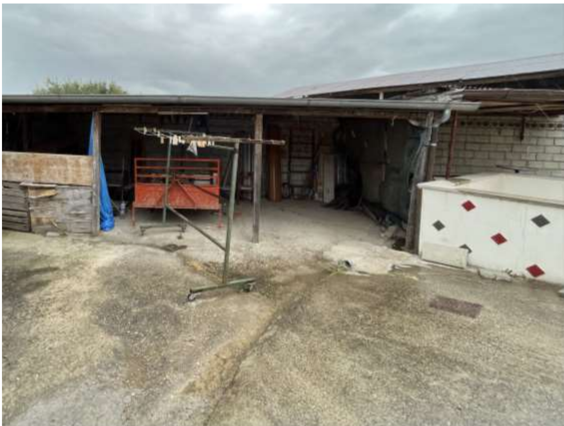
Fig.5 – Vista della pensilina per il ricovero attrezzi