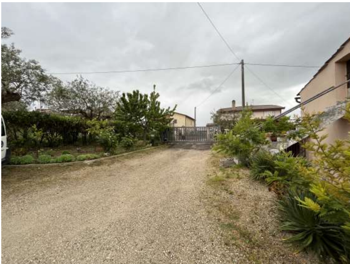
Fig.3 – Vista dello spazio pertinenziale verso cancello d’ingresso