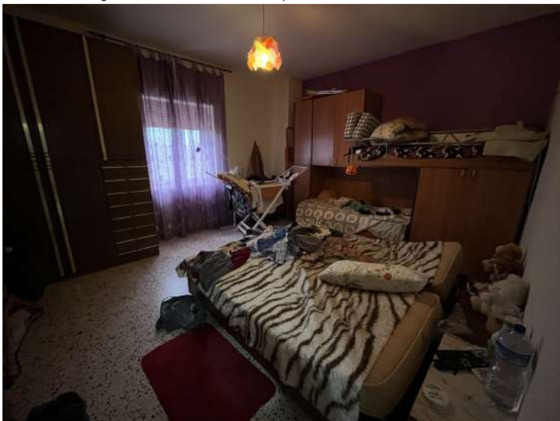
Fig.19 – Vista vano camera da letto posto sul fronte est del sub.2 - P1