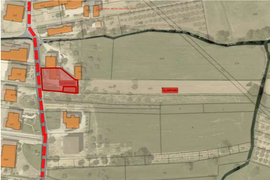
Fig.9 – Vista degli Immobili con individuazione dell’asse viario di Contrada Torre Monte

2.1 Lotto Unico – Fabbricato per civile abitazione di tipo popolare, con annessa corte, della complessiva consistenza catastale di vani 5 su due livelli, riportato al N.C.E.U. del Comune di Paduli (BN) al Fig. 30, p.lla 694 sub.2, Contrada Torre Monte s.n.c., piano T-1, categoria A/4.