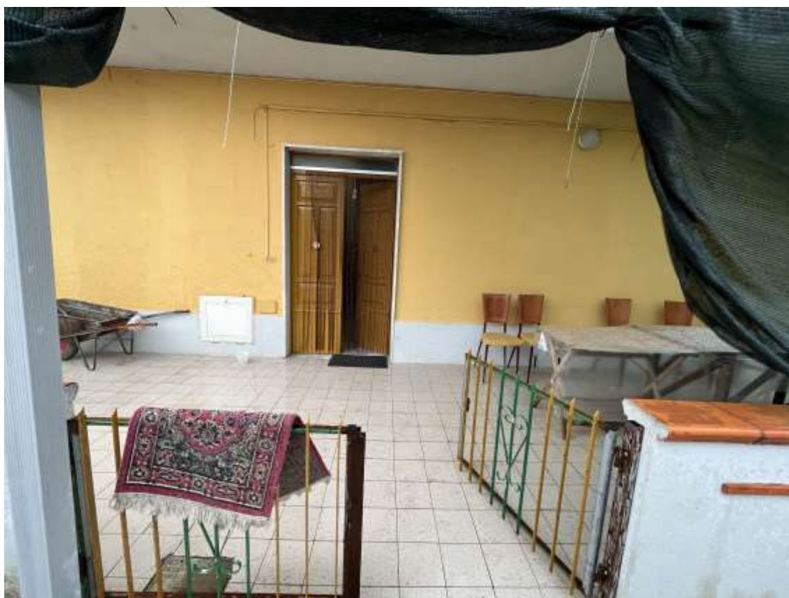
Fig.12 – Vista portone d'ingresso del sub.2