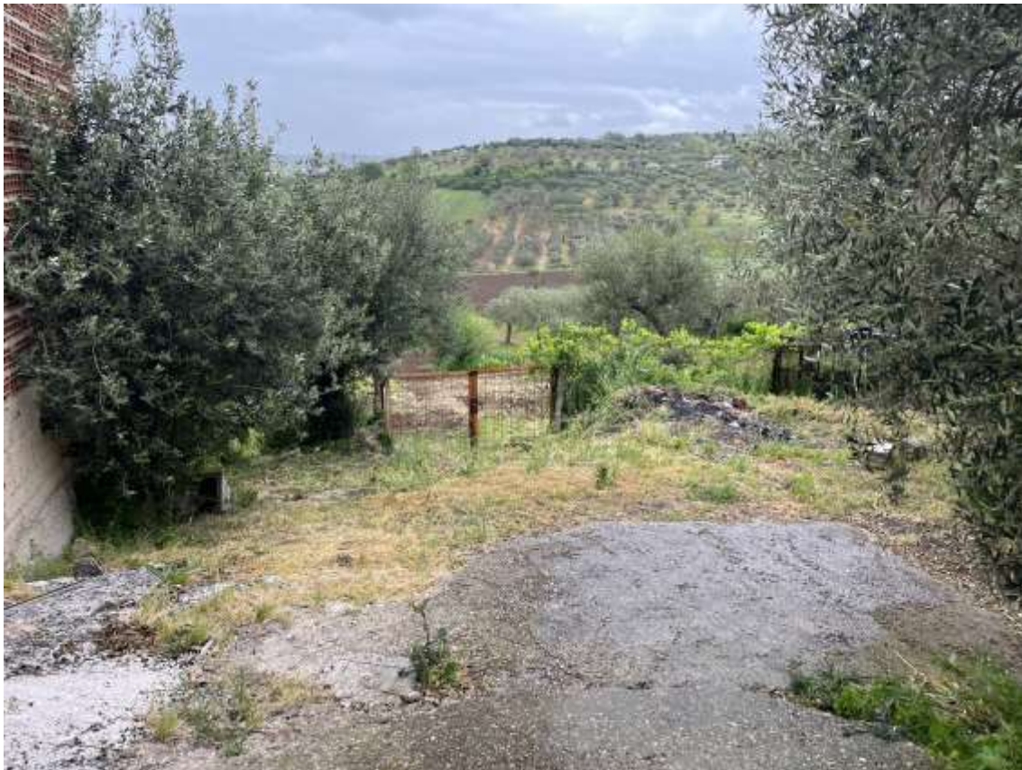
Fig.30– Vista da p.lla 694 (ovest verso est) della p.lla 693