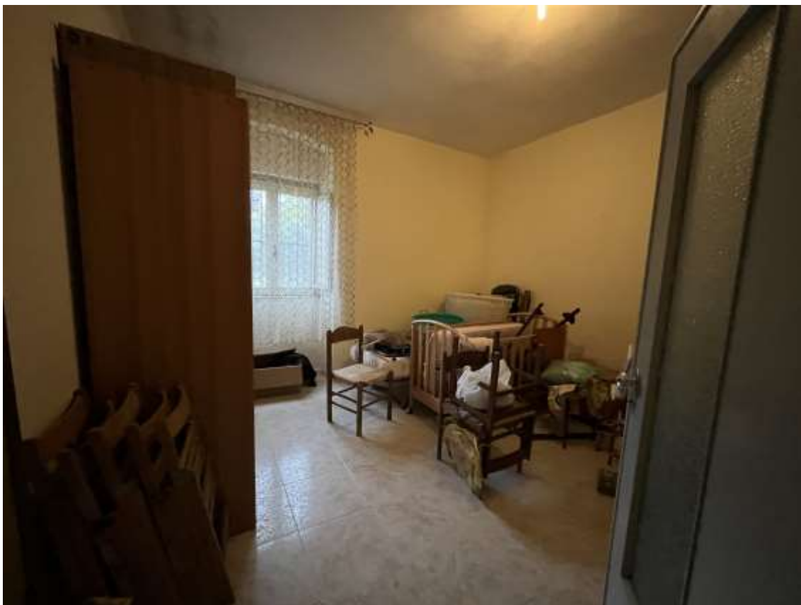
Fig.26 - Vista del sub.3, vano adibito a camera con affaccio su Contrada Torre Monte)