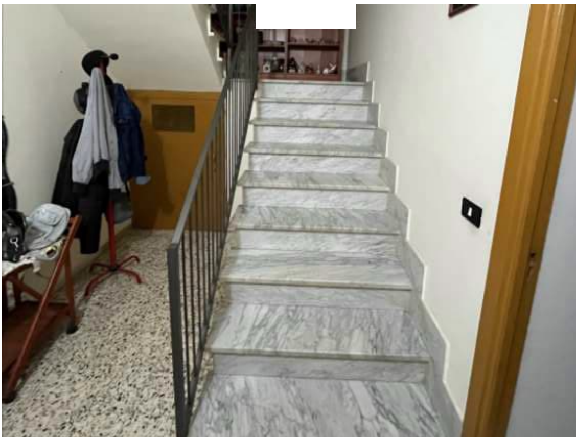
Fig.13 – Vista ingresso/vano scala del sub.2