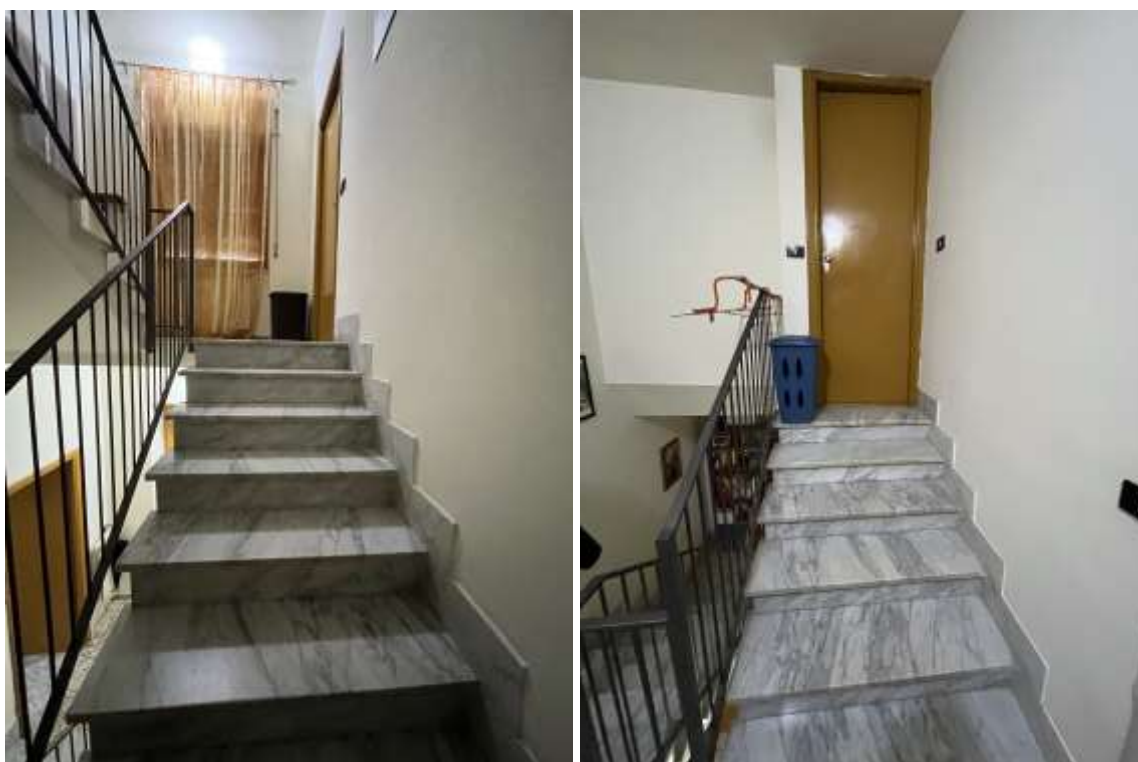
Fig.16-17 – Vista vano scala del sub.2 verso il piano primo e porta di accesso al bagno