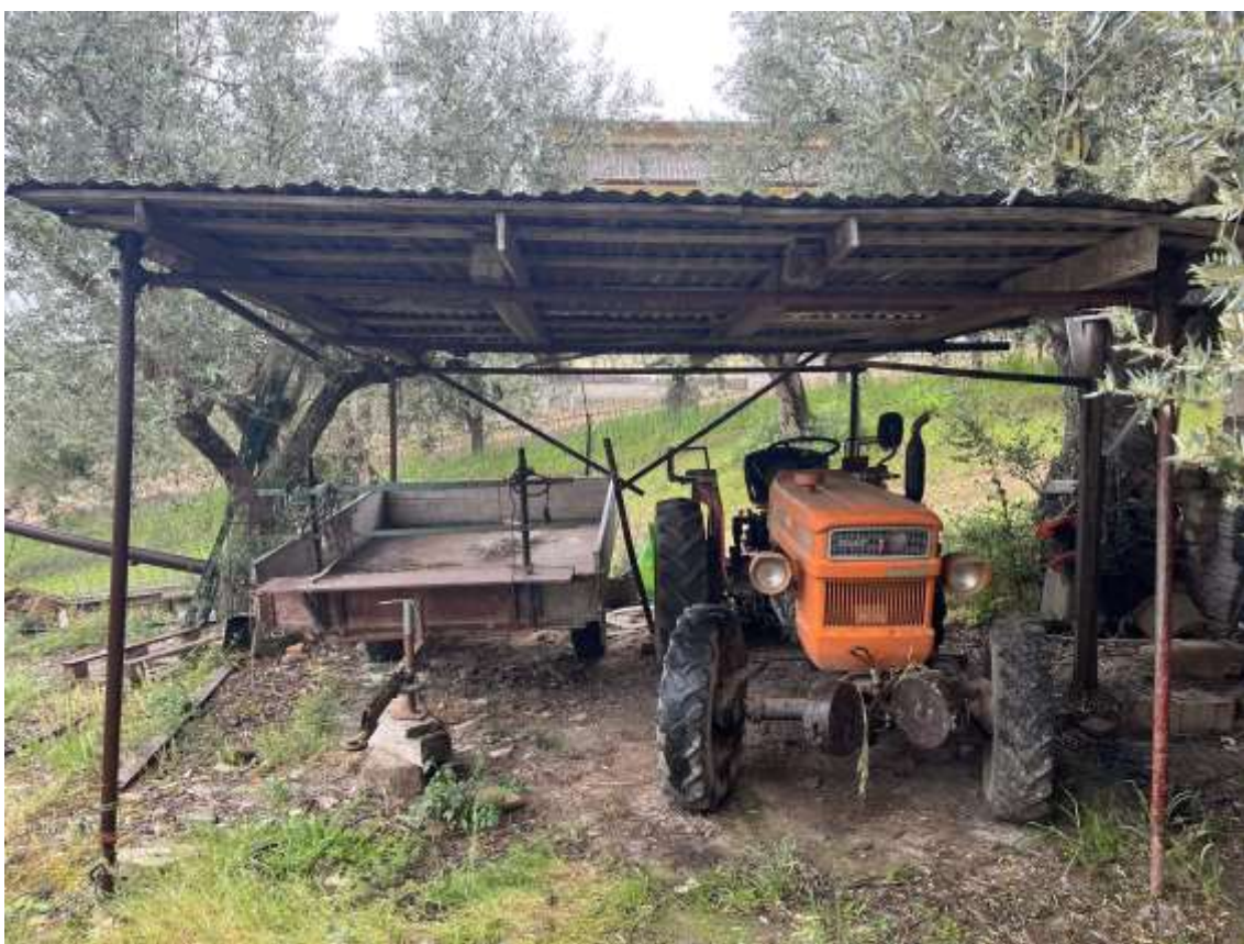
Fig.4 – Vista della pensilina per il ricovero attrezzi