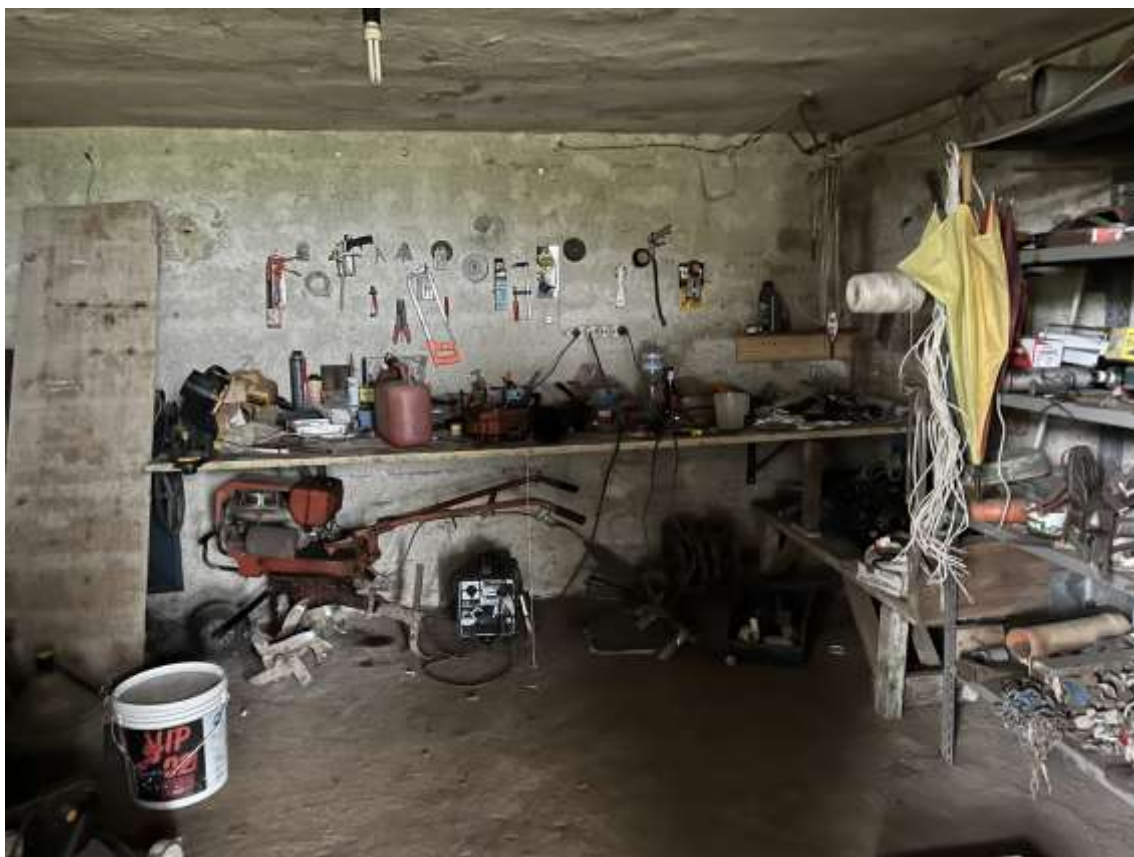
Fig.21– Vista vano deposito del sub.2 posto sotto il vano soggiorno con affaccio sul fronte est – PS1