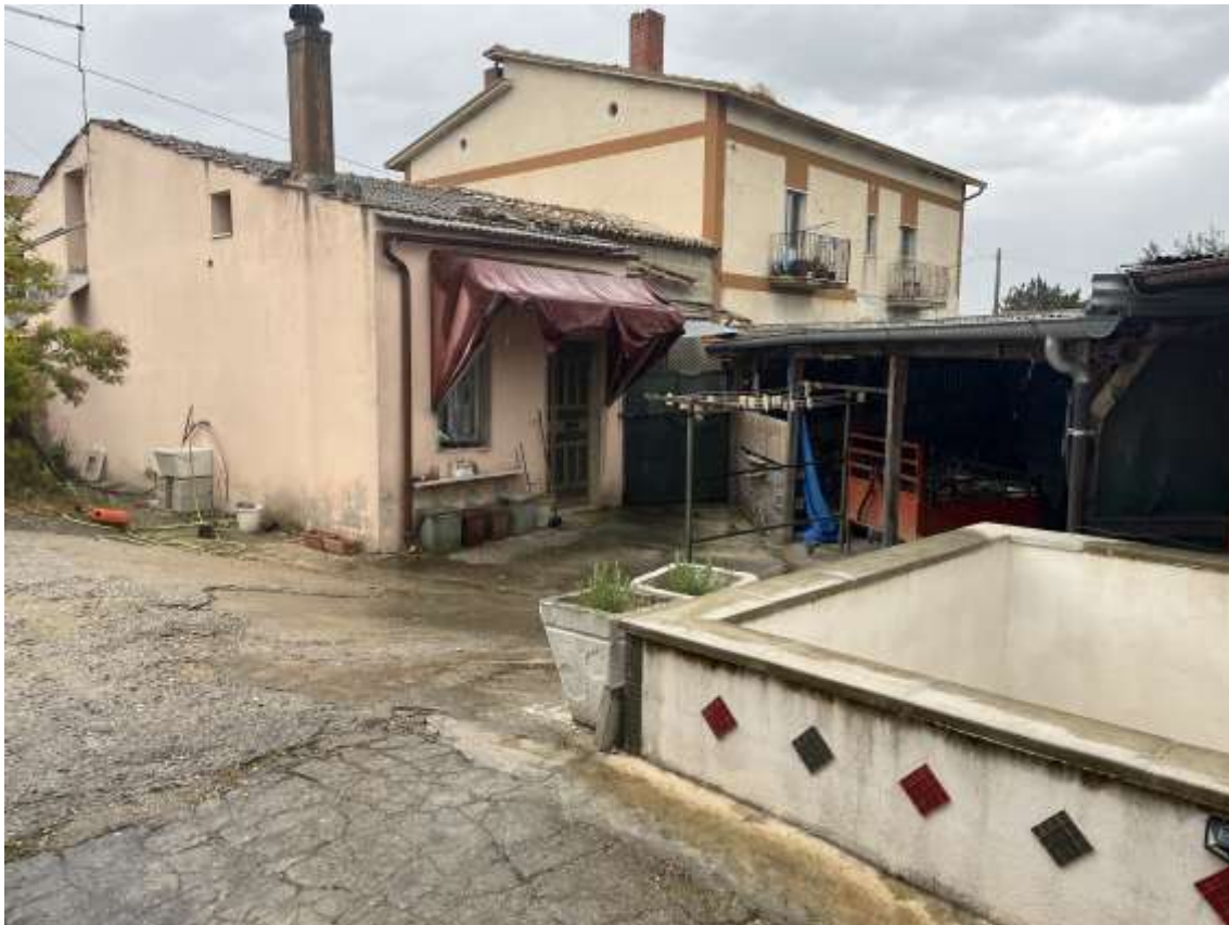
Fig.23 – Vista dall’esterno della p.lla 694 sub.3