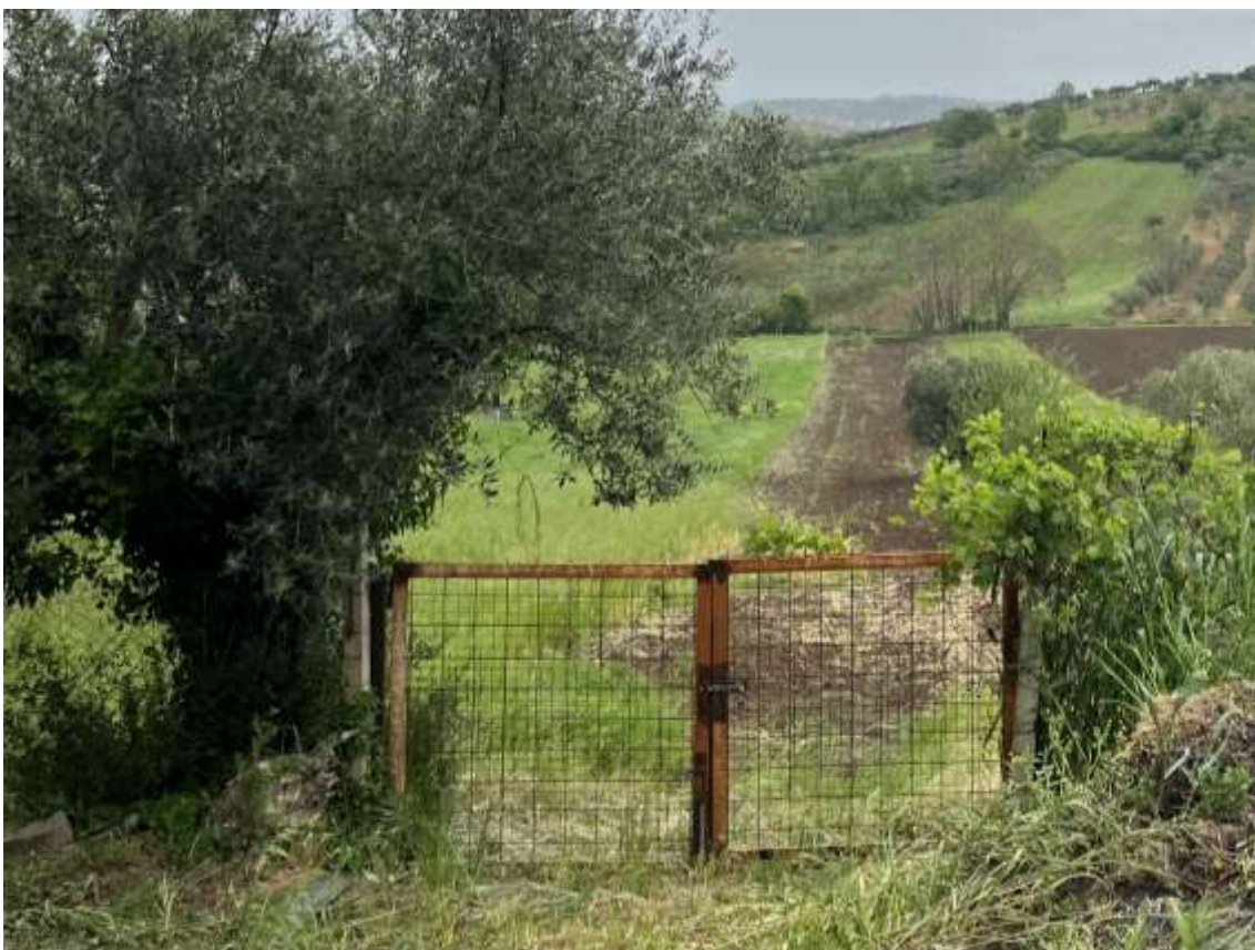
Fig.8 – Vista del cancello di accesso da particella 694 a particella 693