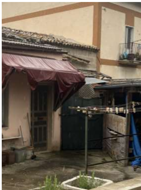
Figg.27-28– Vista del vano adibito a bagno con affaccio su pertinenza e zona di affaccio del bagno (part.694 sub.3)