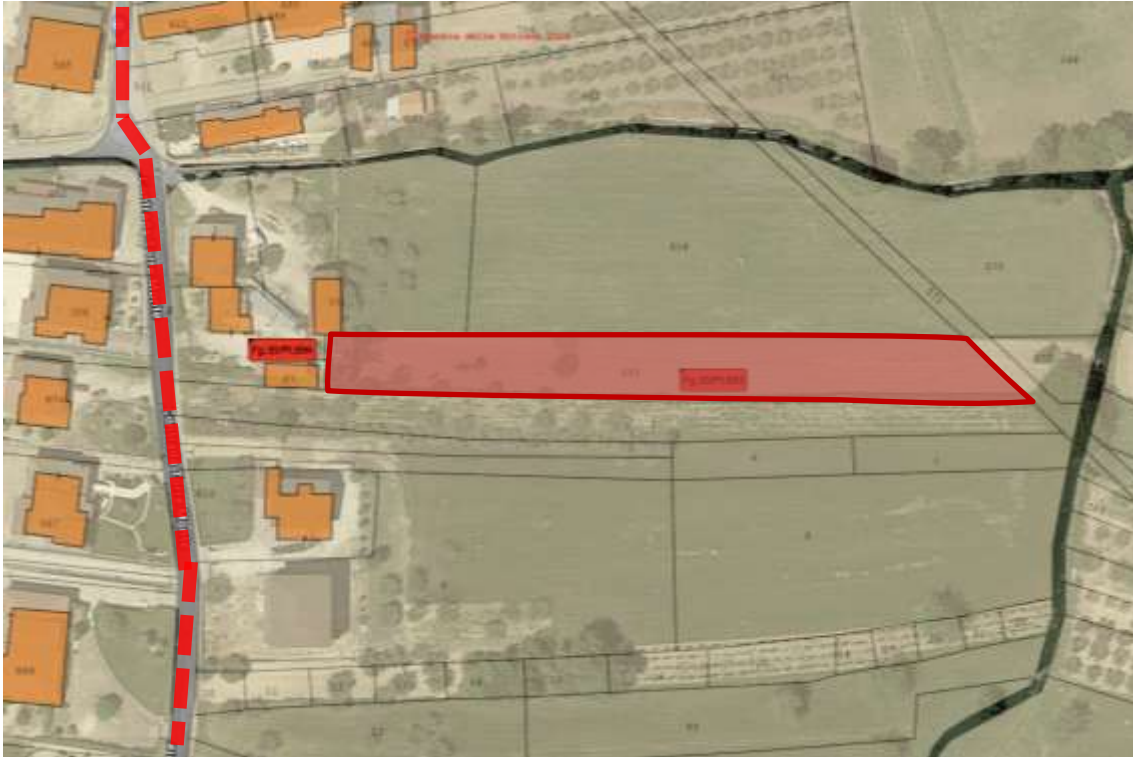
Fig.29– Vista degli Immobili con individuazione dell’asse viario di Contrada Torre Monte (fonte forMaps)

2.3 Lotto Unico – Terreno della superficie catastale di circa mq. 1.776, riportato nel N.C.T. del comune di Paduli (BN) al Fig. 30, p.lla 693, Contrada Torre Monte s.n.c., Uliveto, classe 2, di are 27 e centiare 06 (2.706 mq), R.D. €8,39, R.A. €8,39.