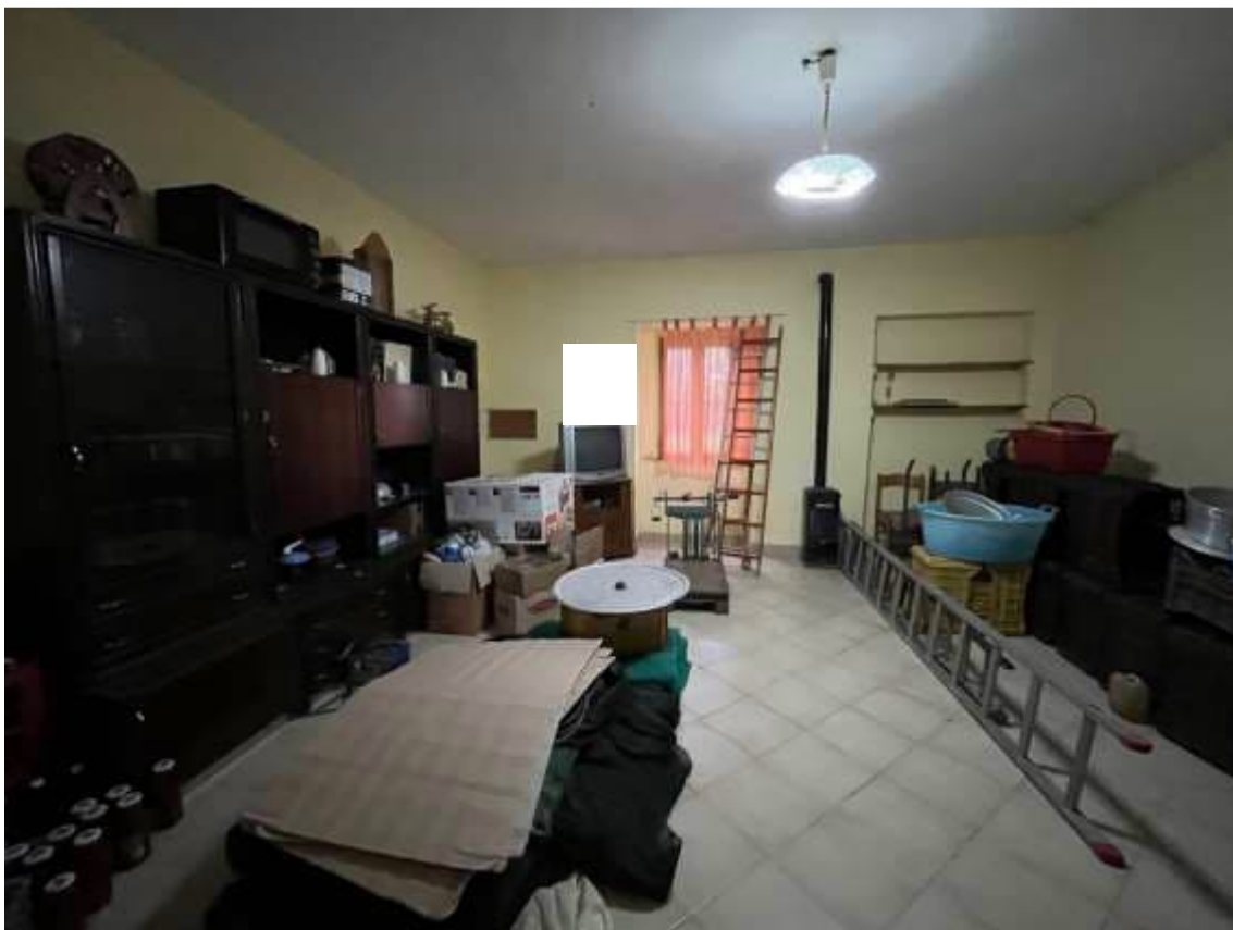
Fig.25– Vista interna del sub.3, ambiente adibito a soggiorno con affaccio su Contrada Torre Monte