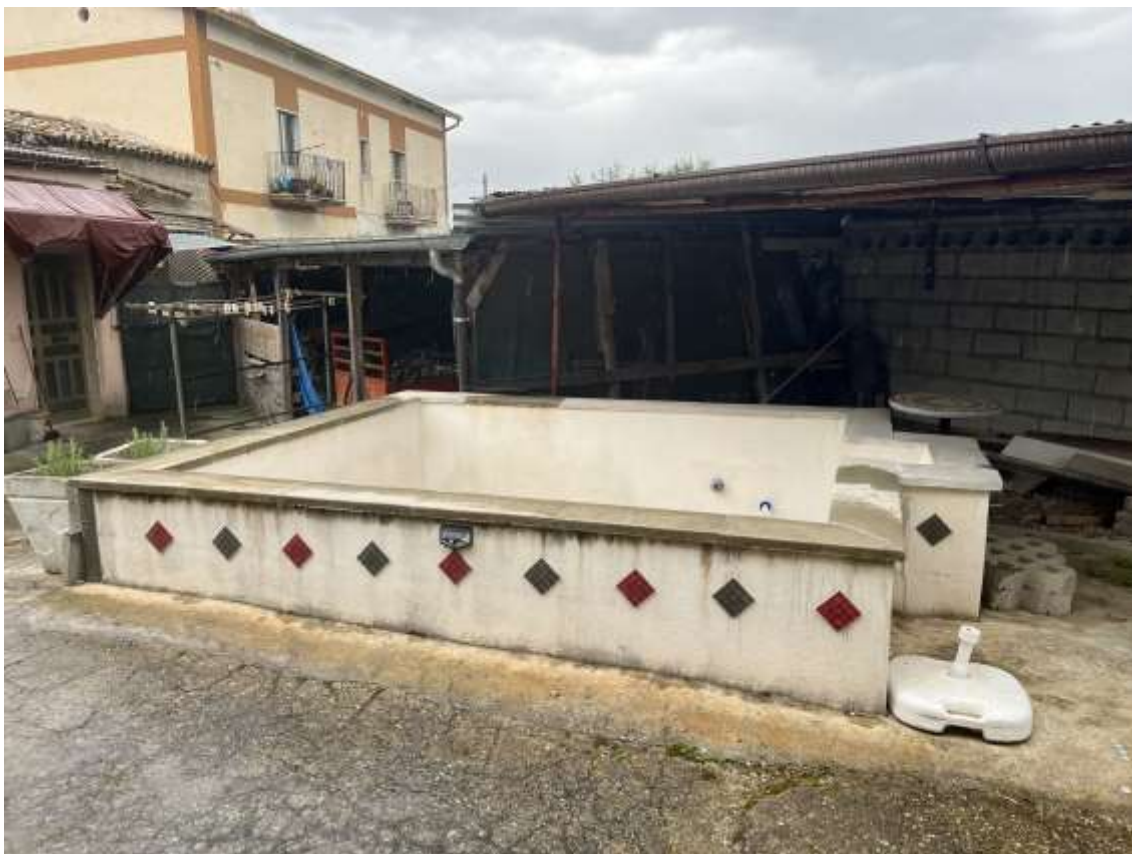
Fig.7 – Vista della vasca all'interno dello spazio pertinenziale