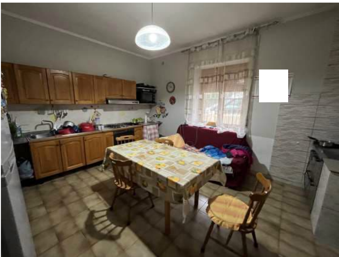
Fig.14 – Vista vano cucina posto sul fronte ovest del sub.2 - PT