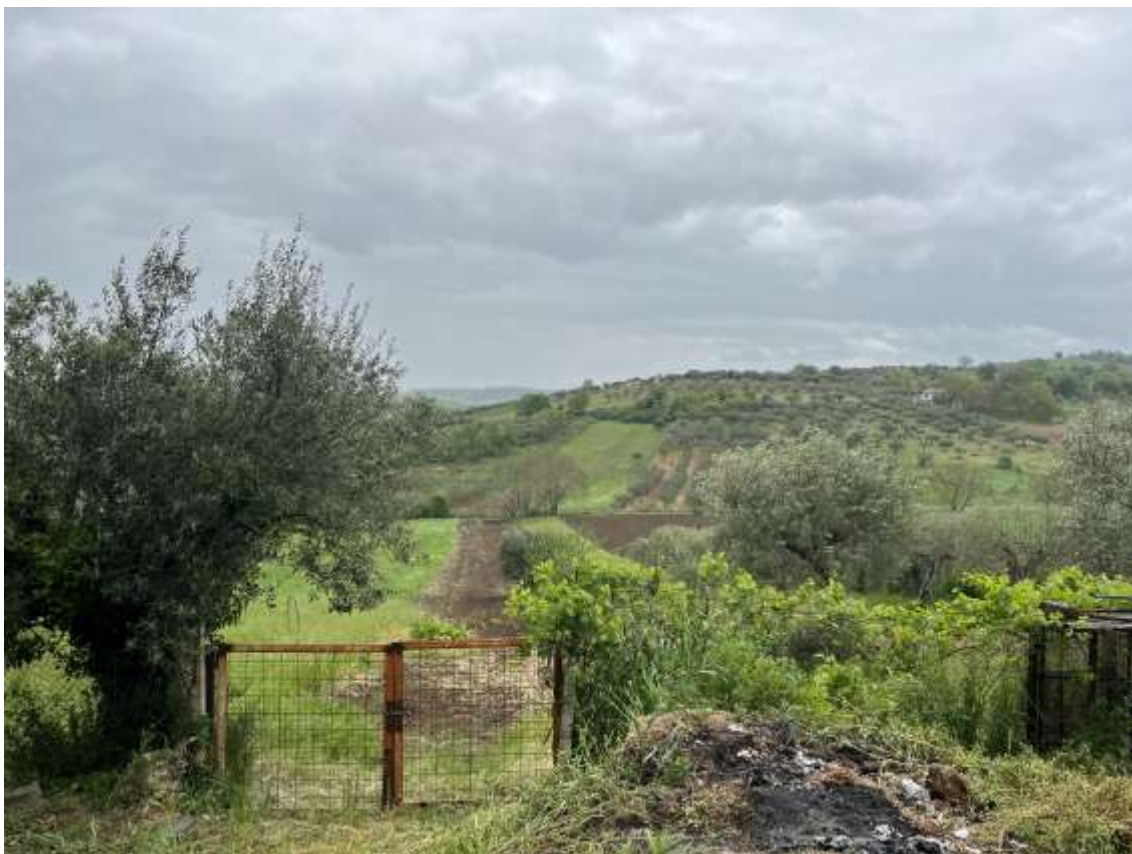
Fig.31 – Vista ravvicinata da ovest verso est della p.lla 693