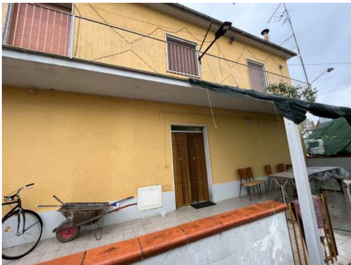
Fig.11 – Vista sulla facciata principale (nord) p.lla 694 sub.2 e su balcone