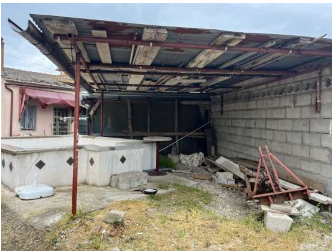
Fig.6 – Vista dello spazio pertinenziale