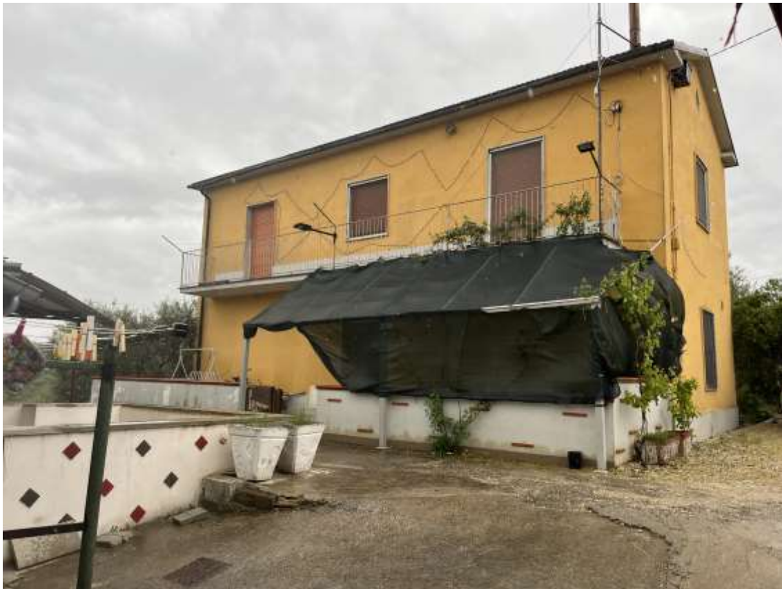
Fig.10 – Vista della facciata principale (nord) p.lla 694 sub.2