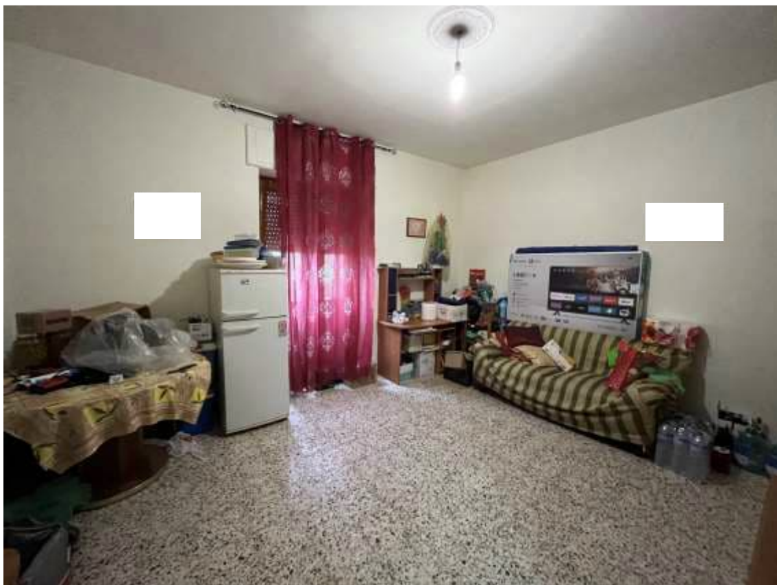
Fig.15 – Vista vano soggiorno/salotto posto sul fronte est del sub.2 - PT